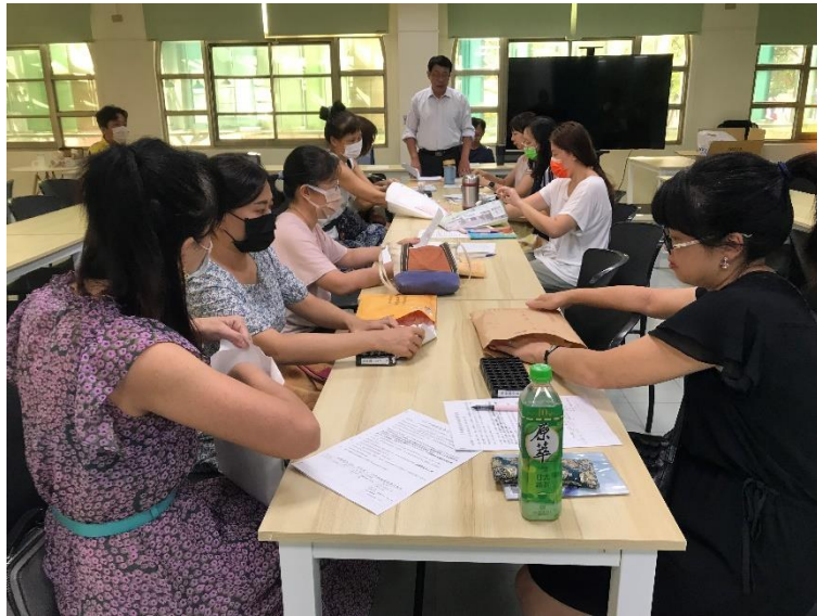
校長主持會議及致詞