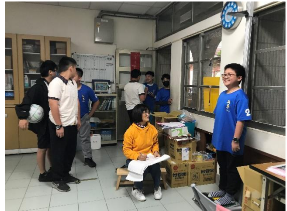
每周提供 BMI 过重学生追踪体重