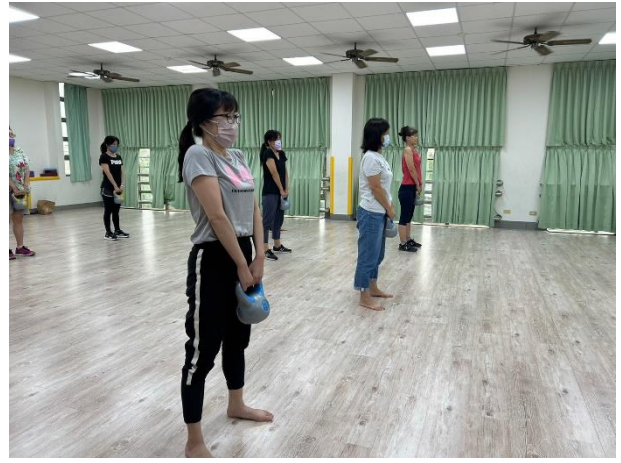
教師體適能增能研習