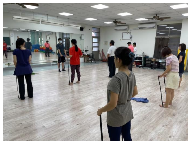
教師體適能增能研習