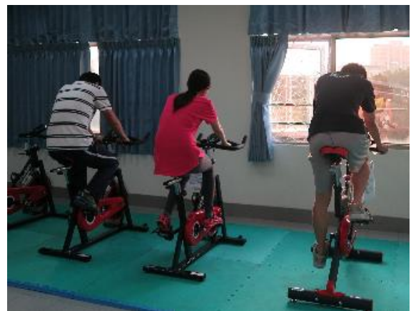
多樣運動器材供師生訓練體能