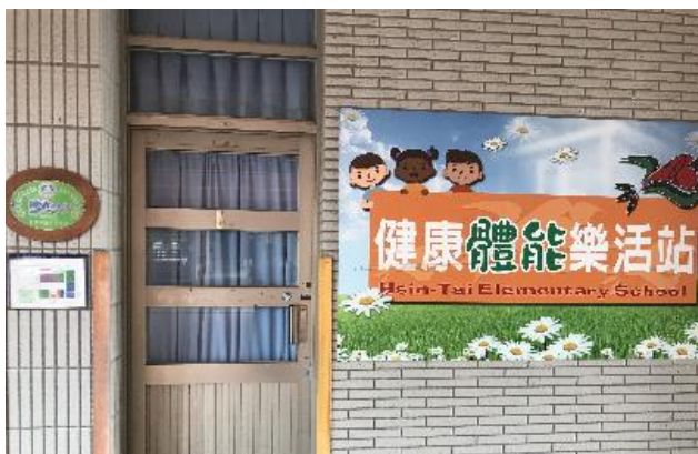
設立「健康體能樂活站」