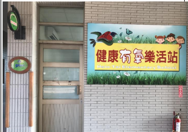
設立「健康有氧樂活站」