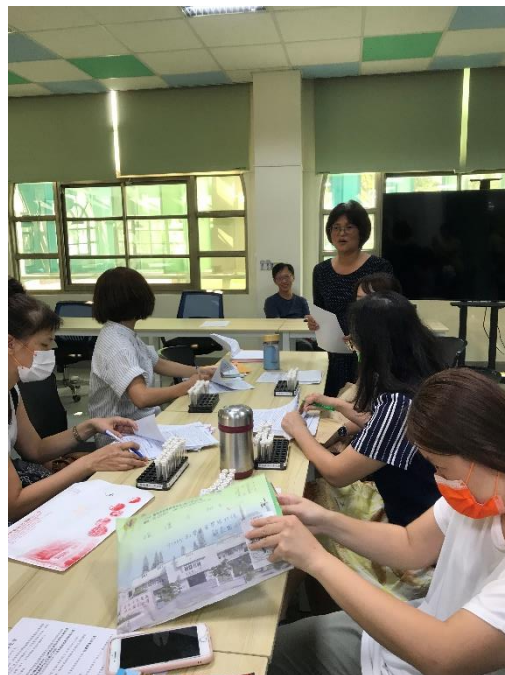
護理師說明健康檢查行前中後注意事項