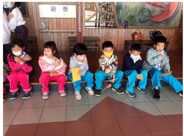
施打後休息觀察15分鐘