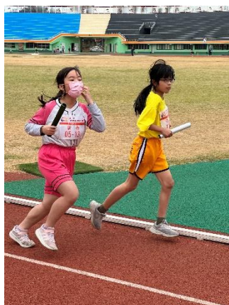
選手奮力地奔跑著