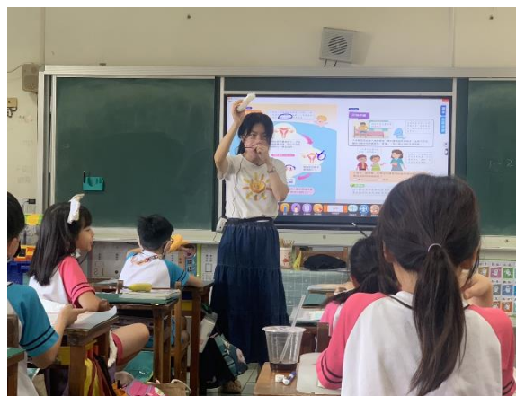
融入課程中衛教女生月經週期，如何正確使用衛生棉