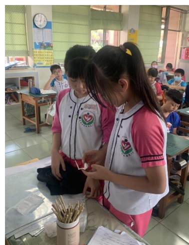
學生課後互相練習如何使用衛生棉