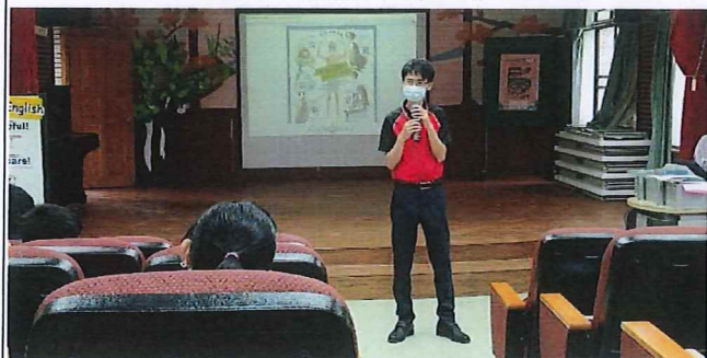
說明：校長主持叫叫伸拋划救溺5步宣 導。