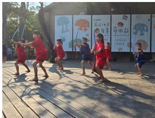
113.4.4 兒童藝術節-蕭壠文化園區