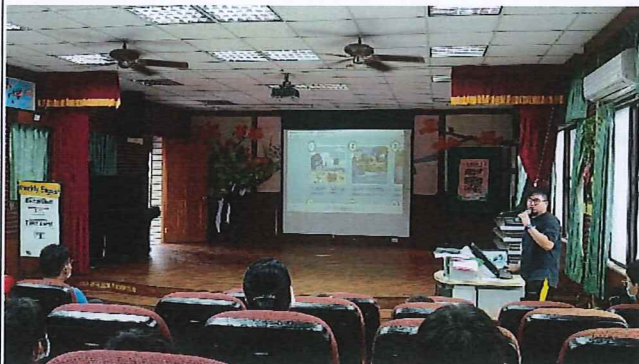
說明：教師宣導防溺十招。