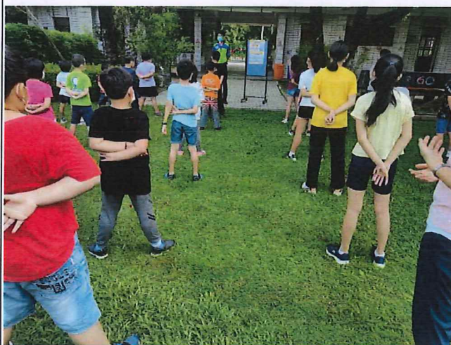
說明：持續進行水域安全宣導。