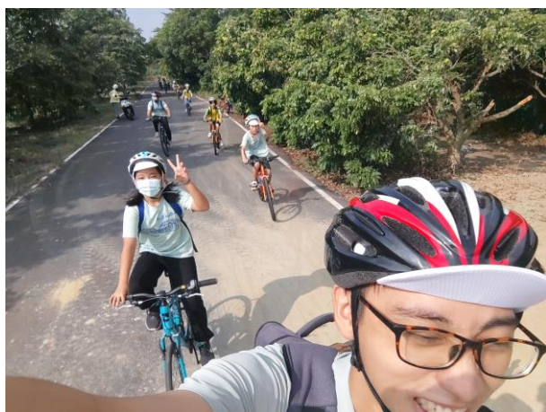
漫遊菱波官田欣賞沿途美景