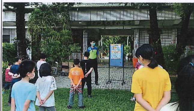
說明：持續進行水域安全宣導。