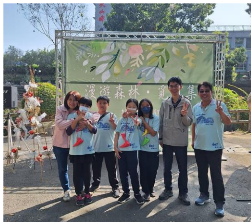
112.12.2 受邀「慢慢來市集」表演