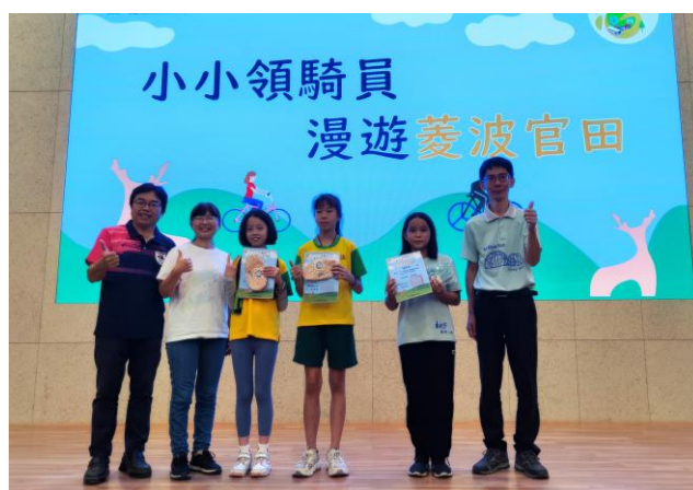
頒發小小領騎員證書