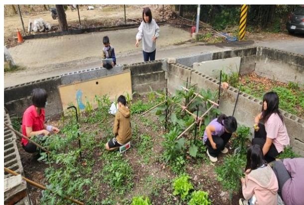
3-4 年級觀察蔬菜生長狀況