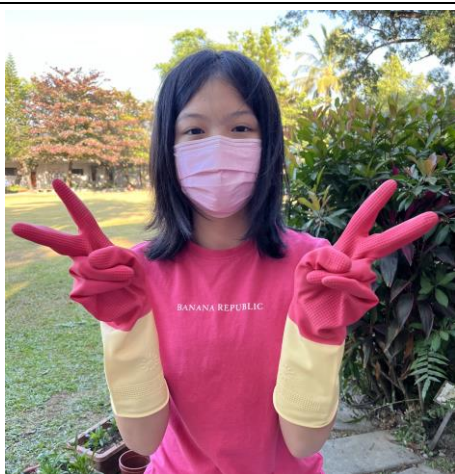
美麗的女孩為校園美化增添光彩