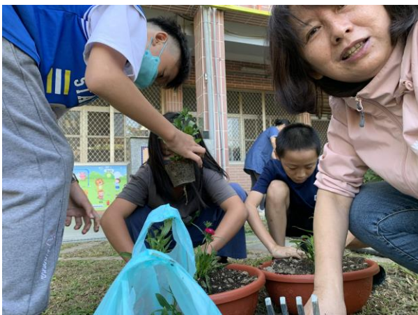
總務主任偕同學生為校園綠美化而努力