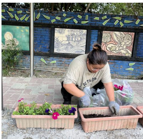
家長也來協助幫忙