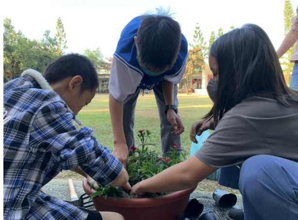
學生們努力栽花為美化校園盡心力