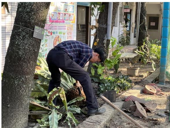
校長也親自動手整理校園