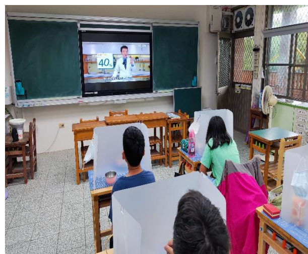
六年級餐前五分鐘鐘飲食教育