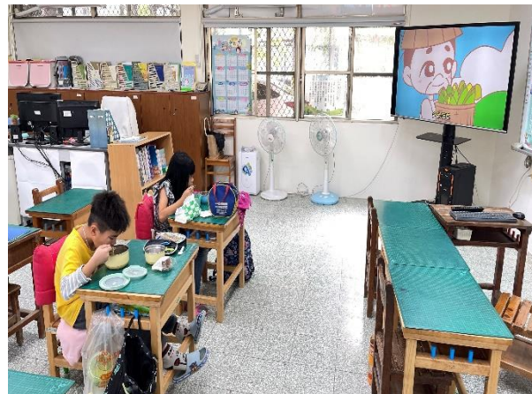
二年級餐前五分鐘鐘飲食教育