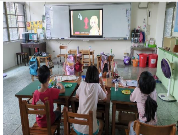
三年級餐前五分鐘鐘飲食教育