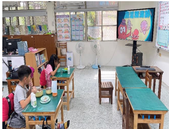
二年級餐前五分鐘鐘飲食教育