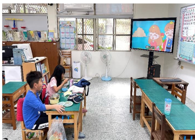
二年級餐前五分鐘鐘飲食教育