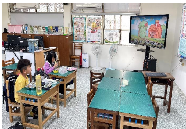
二年級餐前五分鐘鐘飲食教育