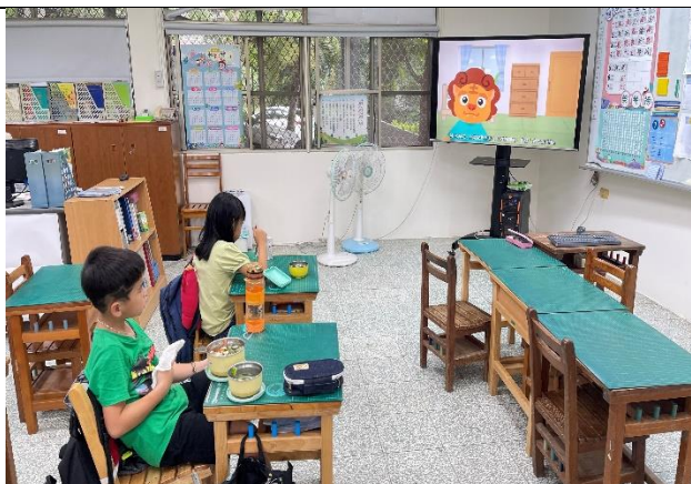
二年級餐前五分鐘鐘飲食教育