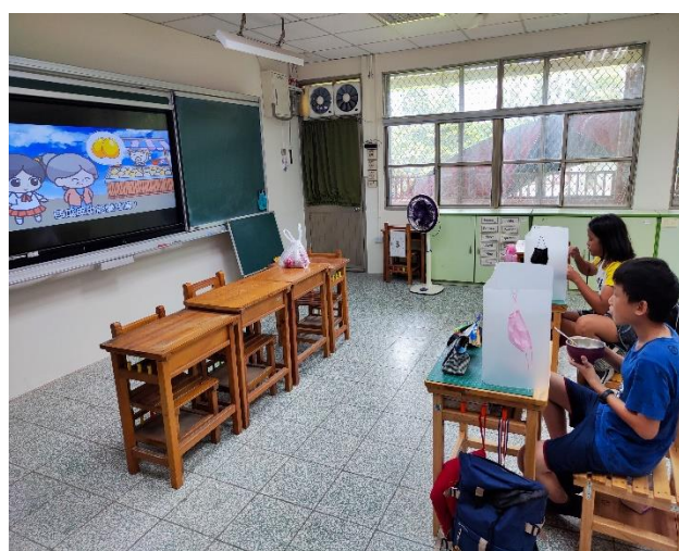
六年級餐前五分鐘鐘飲食教育