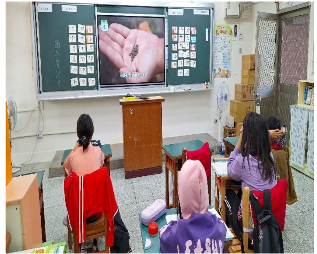
四年級餐前五分鐘鐘飲食教育