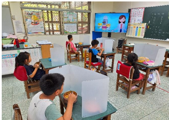
一年級餐前五分鐘鐘飲食教育