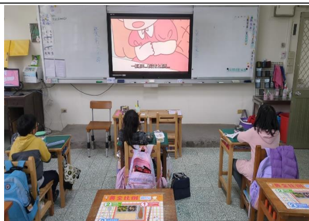
三年級餐前五分鐘鐘飲食教育