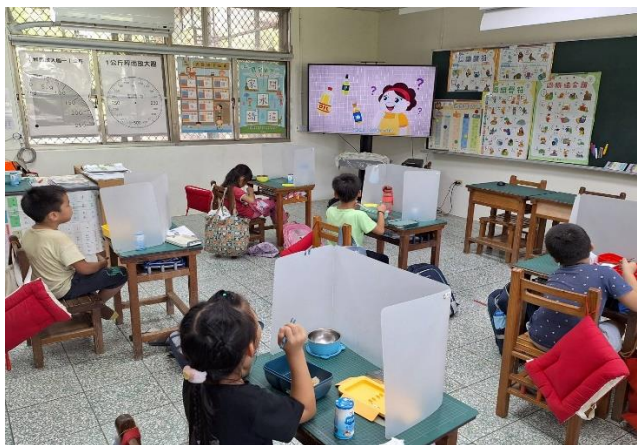
一年級餐前五分鐘鐘飲食教育