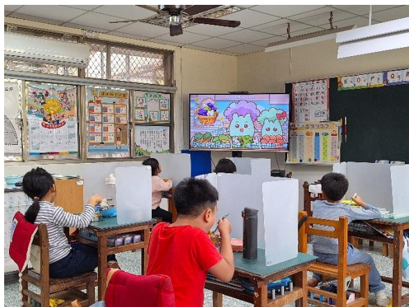
一年級餐前五分鐘鐘飲食教育