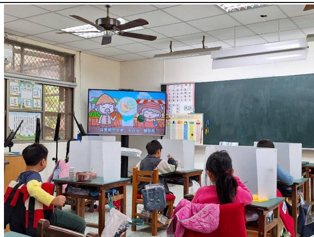
一年級餐前五分鐘鐘飲食教育