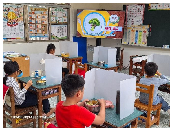
一年級餐前五分鐘鐘飲食教育