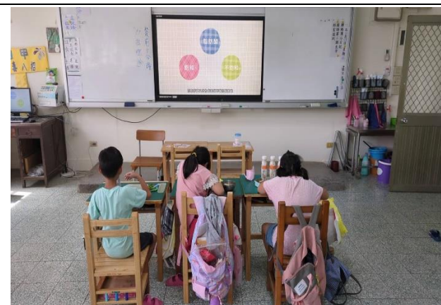
三年級餐前五分鐘鐘飲食教育