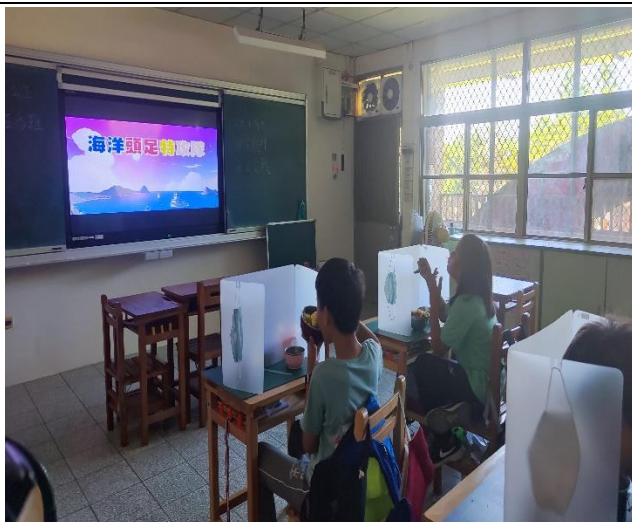
六年級餐前五分鐘鐘飲食教育