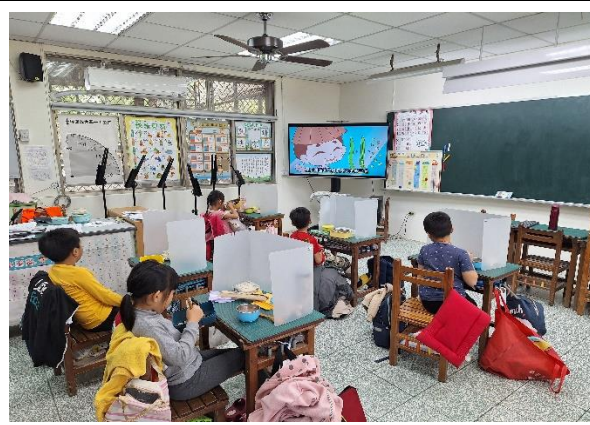
一年級餐前五分鐘鐘飲食教育