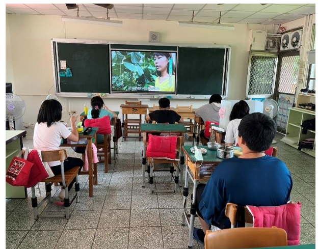
五年級餐前五分鐘鐘飲食教育