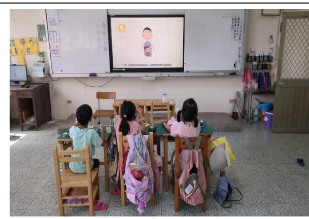
三年級餐前五分鐘鐘飲食教育