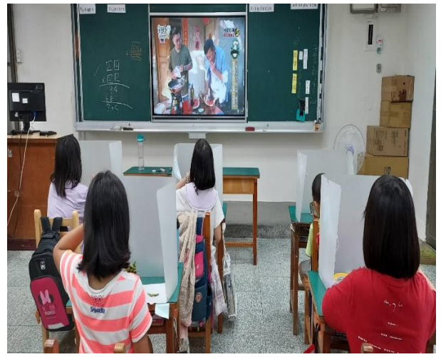
四年級餐前五分鐘鐘飲食教育