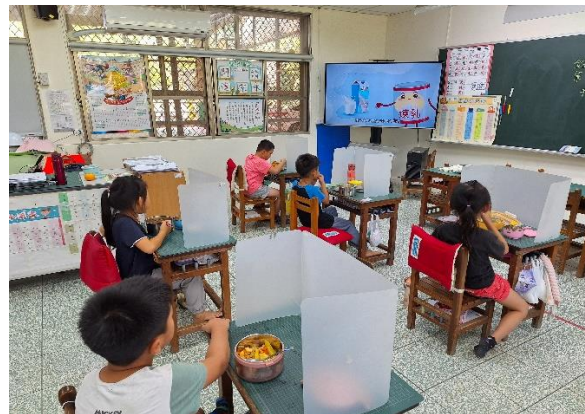
一年級餐前五分鐘鐘飲食教育