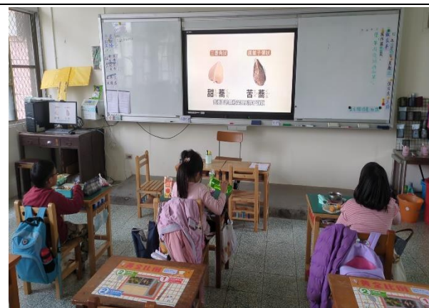
三年級餐前五分鐘鐘飲食教育