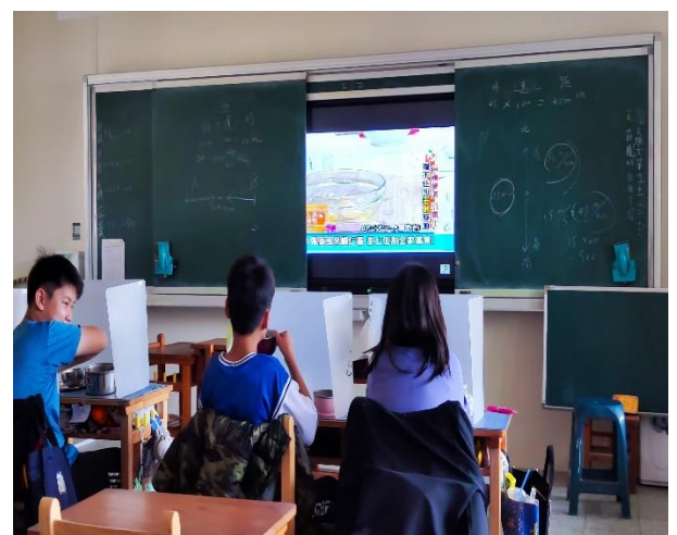
六年級餐前五分鐘鐘飲食教育