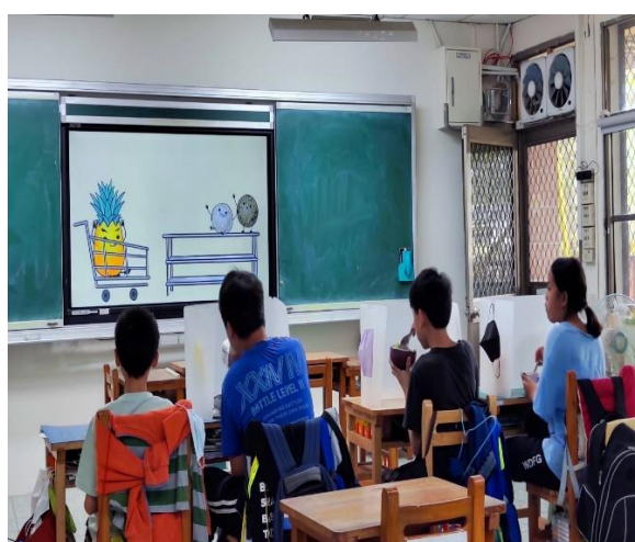
六年級餐前五分鐘鐘飲食教育