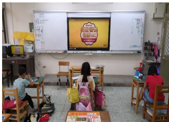
三年級餐前五分鐘鐘飲食教育