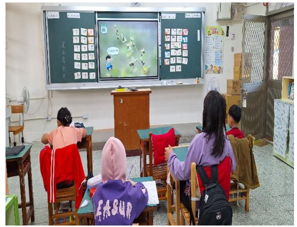
四年級餐前五分鐘鐘飲食教育