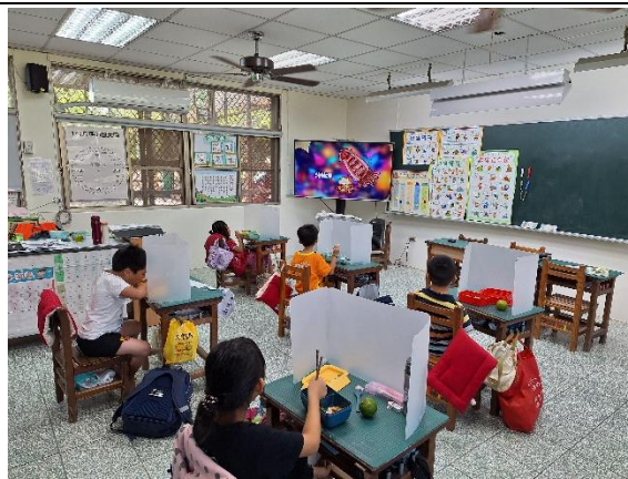
一年級餐前五分鐘鐘飲食教育