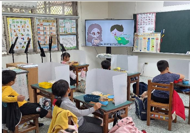
一年級餐前五分鐘鐘飲食教育