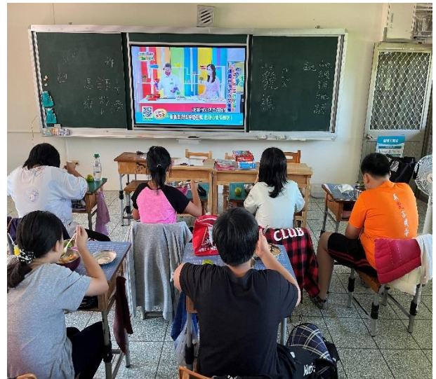
五年級餐前五分鐘鐘飲食教育