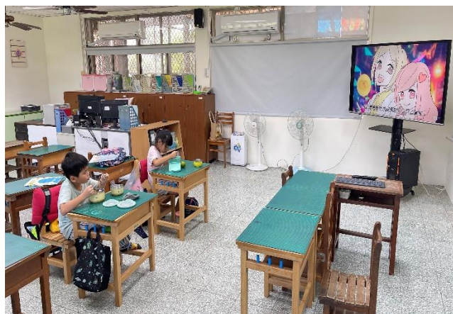
二年級餐前五分鐘鐘飲食教育