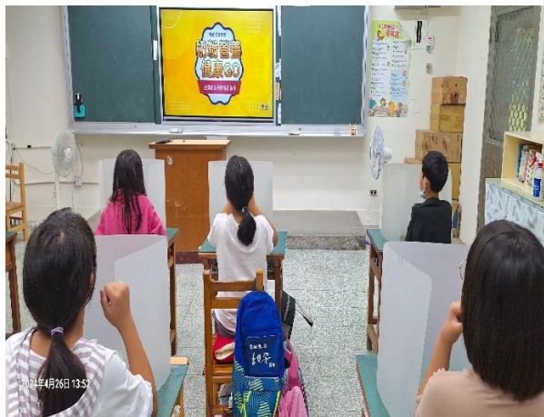
四年級餐前五分鐘鐘飲食教育