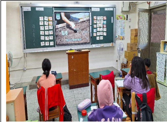
四年級餐前五分鐘鐘飲食教育