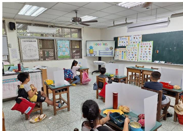
一年級餐前五分鐘鐘飲食教育