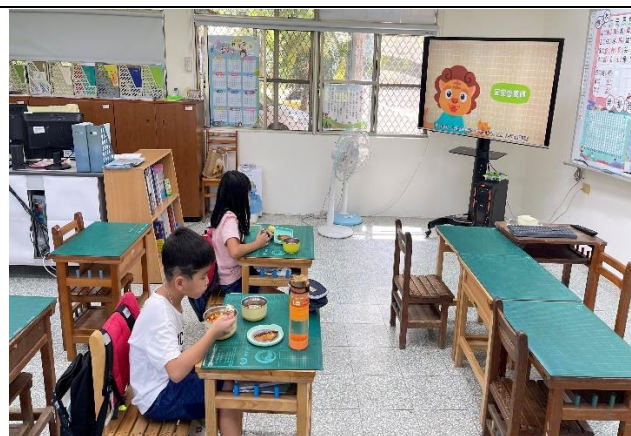
二年級餐前五分鐘鐘飲食教育