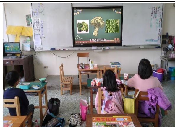
三年級餐前五分鐘鐘飲食教育