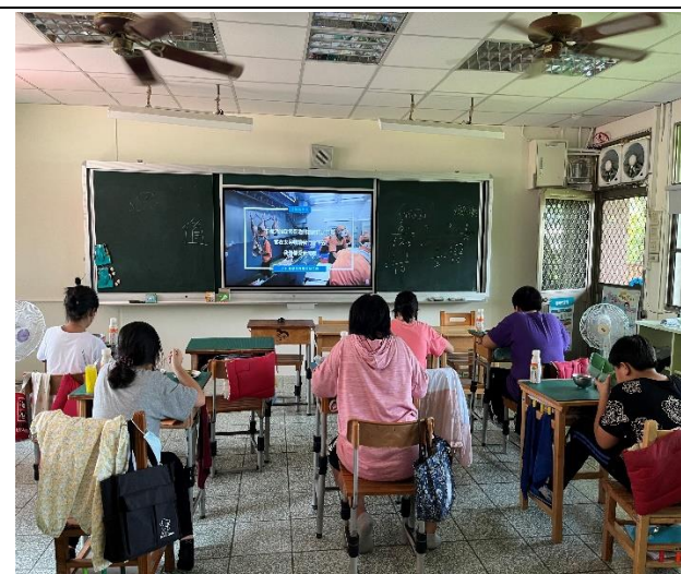
五年級餐前五分鐘鐘飲食教育