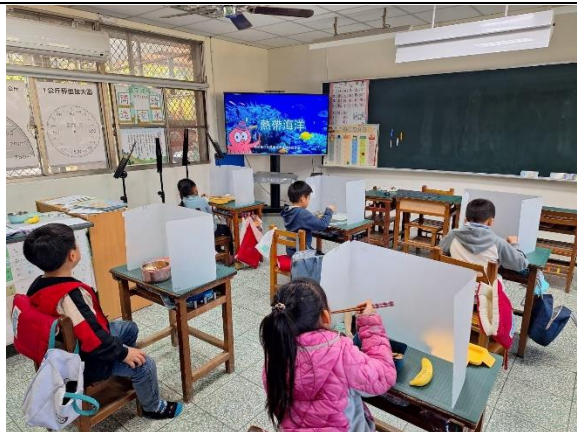
一年級餐前五分鐘鐘飲食教育