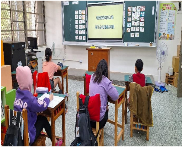
四年級餐前五分鐘鐘飲食教育