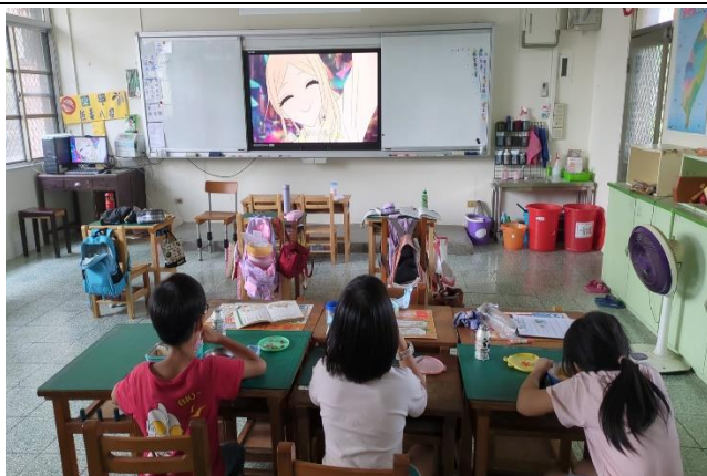
三年級餐前五分鐘鐘飲食教育