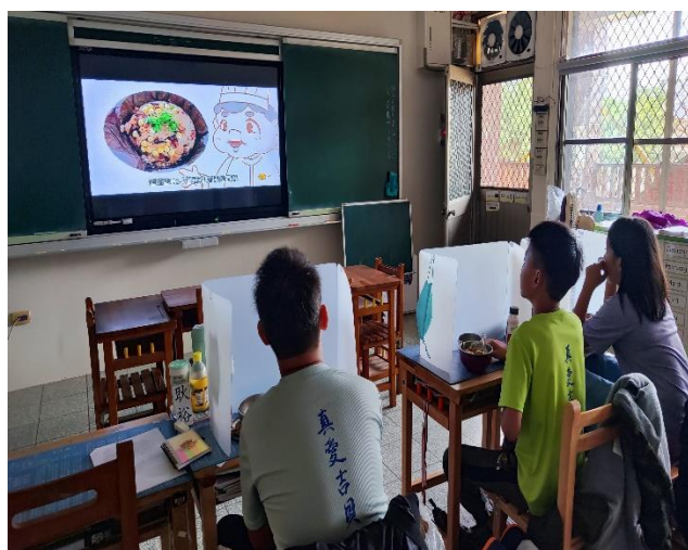
六年級餐前五分鐘鐘飲食教育