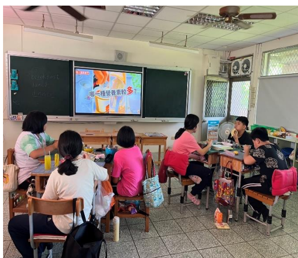
五年級餐前五分鐘鐘飲食教育