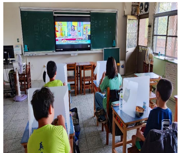
六年級餐前五分鐘鐘飲食教育