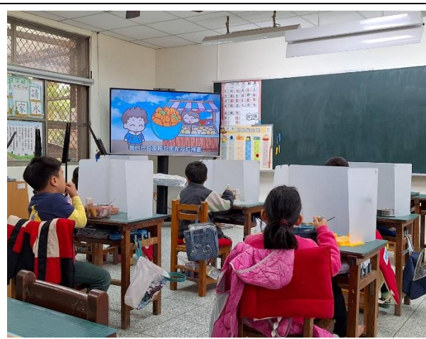
一年級餐前五分鐘鐘飲食教育