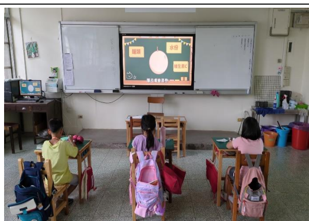
三年級餐前五分鐘鐘飲食教育