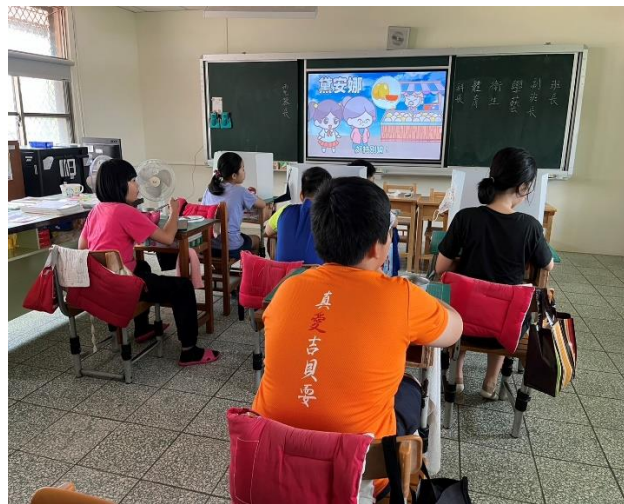
五年級餐前五分鐘鐘飲食教育