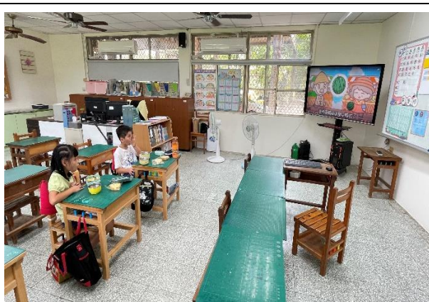
二年級餐前五分鐘鐘飲食教育