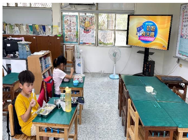
二年級餐前五分鐘鐘飲食教育