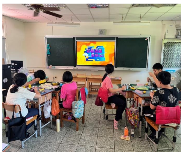
五年級餐前五分鐘鐘飲食教育