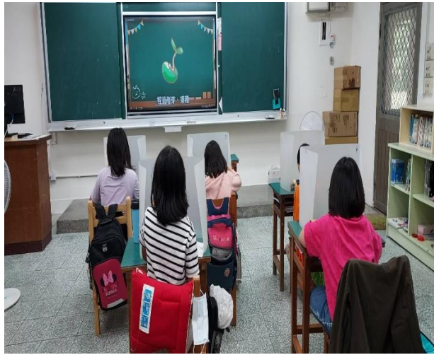
四年級餐前五分鐘鐘飲食教育