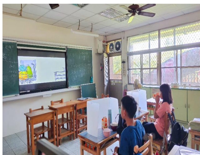
六年級餐前五分鐘鐘飲食教育