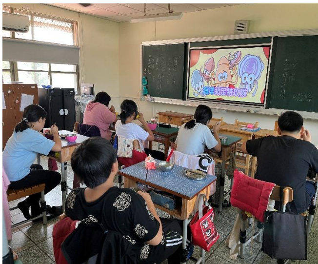
五年級餐前五分鐘鐘飲食教育