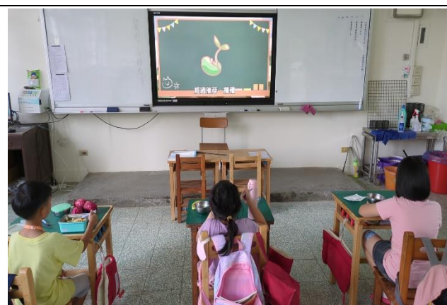
三年級餐前五分鐘鐘飲食教育