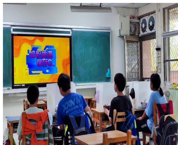
六年級餐前五分鐘鐘飲食教育