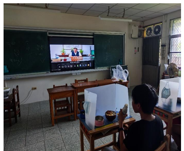
六年級餐前五分鐘鐘飲食教育