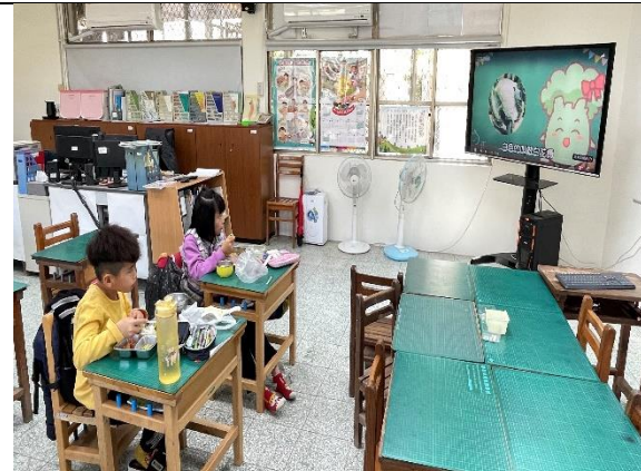
二年級餐前五分鐘鐘飲食教育