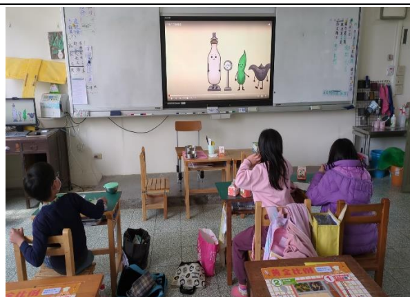
三年級餐前五分鐘鐘飲食教育