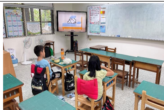
二年級餐前五分鐘鐘飲食教育