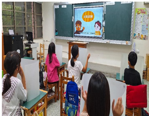
四年級餐前五分鐘鐘飲食教育