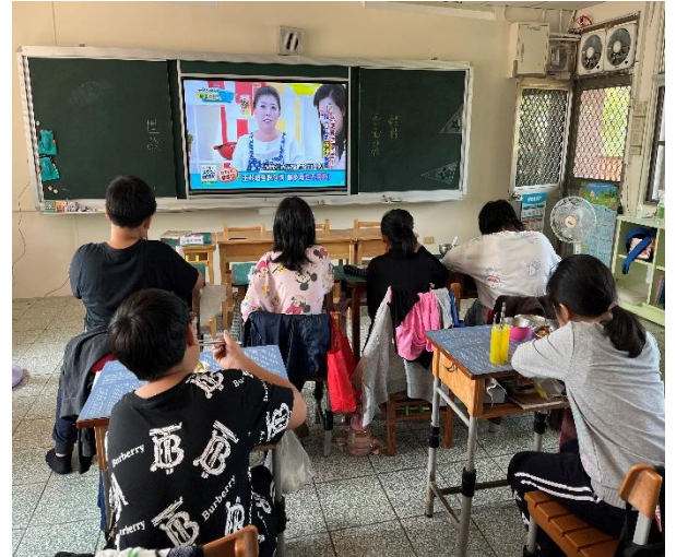
五年級餐前五分鐘鐘飲食教育