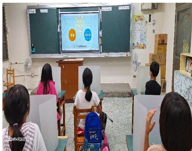
四年級餐前五分鐘鐘飲食教育