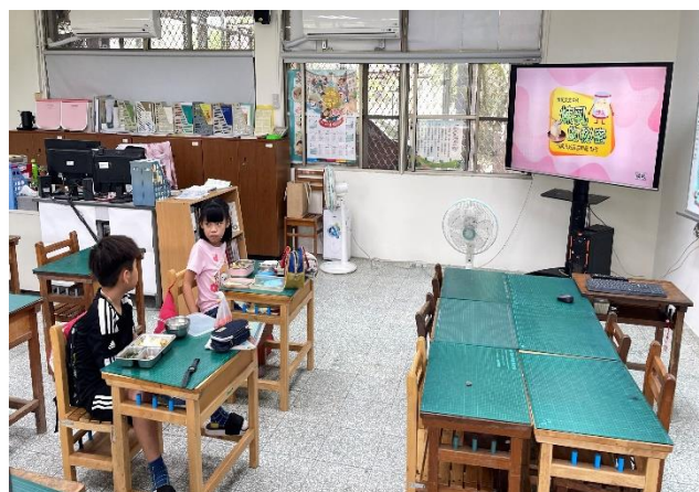
二年級餐前五分鐘鐘飲食教育