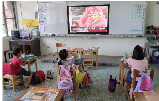
三年級餐前五分鐘鐘飲食教育