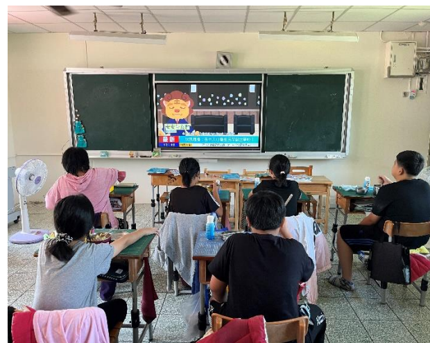
五年級餐前五分鐘鐘飲食教育