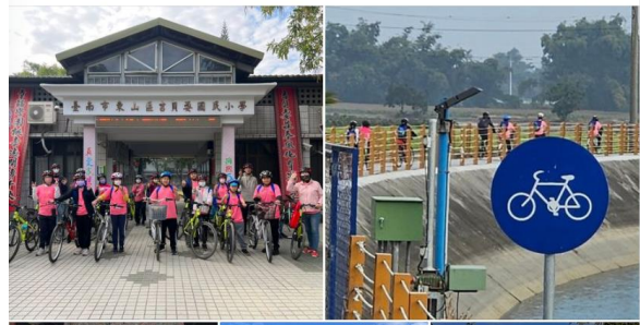
「山海圳國家綠道行-家鄉踏查」自行車之 旅

期末考之後的輕鬆時刻 學校安排高年級的小木棉們進行戶外教育- 「山海圳國家綠道行-家鄉踏查」 課程結合了自然領域、社會領域、綜合領域，並且融入了環境教育、安全教育、品德教育..... 查看更多