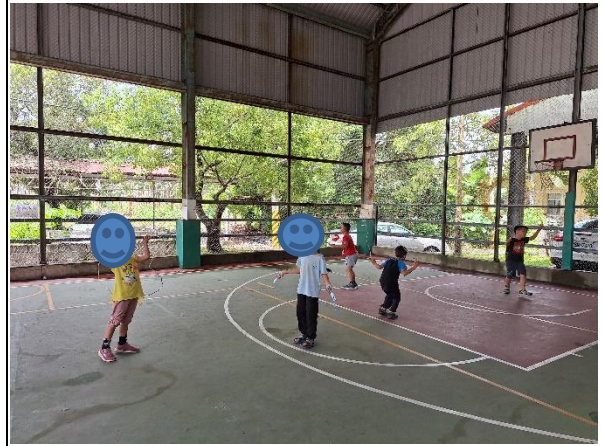
說明：在風雨球場跳繩。