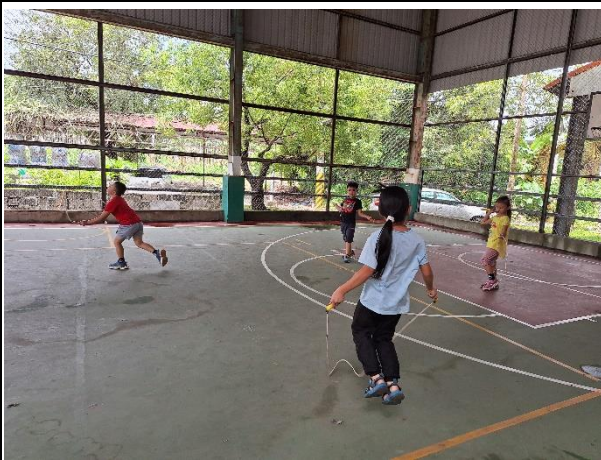
說明：在風雨球場跳繩。