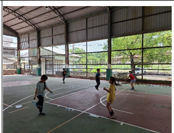
說明：在風雨球場跳繩。