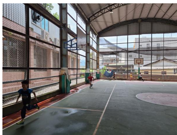
學生繞著風雨球場跑步