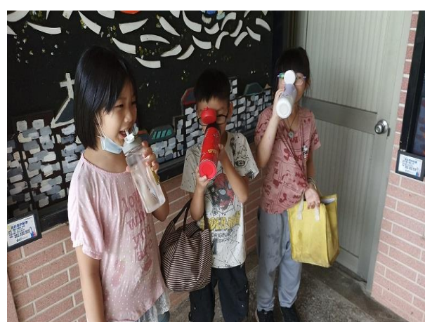
我愛喝白開水(適量喝水有益健康)