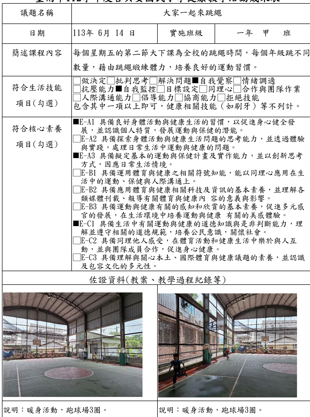
臺南市112學年度吉貝耍國民小學健康教學活動成果表