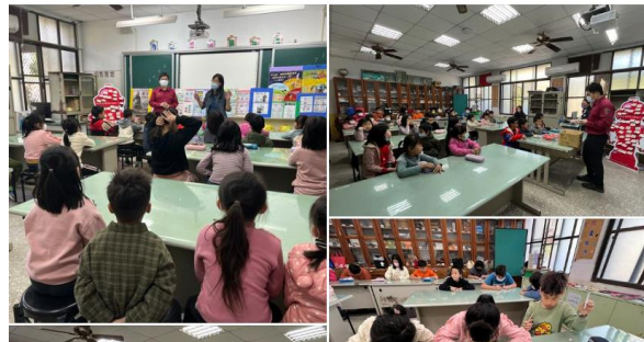
東山消防分隊蒞校進行宣導

消防叔叔辛苦了！ 東山消防分隊 119是消防節 為了感謝辛苦的消防員叔叔們..... 查看更多