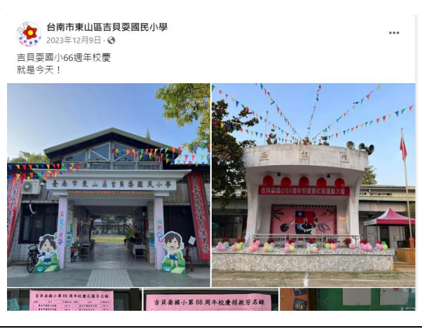
校慶暨健康促進運動大會