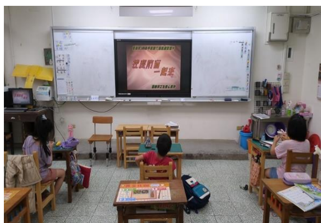
視力保健(控度防盲一起來)