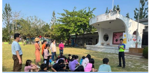
防災教育-地震時緊急避難

好大的地震啊！ 正值小木棉們的打掃時間 全校師生不慌不亂 原地蹲下等待地震停止後 趕緊到操場集合..... 查看更多