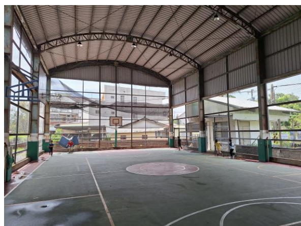
學生繞著風雨球場跑步