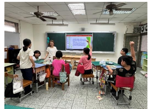
說明：學生發表意見。