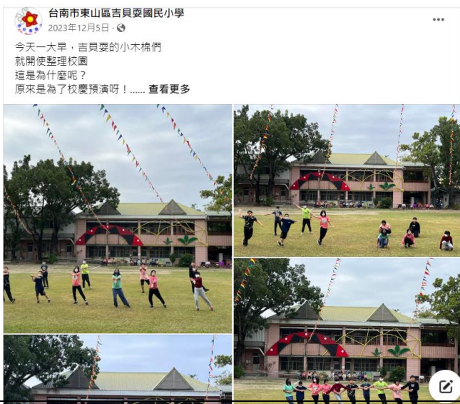
校慶暨健康促進運動大會預演