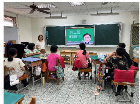
說明：領藥注意事項。