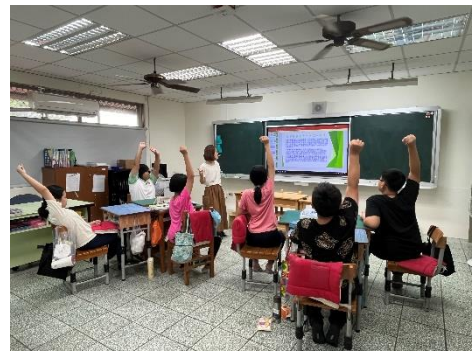
說明：學生踴躍回答問題。