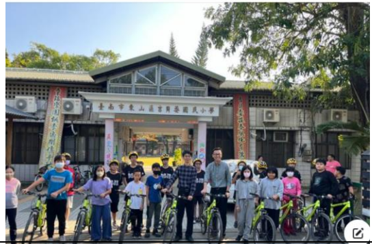
與東山國中進行自行車交流

2023/11/21 感謝東山國中的學長姐 騎著腳踏車到吉貝寮國小來 贈送學弟妹腳踏車~