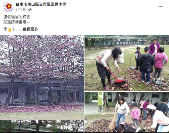
全校一起打掃校園