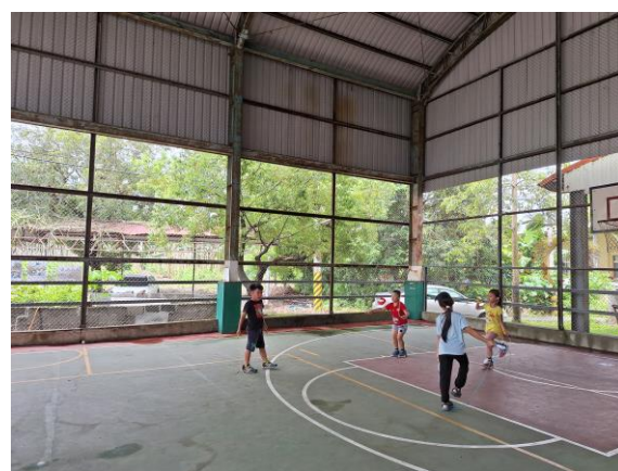
學生在 20 分鐘的下課時間練習跳繩