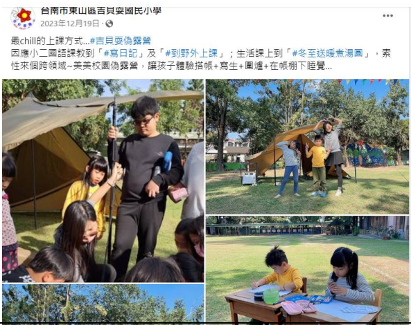
美美校園偽露營，讓學生體驗搭帳棚