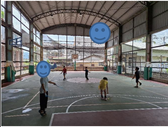
說明：在風雨球場跳繩。