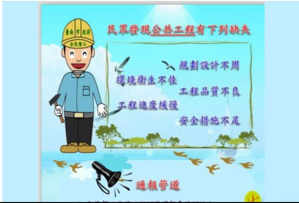
公共工程安全宣導