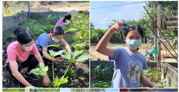
食農教育-飲食安全

最近中午常常在加菜~ 小木棉們自己種、自己洗、自己煮、自己調味、自己吃 自己動手的最好吃..... 查看更多