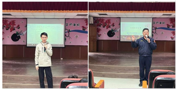
白河分局蒞校進行交通安全及防空避難宣 導

感謝白河分局的帥哥哥和美女姐姐 113.3.1蒞臨吉貝寮 提醒小木棉們交通安全注意事項 並教導防空避難的正確姿勢 小木棉們都很認真學習囉~..... 查看更多