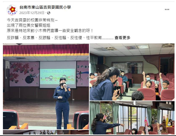
臺南市政府警察局婦幼警察隊蒞校進行反 詐騙、反家暴、反跟騷、反性騷宣導