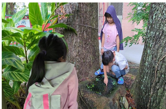
預防登革熱(巡視校園小水池是否有孑孓)