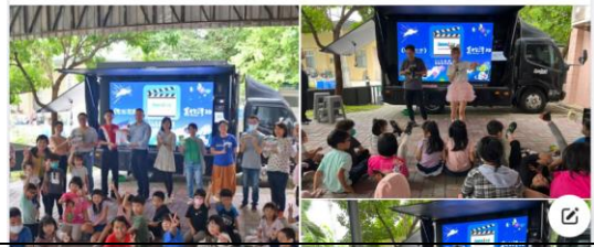
美力台灣 3D 行動電影院蒞校

2023/10/16 歡迎美力台灣3D行動電影院蒞校 感謝群創教育基金會 看到阮老師裝了義肢仍不懈、努力往前奔跑 著實給學生帶來一場震撼教育！ 接著學生新奇地戴上3D眼鏡 螢幕裡的一切，栩栩如生出現在眼前 彷彿手一伸出就能抓到！ 看著學生跟著電影情節一起歡呼、一會兒又害怕得東西歪 可愛又有趣 相信對他們來說一定是個難忘的體驗！