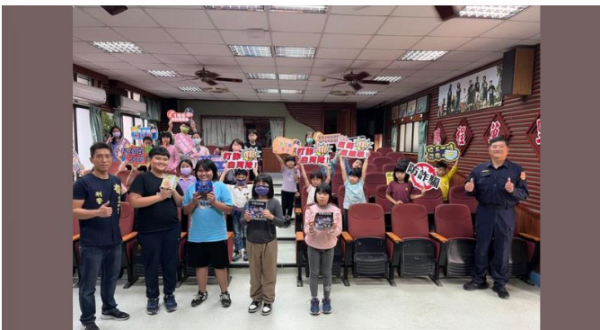
白河分局蒞校進行交通安全及反詐騙宣導

感謝白河分局的警察叔叔 蒞臨吉貝寮國小 帶給小木棉們交通安全知識 還有反詐騙知識..... 查看更多