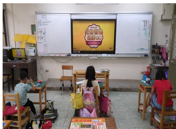
餐前 5 分鐘(奶粉營養健康 GO)