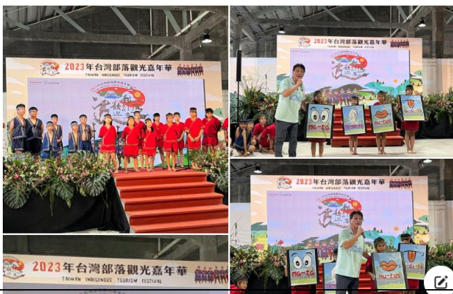
參加 2023 年台灣部落觀光嘉年華

2023/10/13 重頭戲 2023年台灣部落觀光嘉年華 小朋友都很賣力表演呢~~~ 贏得觀眾熱烈的掌聲！..... 查看更多