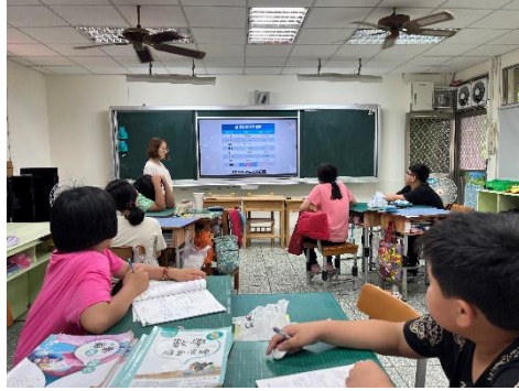
說明：認識健保及健保卡。