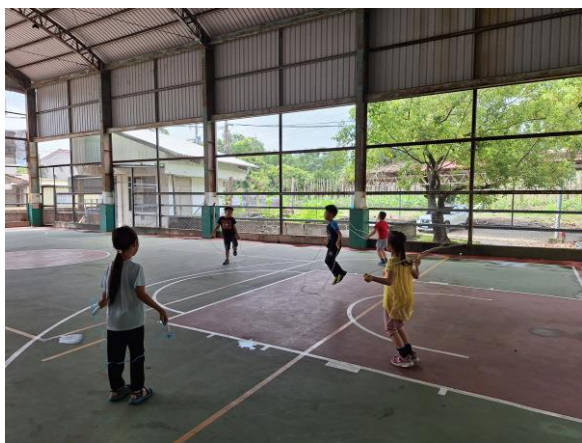
學生在 20 分鐘的下課時間練習跳繩