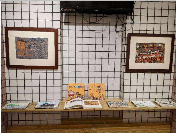
樹人小藝廊學生作品展示

5-2-1 學校運用各種策略或設備設施，營造社會情緒環境、建構愉快的校園氛圍(3%)。