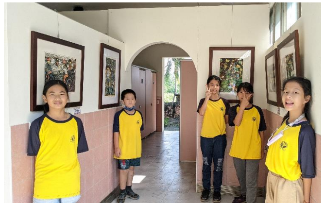
樹人廁所藝廊開幕式舉辦小小藝術家導覽活動