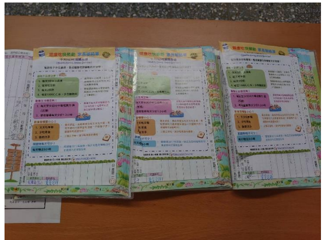
運用聯絡本進行健康宣導