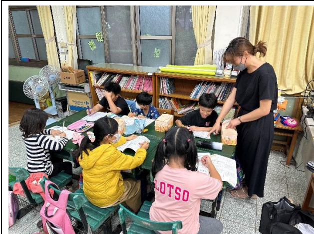
說明：中年級課業輔導注意用眼距離