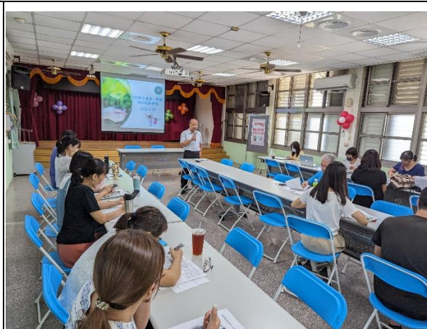
說明：期初與課後照顧老師說明注意事項