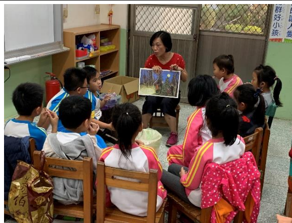
說明：低年級課輔少用3C，注意用眼距離