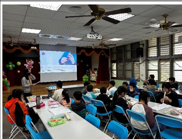
說明：操作性課程-直笛