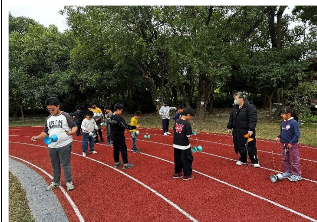
說明：操作性課程-扯鈴