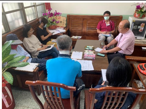
說明：行政會議討論課後照顧執勤重點