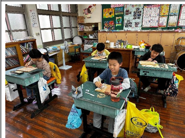
說明：操作性課程-創意木雕