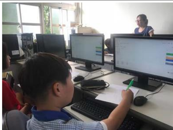
說明：利用電腦進行課輔注意用眼距離