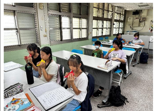
說明：操作性課程-陶笛