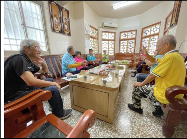
邀請學校導護志工共同推動健促議題