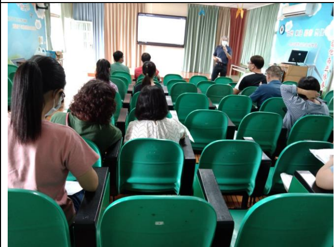
校務會議邀請家長代表討論健促議題