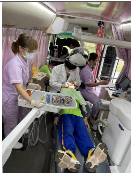
學生進行口腔檢查