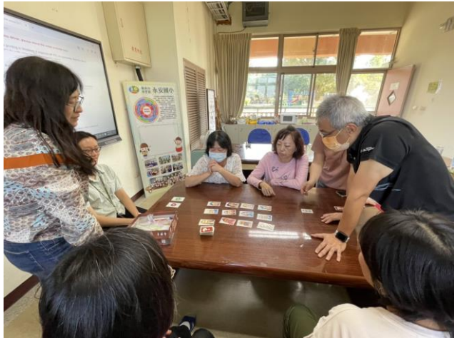
辦理教職員工健康體適能活動-桌遊