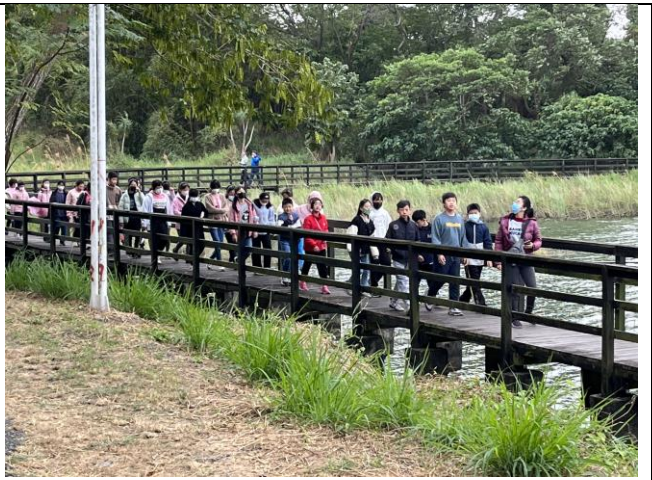
全校師生小南海健走