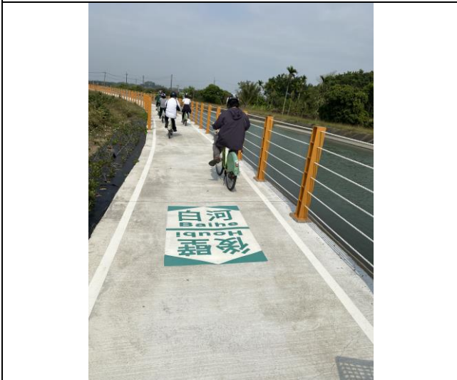
辦理教職員工健康體適能活動