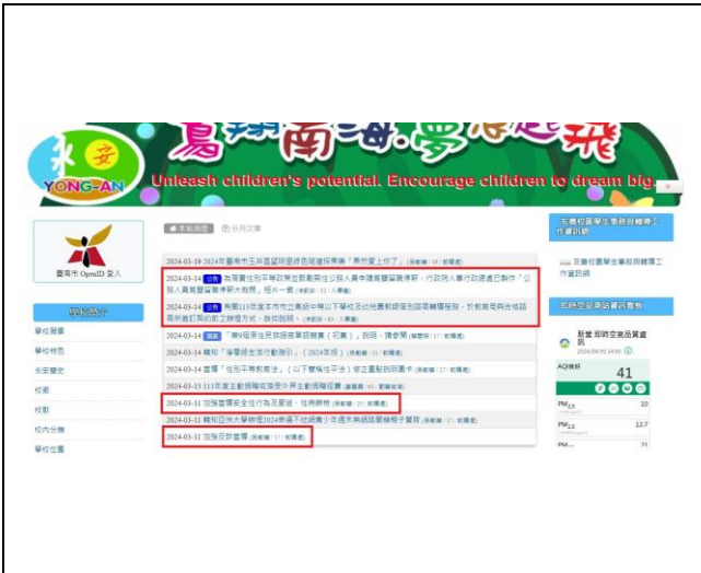
學校網站登錄健康資訊