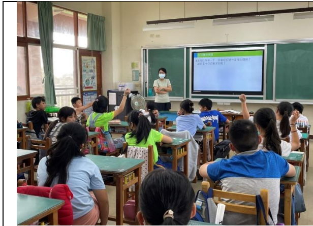
說明：詢問是否曾經犯錯