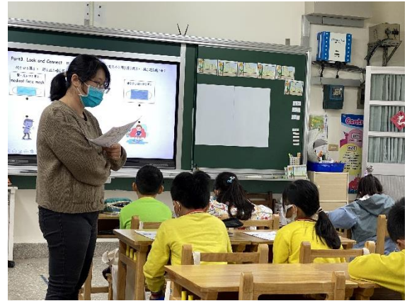
說明：說明學習單內容