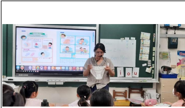
說明：教師教導學生衛生棉使用方法