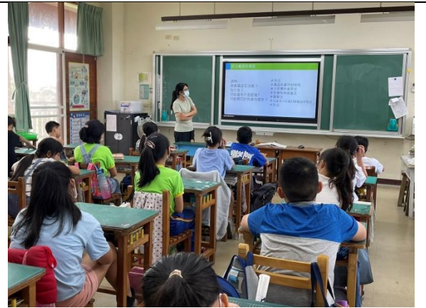
說明：總結吸食毒品可能觸犯的法條