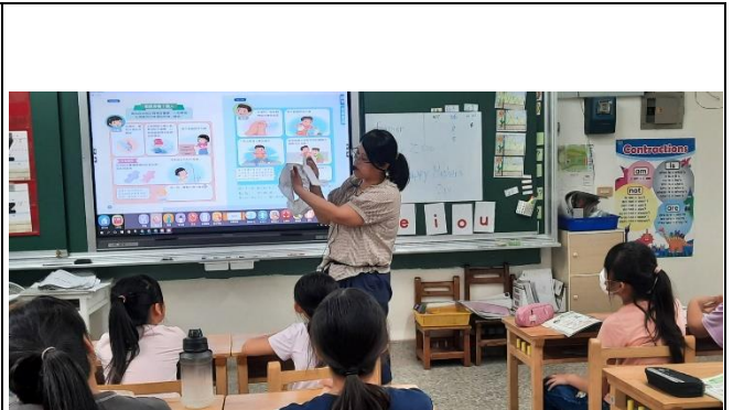
說明：教師說明衛生棉正確使用方式