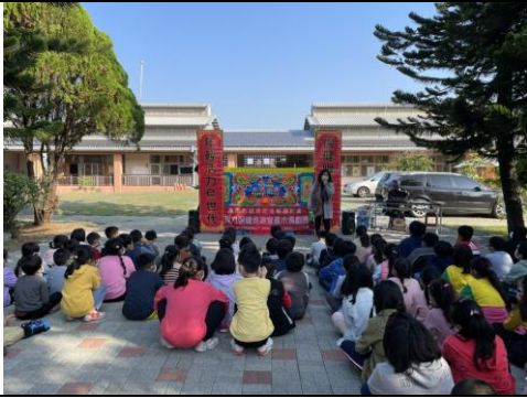
視力保健校園巡迴偶戲