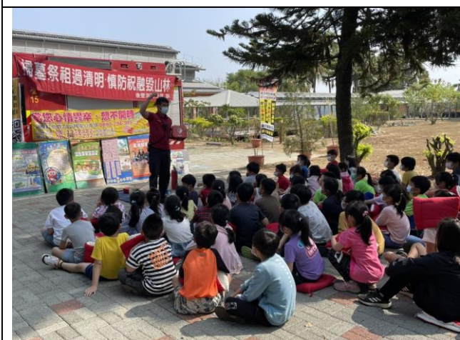
消防隊入校宣導急救觀念