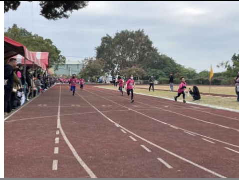
運動會班級分組跑