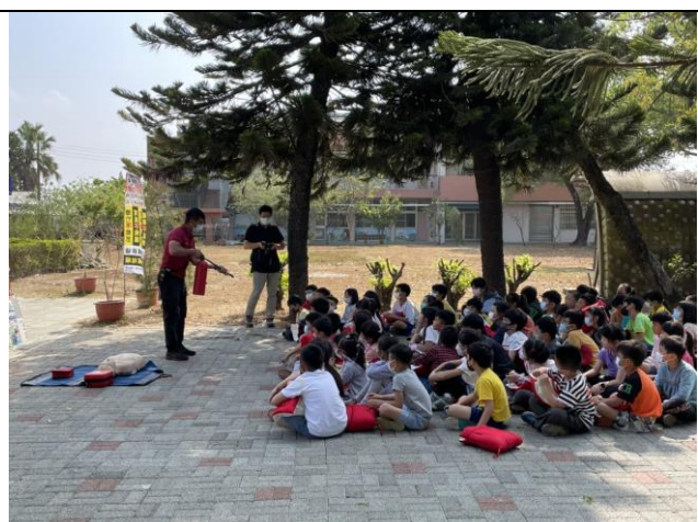
消防隊滅火器使用示範