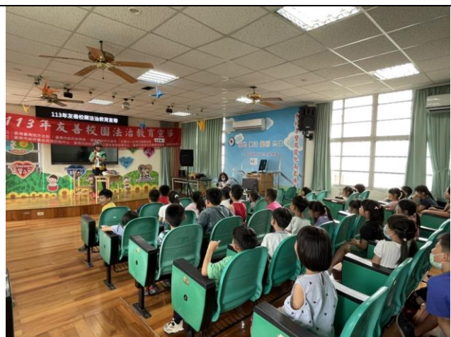
友善校園法治教育宣導