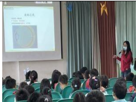
衛生所護理師到校進行健促宣導