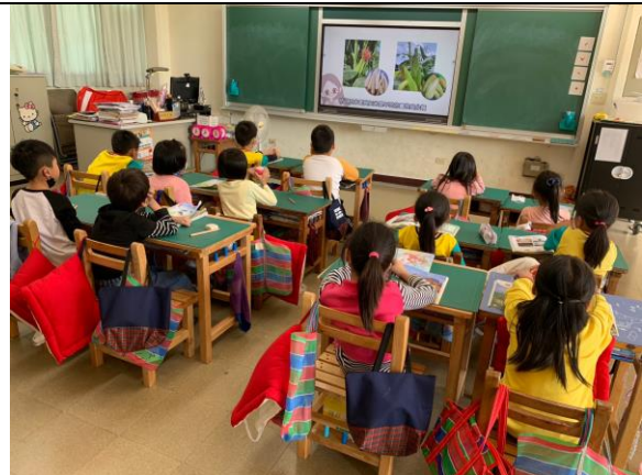
健康體適能與飲食教育-餐前5分鐘