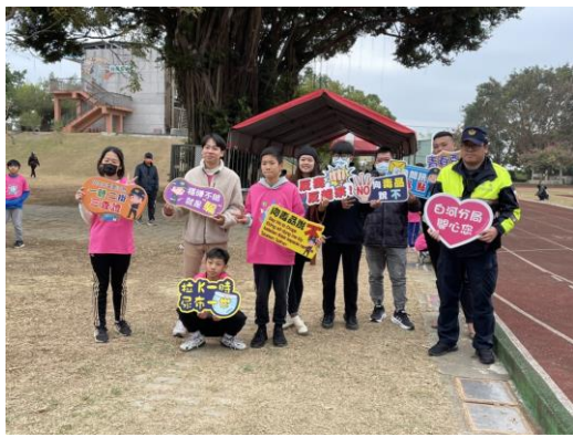
和警察合作進行宣導