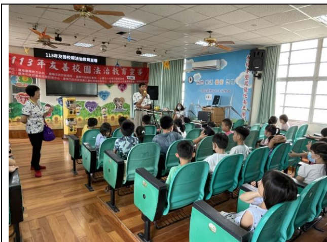
友善校園法治教育宣導