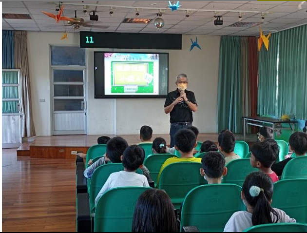
友善校園-口腔衛生宣導