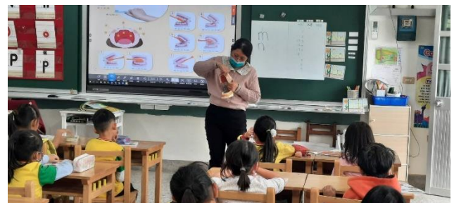
老師進行刷牙示範