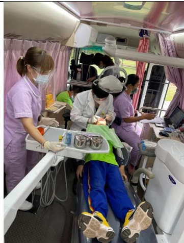
牙醫師到校進行窩溝封填