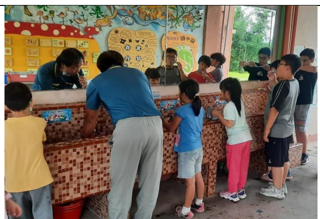
師生一起潔牙，並利用鏡子檢視