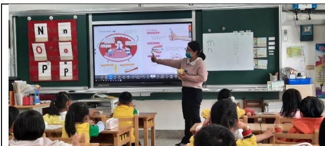
教師教導正確刷牙方式