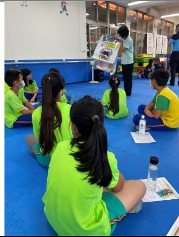
衛生所向學生宣導口腔保健