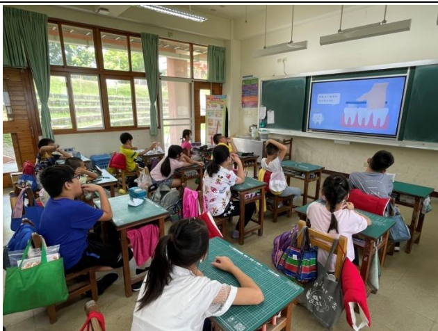
各班進行口腔保健教學