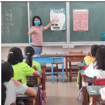
各班進行口腔保健宣導