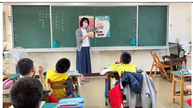
護理師入班進行口腔保健宣導