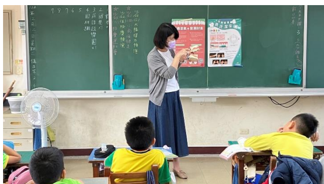
護理師入班進行刷牙示範