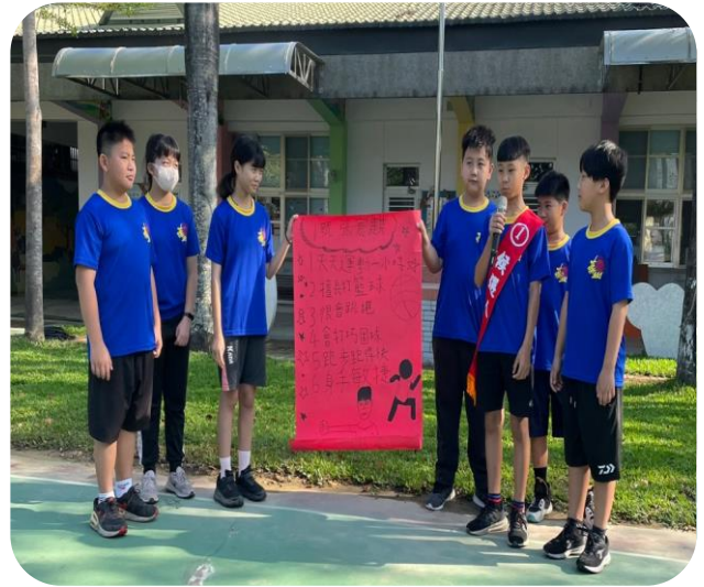
1 號候選人政見發表