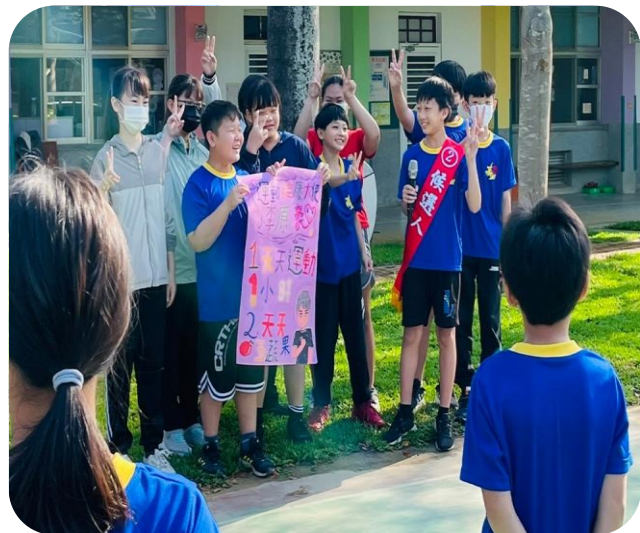
2 號候選人政見發表