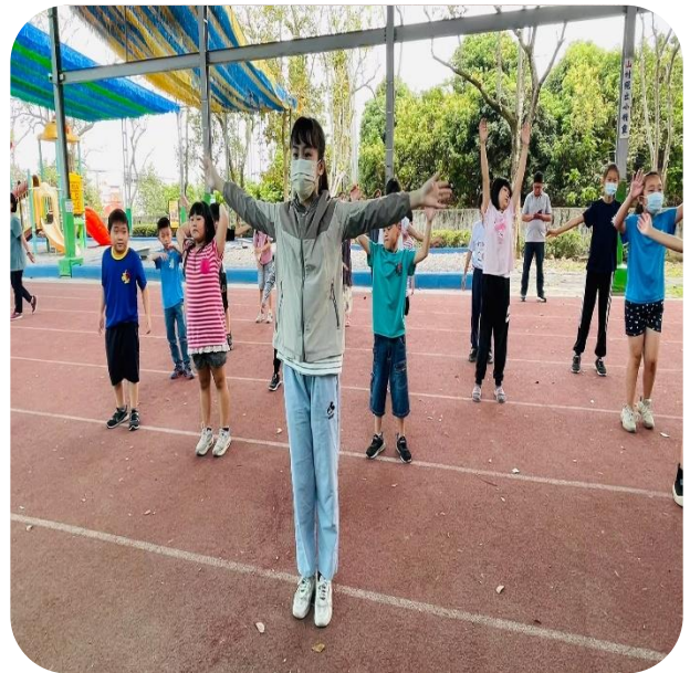
帶領本校師生跳台南市創意健康操、我的餐盤操