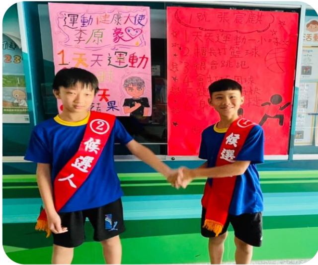
2 位候選人友好至敬