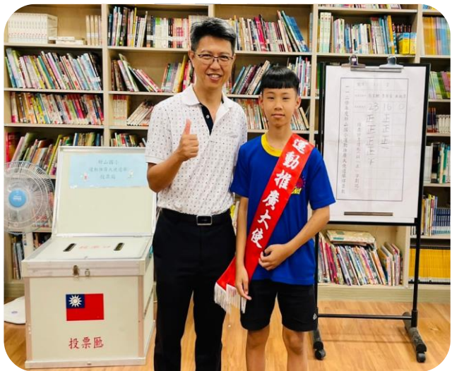
校長頒發當選榮譽肩帶