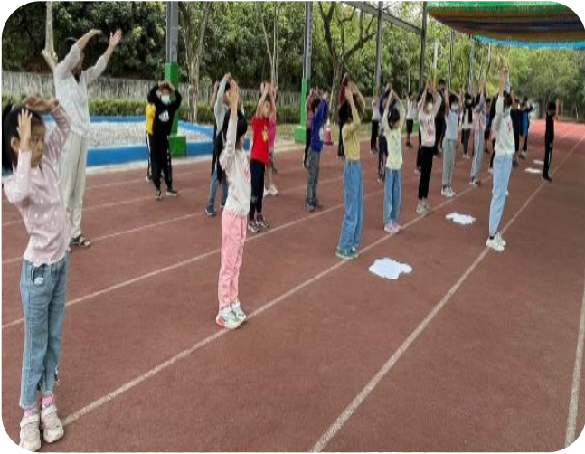
帶領全校師生跳台南市創意健康操、我的餐盤操、運動前暖身操

培訓運動推廣大使協助健康促進相關活動，學習人際溝通、處理問題、倡議 85210 健康生活態度行為，帶領同學享受運動。