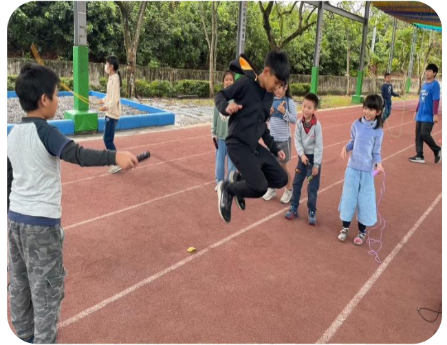
邀約學弟妹、同學一起玩跳繩