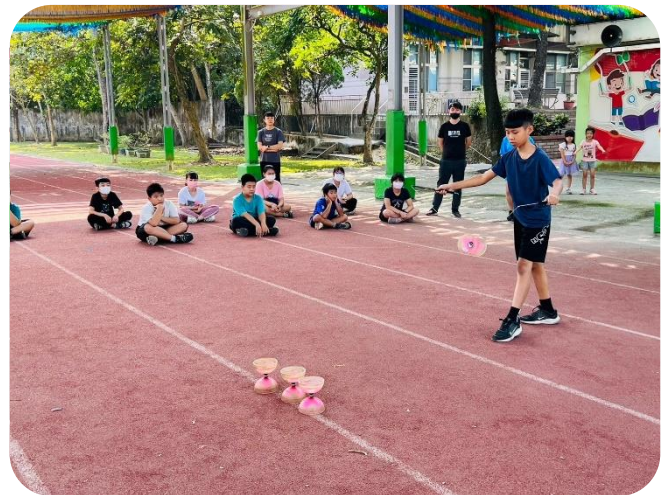
示範扯鈴技巧給中低年級學生學習