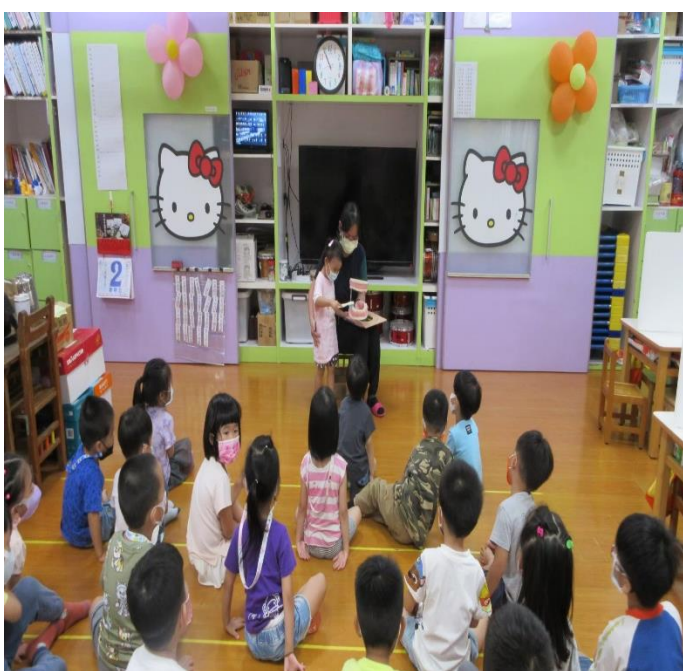
口腔保健—老師指導幼童潔牙