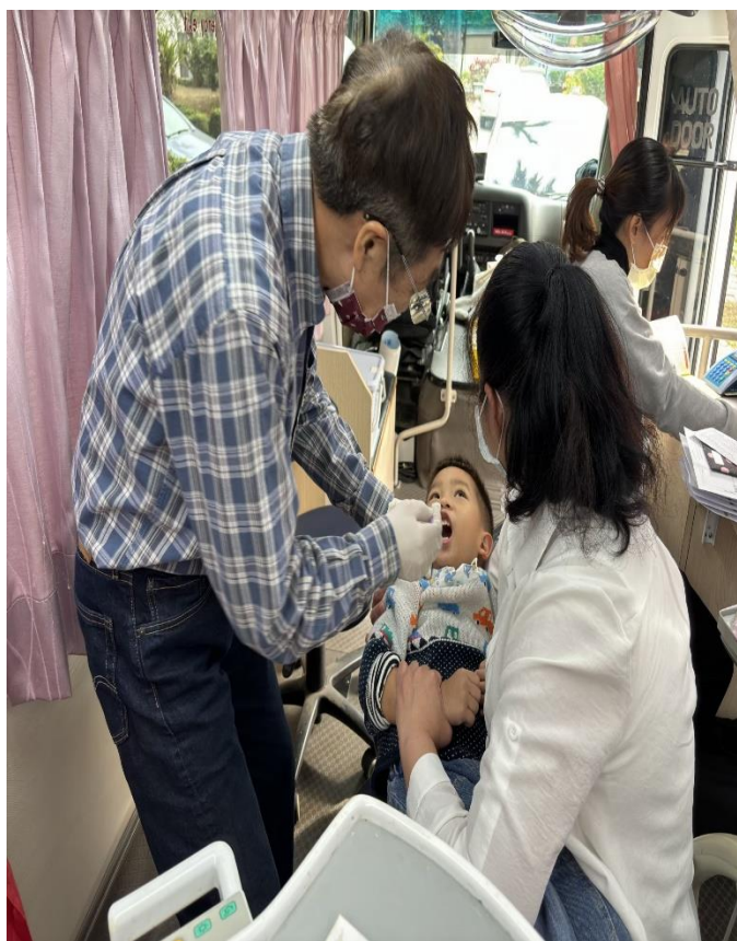
牙醫巡迴醫療服務-幼兒園塗氟每半年巡檢一次