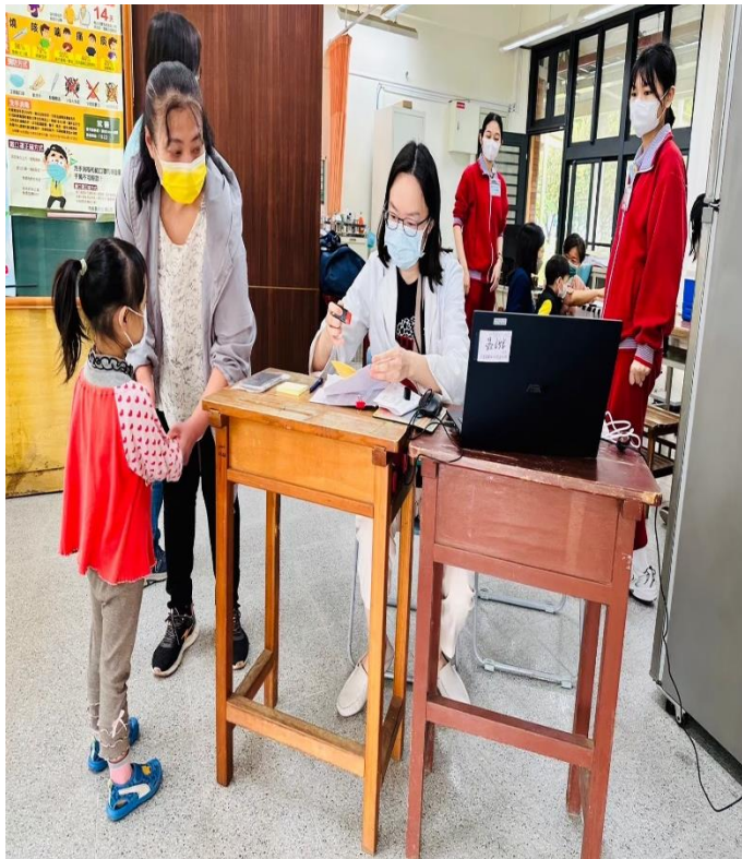
幼兒園--新冠 XBB. 1.5 疫苗接種