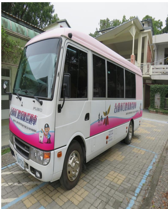
牙醫巡迴醫療服務-幼兒園塗氟於服務車上執行