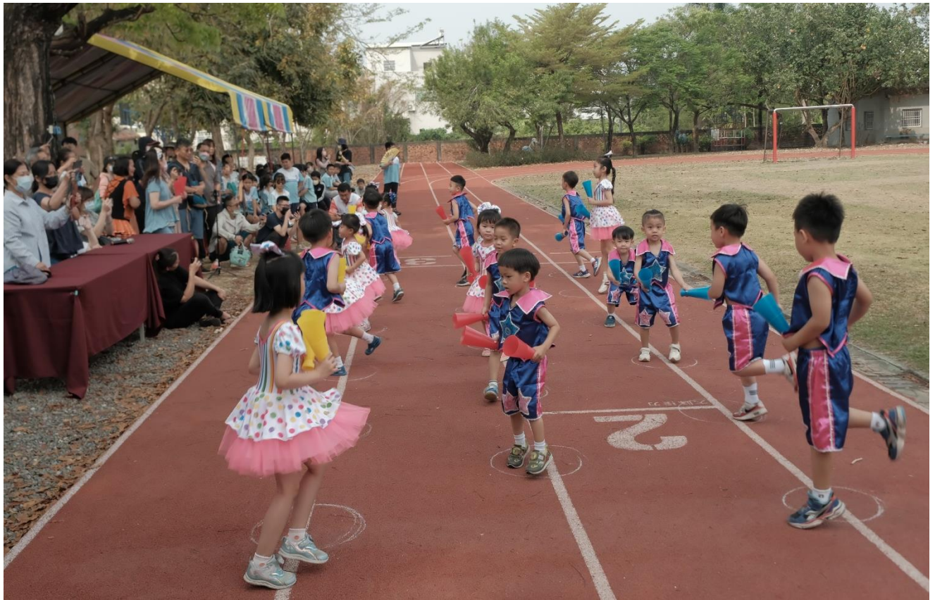
運動會~幼稚班 60 公尺賽跑