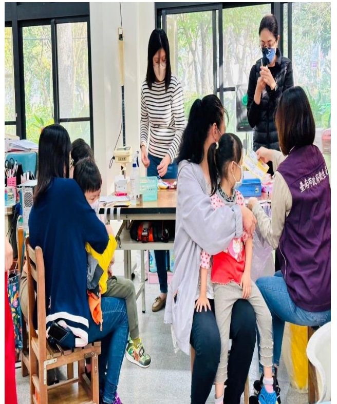
幼兒園--新冠 XBB. 1.5 疫苗接種