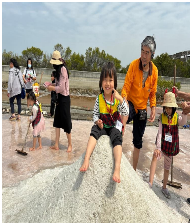
戶外教育—七股鹽山