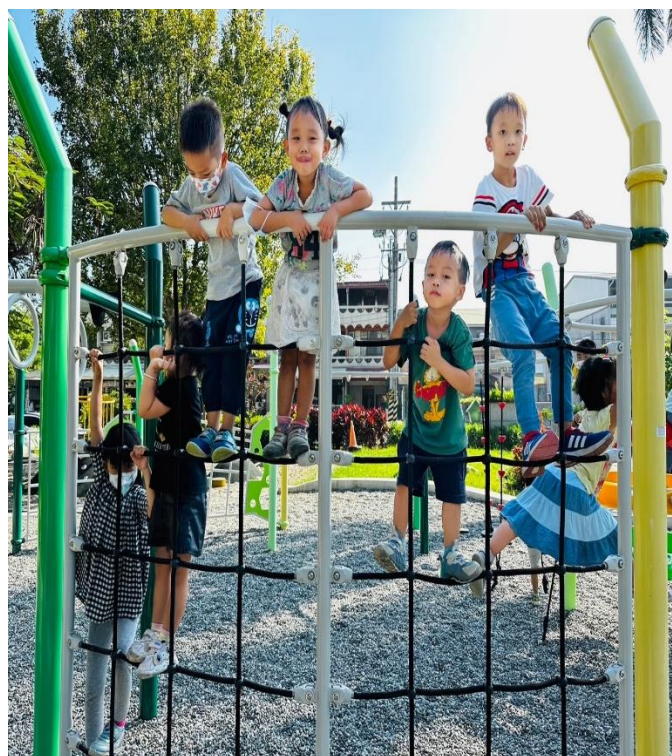
戶外遊戲器材—增加幼童身體活動