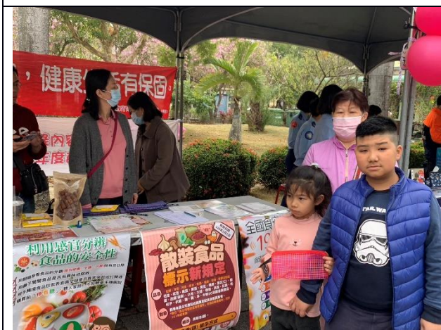
說明：本校學生家長參與