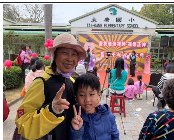
說明：本校學生家長參與