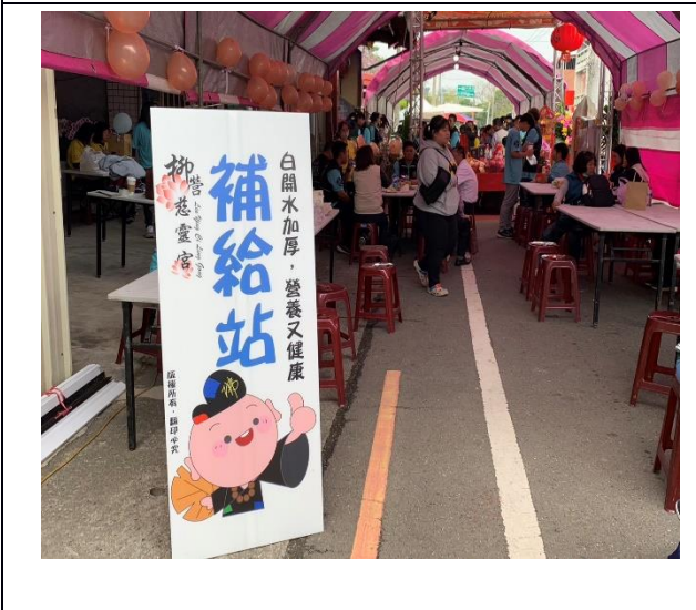
說明：補給站~白開水加厚、營養又健康