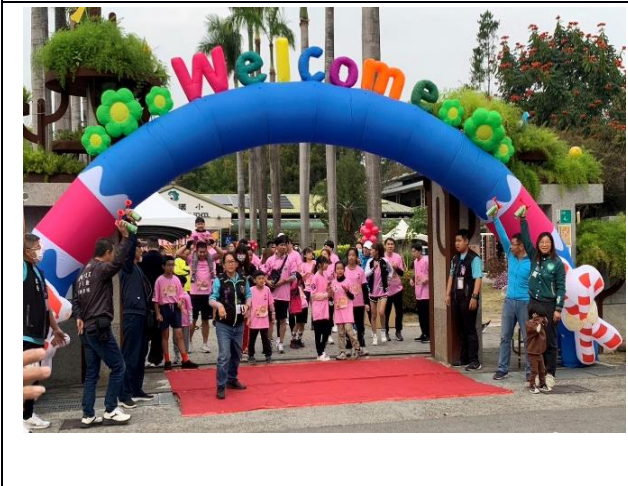
說明：起跑前聚集~~鳴笛