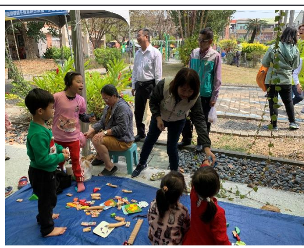
說明：市長夫人與會幼兒園學生互動