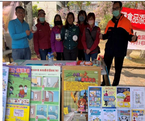
說明：園遊會~消防安全宣導