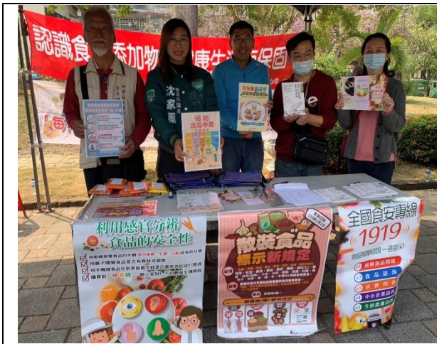
說明：園遊會~食安宣導