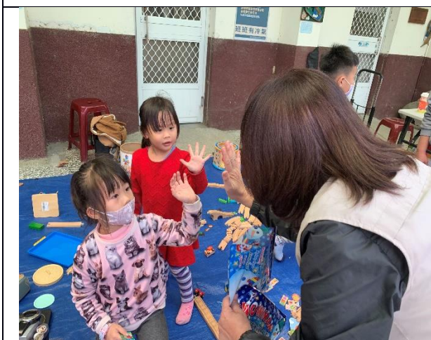
說明：市長夫人與會幼兒園學生互動