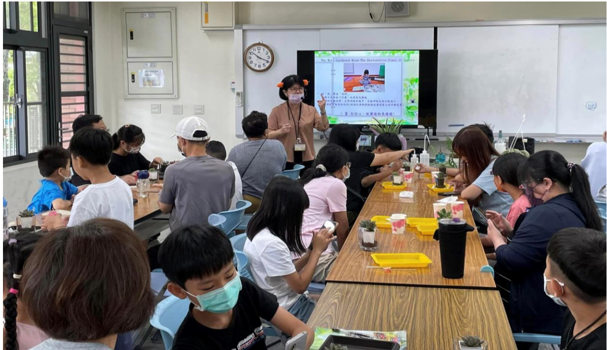
說明：講師轉述課程內容