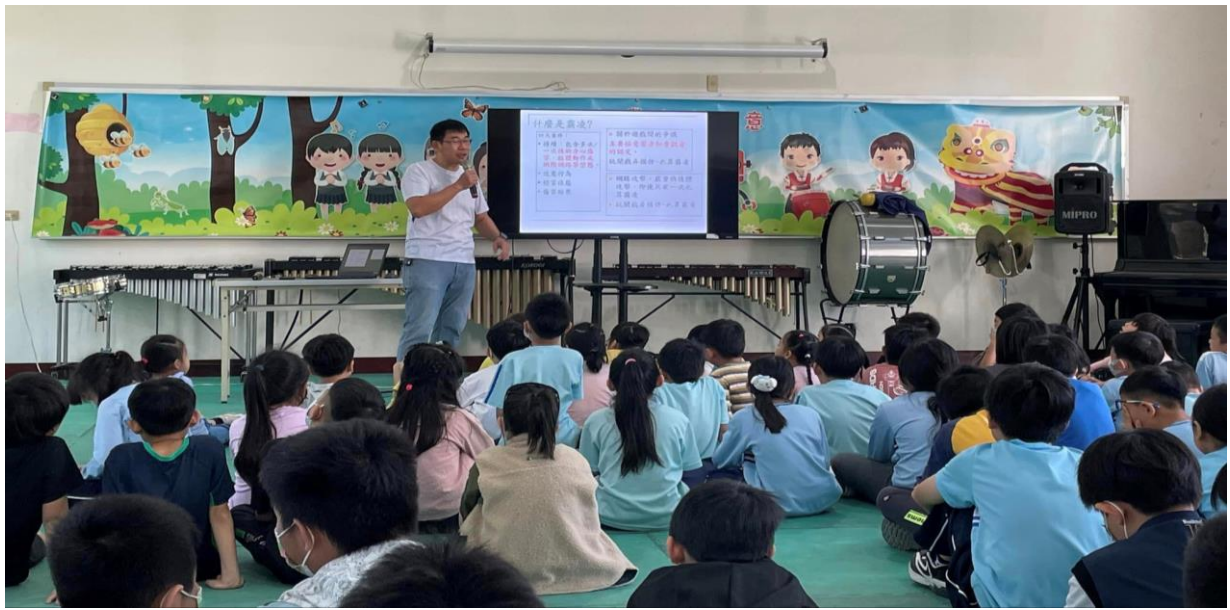
說明:校長友善校園宣導-介紹什麼是霸凌?