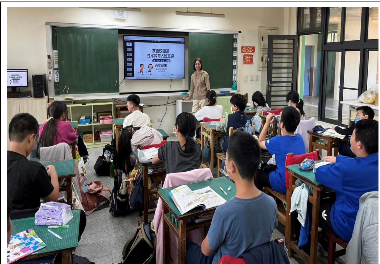
說明：友善校園宣導—性別平等教育