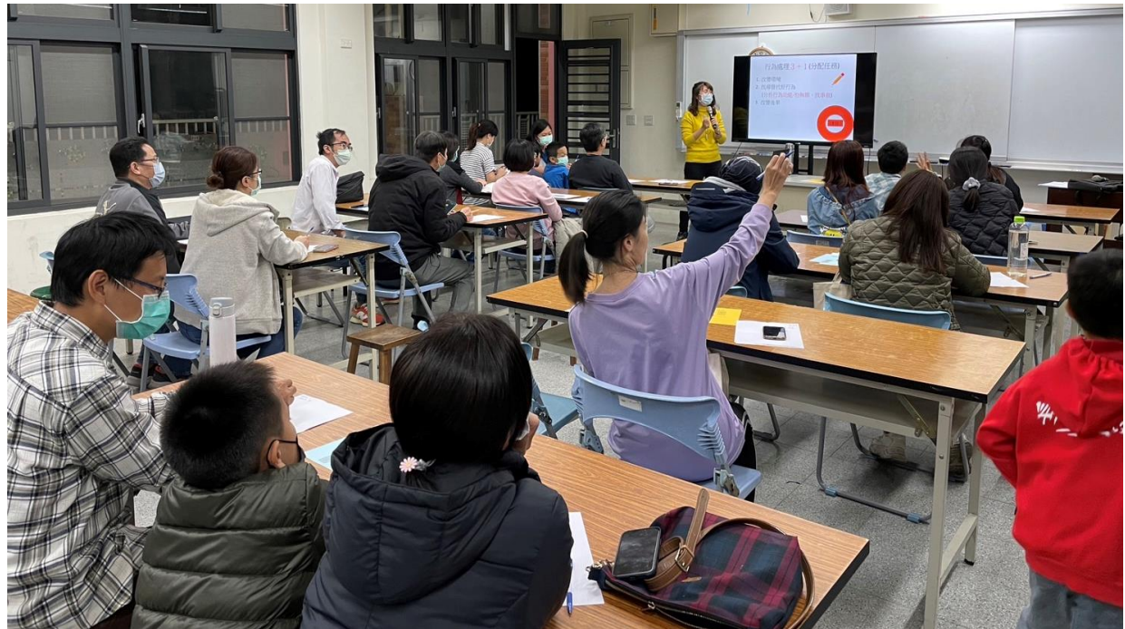
說明：心理師轉述課程內容