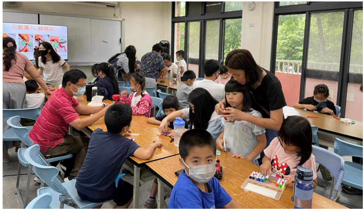
說明：親子DIY活動~~幸福蝴蝶結