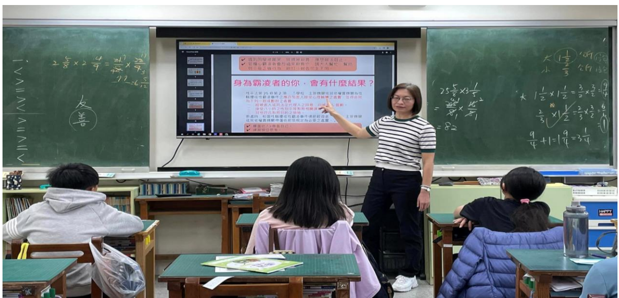
說明:友善校園宣導-霸凌會有什麼結果?