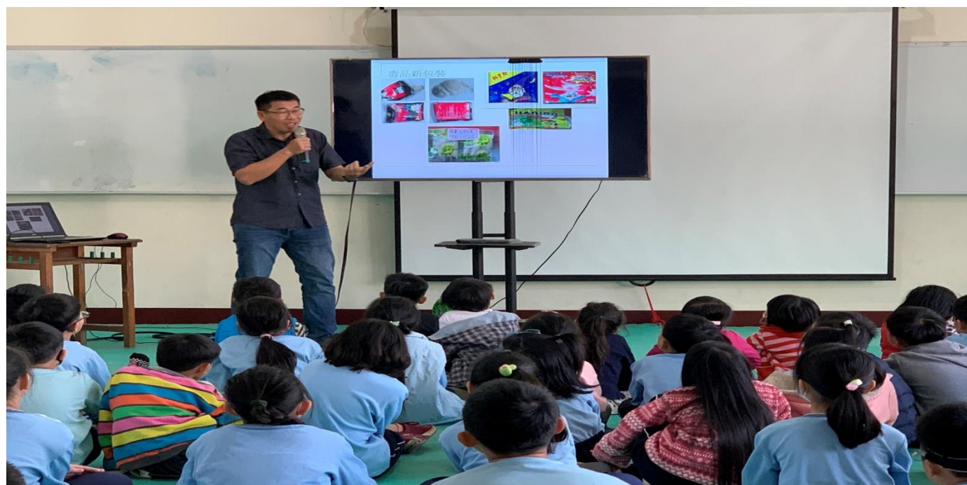
說明：校長—新興毒品包裝宣導