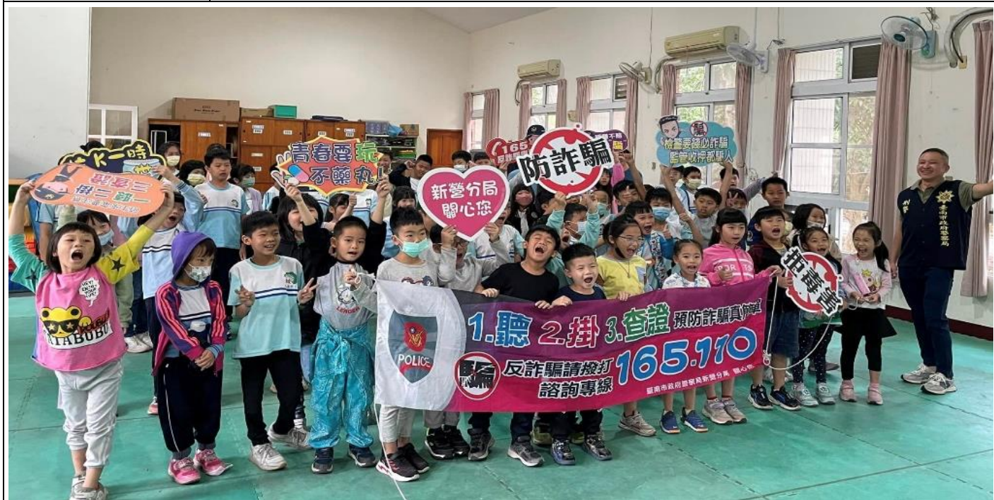
說明：臺南市政府警察局(刑警)—反毒及反詐騙宣導