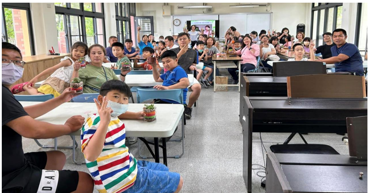
說明：講師和參與家長、學生合影