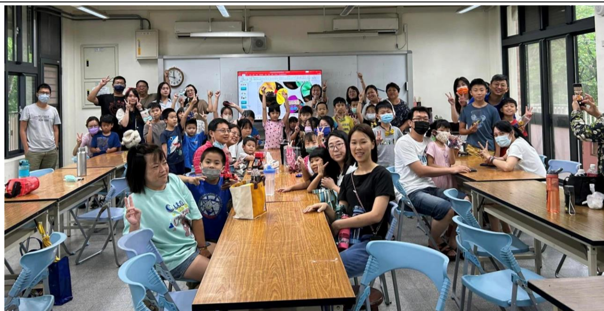
說明：講師和參與家長、學生合影