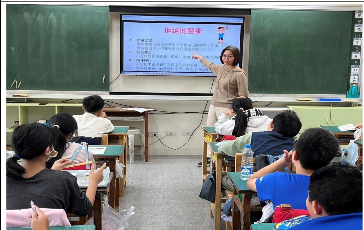
說明：友善校園宣導—兩性關係(拒絕的藝術)