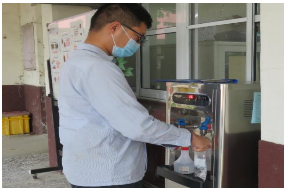
說明：飲用水定期採樣檢驗