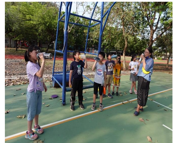
說明：師生運動後補充~~白開水