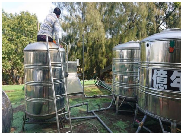
說明：每學期水塔清洗