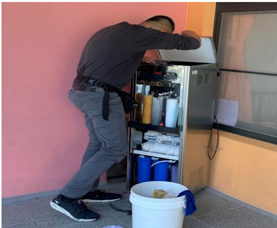
說明：飲水機更換濾心