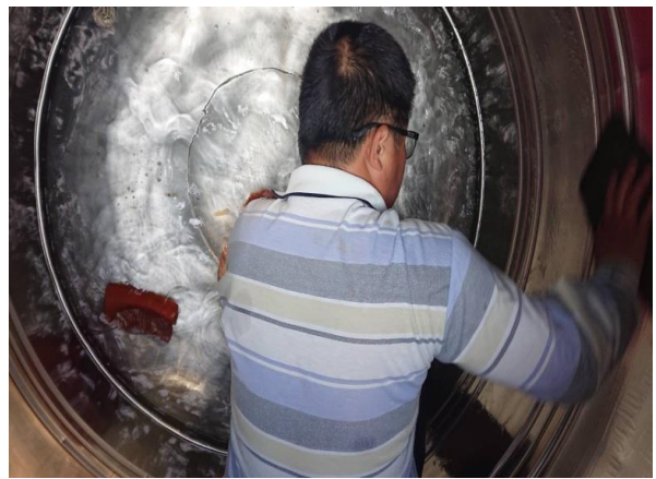
說明：每學期水塔清洗