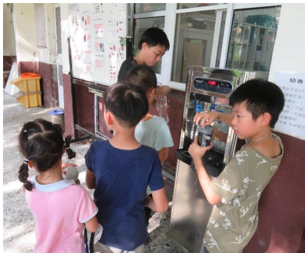
說明：學童補滿水壺水