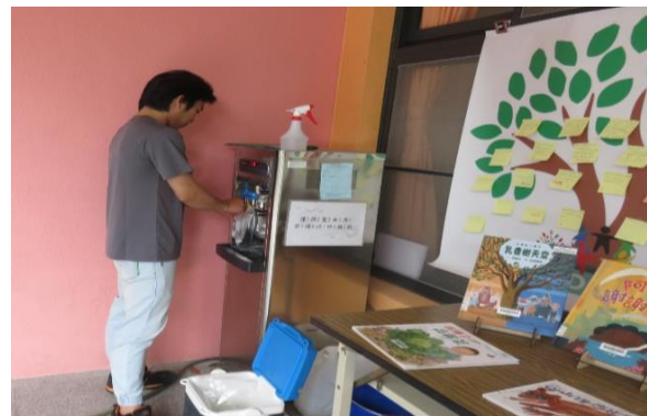
說明：飲用水定期採樣檢驗