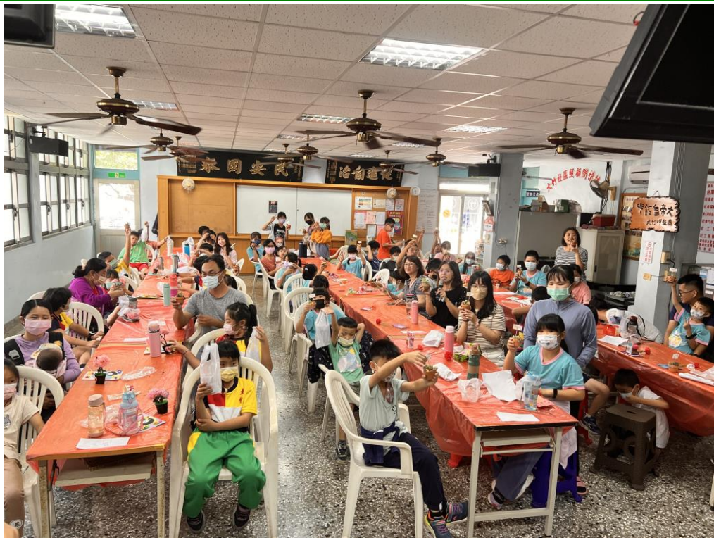
照片說明：活動圓滿結束。