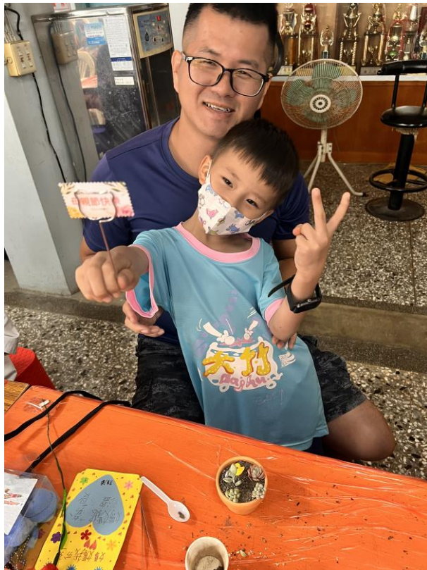
照片說明：爸爸與我一起DIY