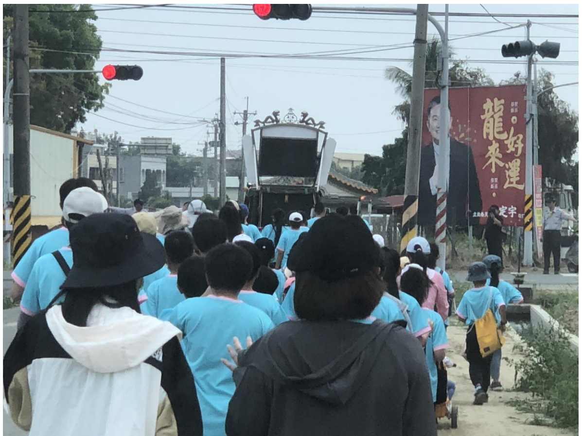
照片說明：大竹社區健走-為大家的健康把關。