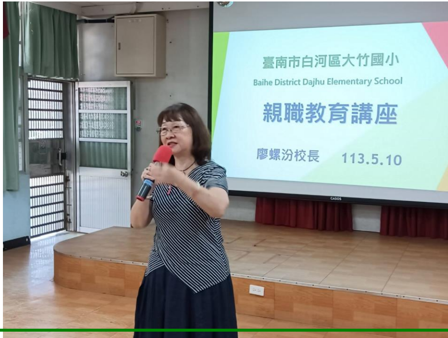
照片說明：親職講座