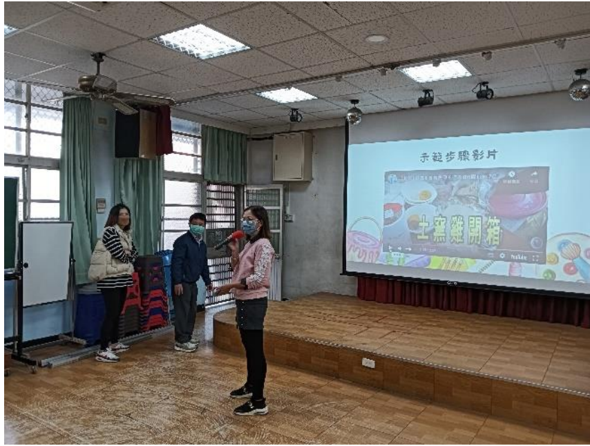
照片說明：控窯前教育課程