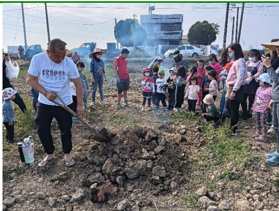
照片說明：控窯親子同樂