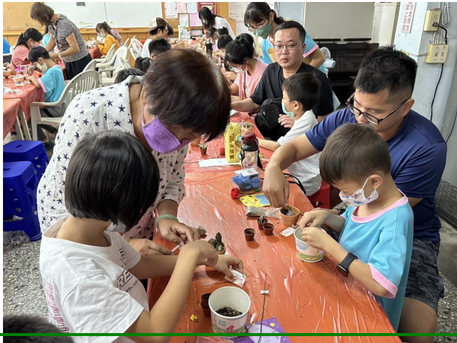
照片說明：全家一起完成最棒的作品