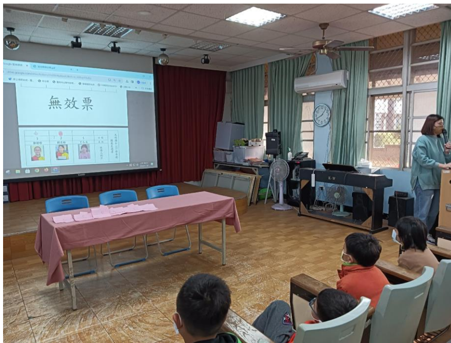
照片說明：解說投票流程。