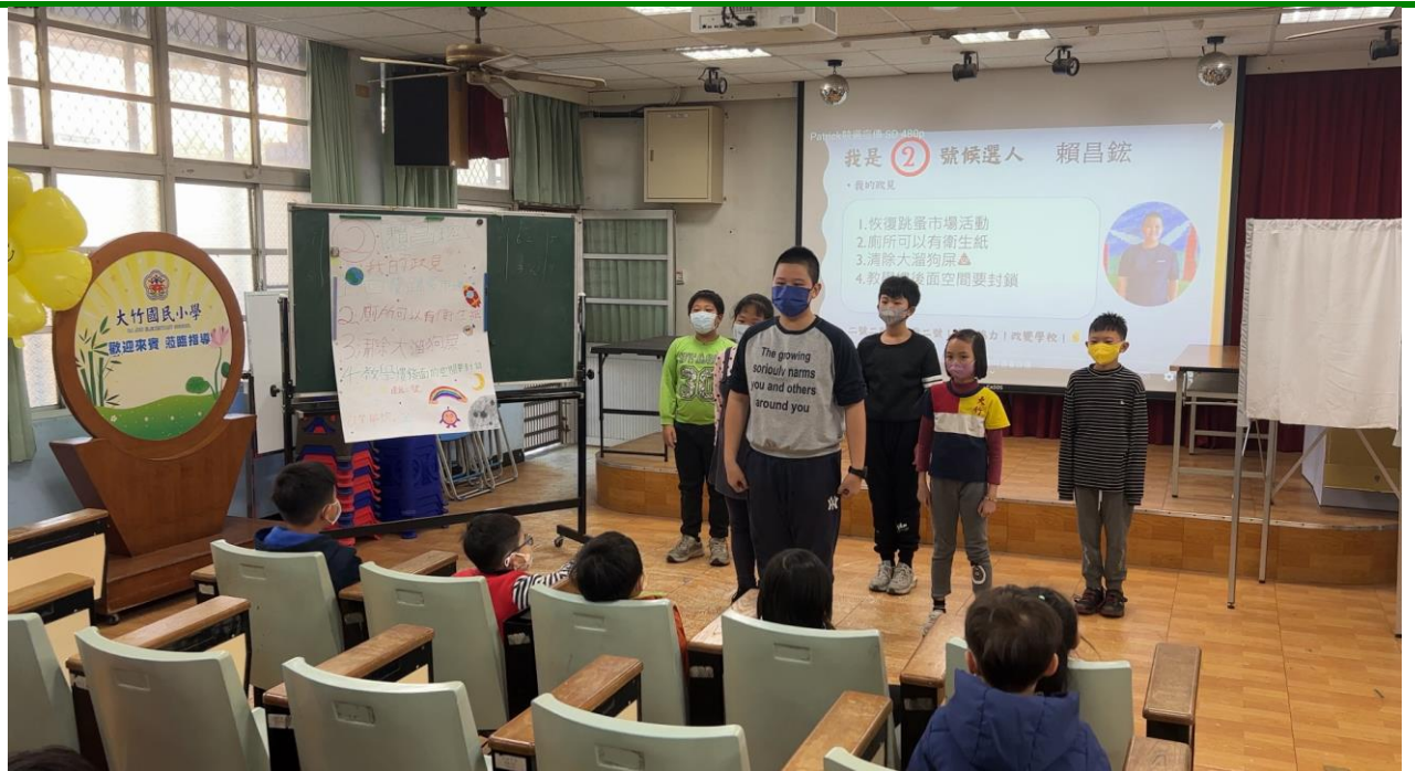
照片說明：小候選人政見發表(五年級)。