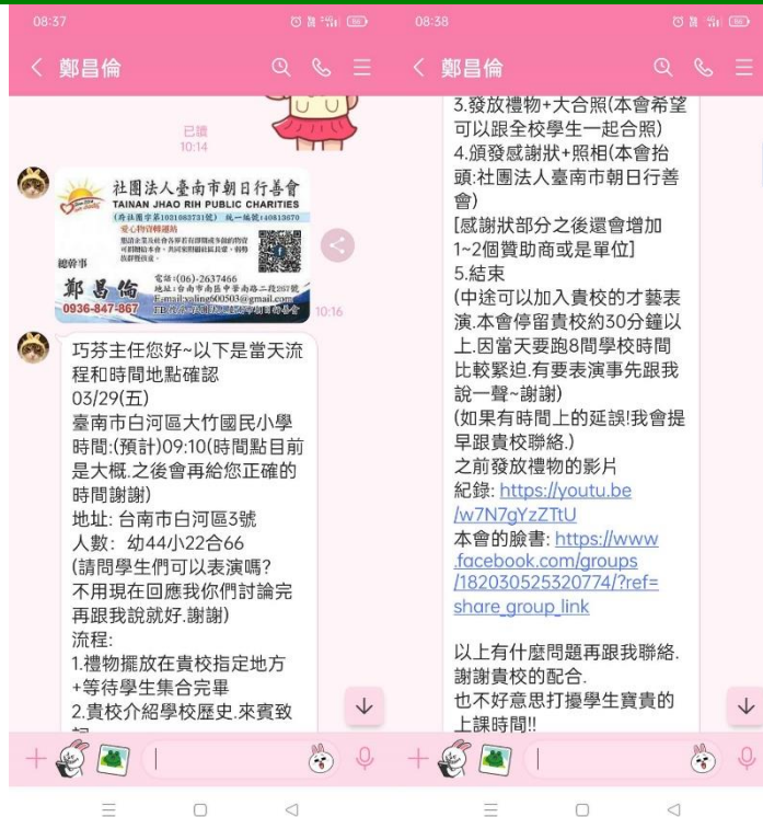
照片說明：申請朝日行善會兒童節禮物。