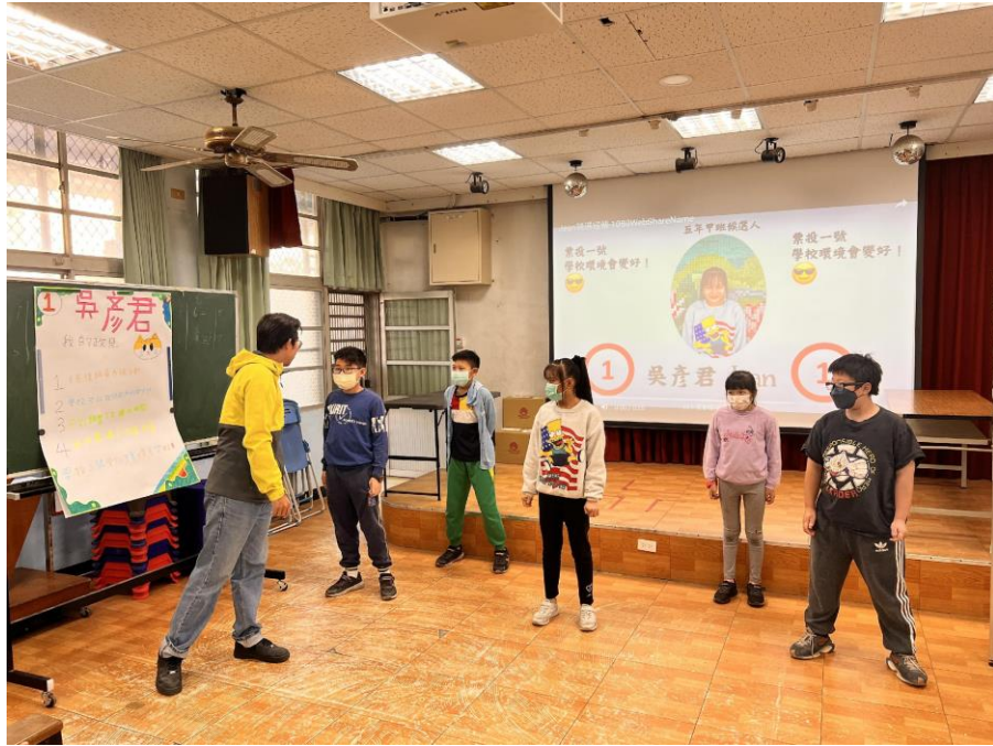
照片說明：小候選人政見發表(五年級)。