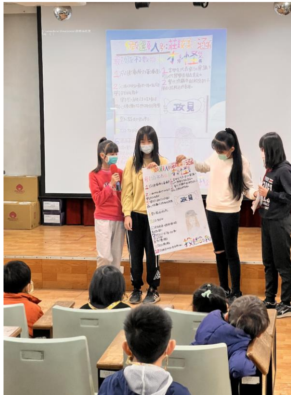
照片說明：小候選人政見發表(六年級)。