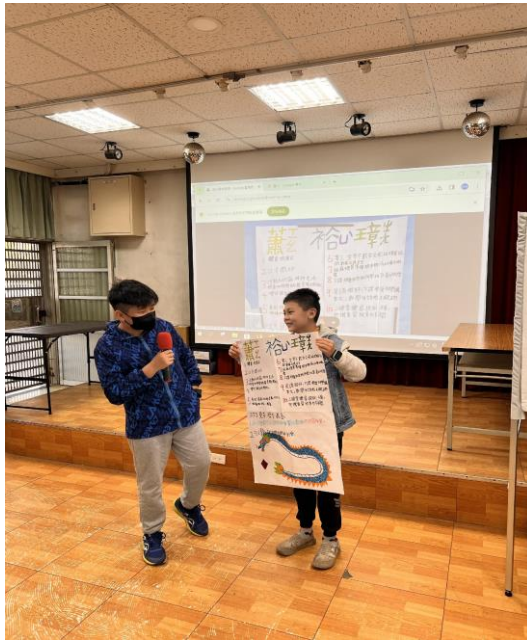
照片說明：小候選人政見發表(六年級)。