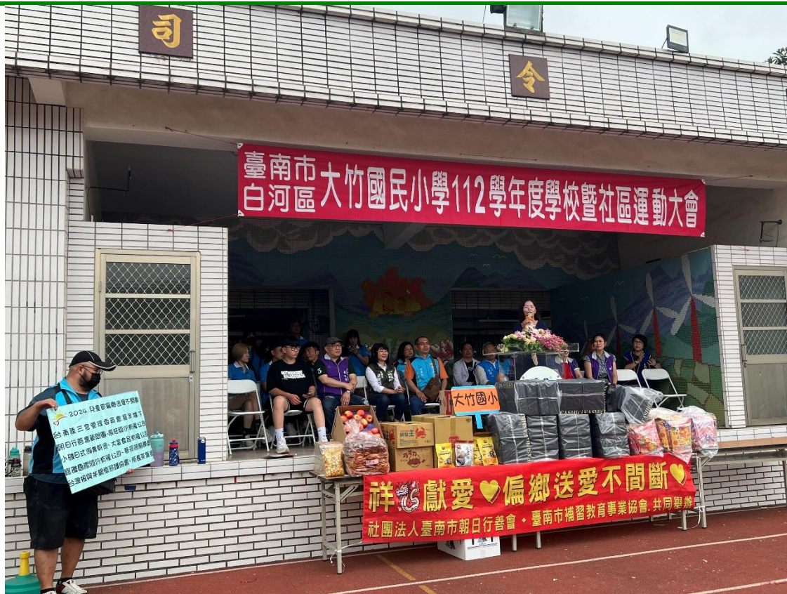
照片說明：偏鄉送愛不間斷。