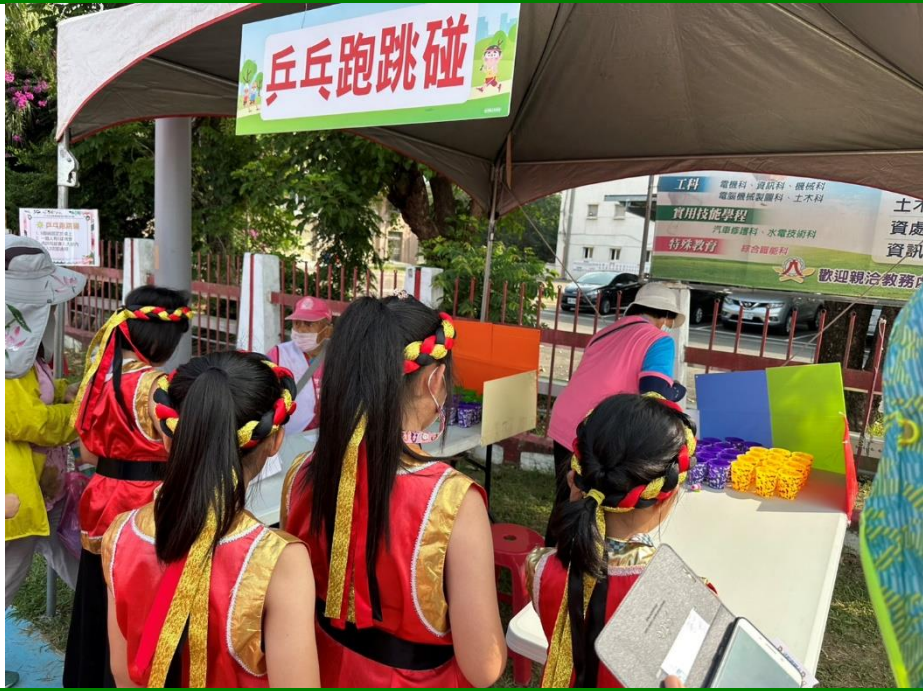
照片說明：參與白河區公所青銀樂活闖關體驗活動