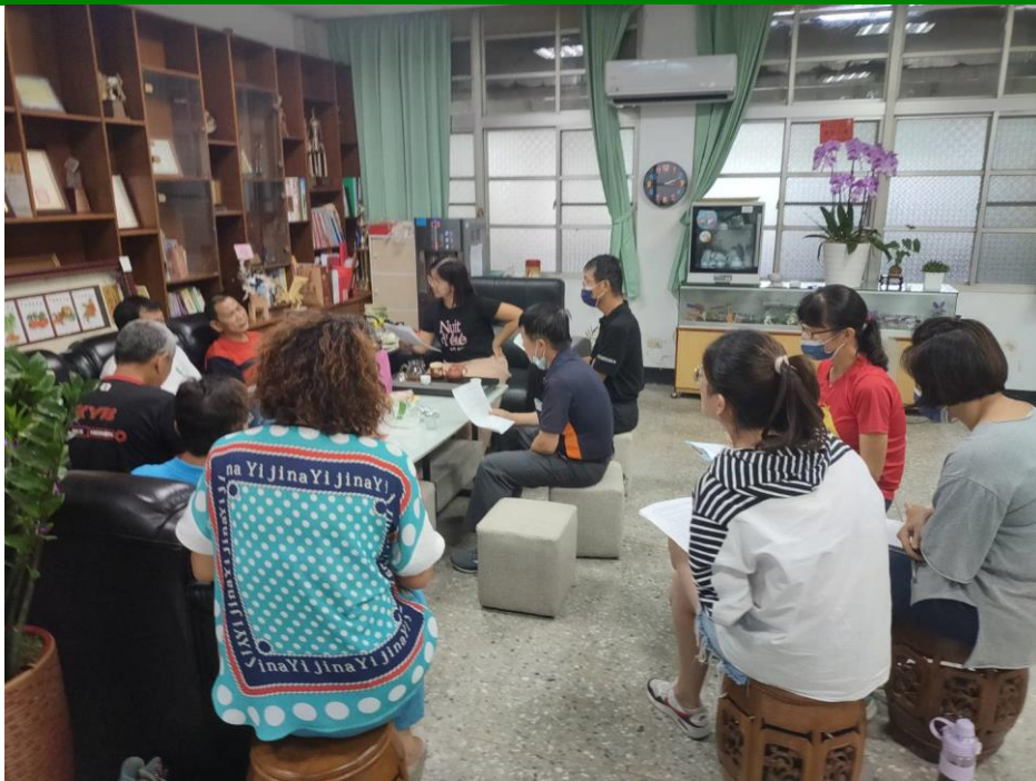
照片說明：會議中順道宣傳與討論健康促進推動內容