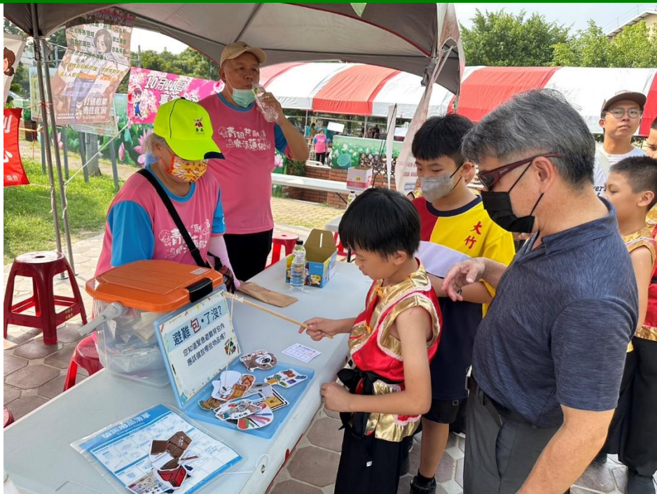
照片說明：學生能對於安全教育初步認識，學會保護自我