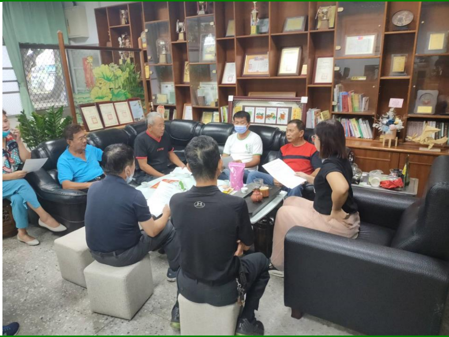
照片說明：邀請社區重要人士一起召開 60 周年籌備會議