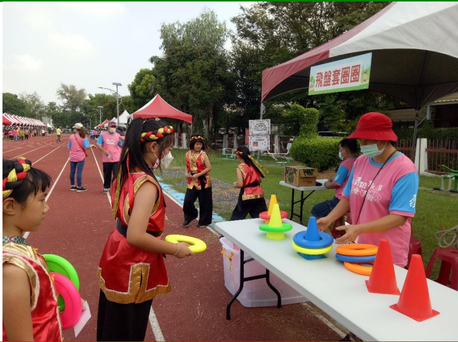
照片說明：玩玩飛盤，健康體適能體驗活動