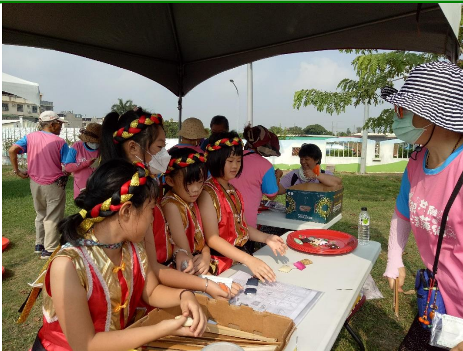
照片說明：嘗試丟沙包手腳並用體驗活動，踴躍參與社區辦理的活動。