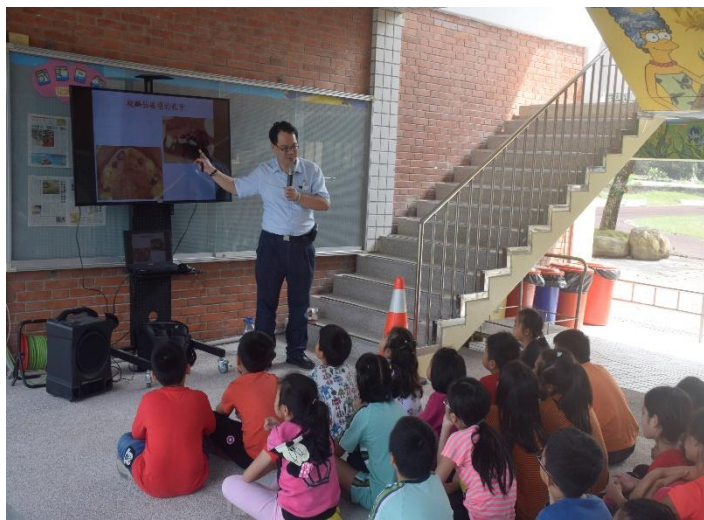
說明：牙醫師衛教全校師生口腔保健知識