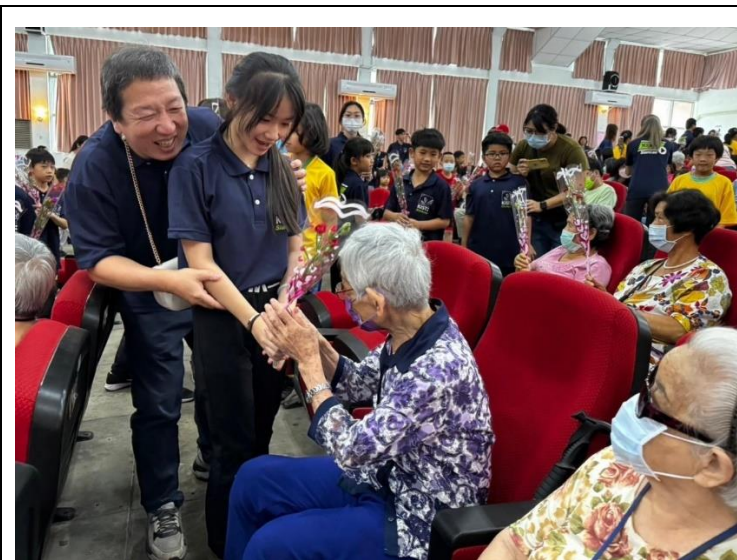
說明：由本分校學生向長者們向上康乃馨花，祝福母親節快樂。