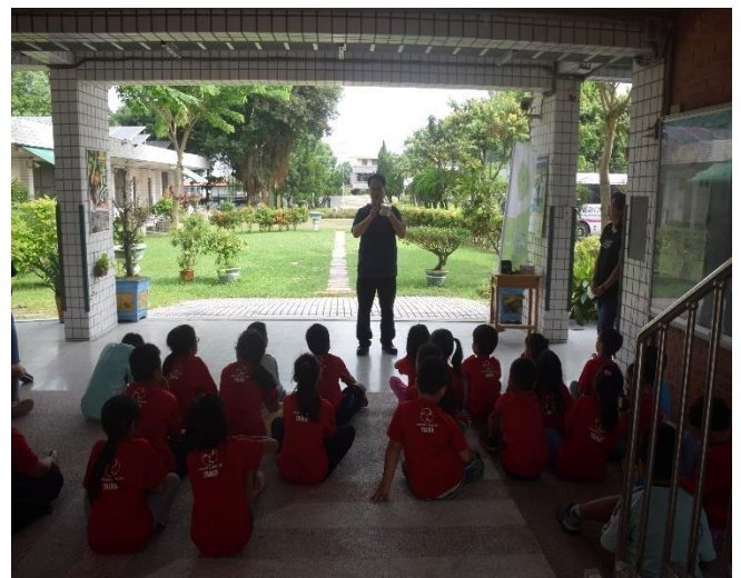
說明：潔牙觀念從小培養，牙醫師指導全校學生潔牙技巧。