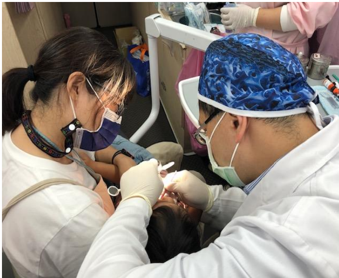
說明：由幼兒園老師協助初次受檢學童完成牙齒塗氟保健服務。