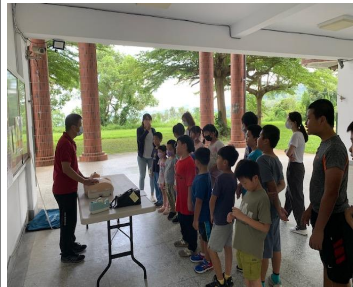
說明：消防隊員教導師生如何操作 CPR。