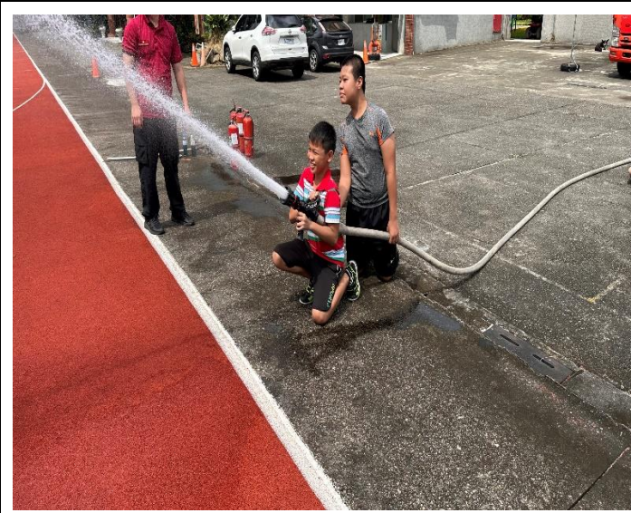
說明：消防隊員讓高年級學生親自體驗消防車的噴水設備。