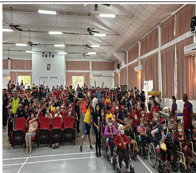
說明：本分校學生、家長及長者們歡聚一堂。