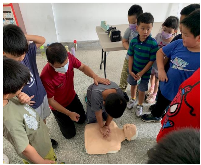
說明：學生親自操作心外按摩技術，消防員在旁指導學生動作。