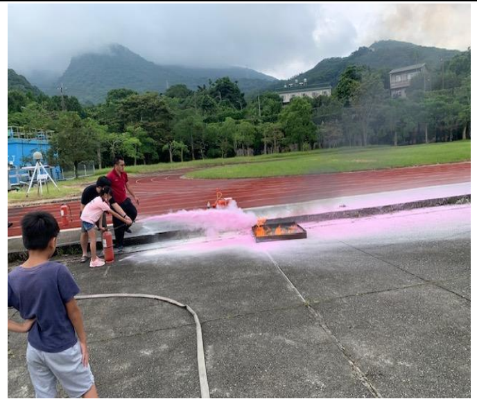
說明：學生們親自來操作如何使用乾粉滅火器滅火。