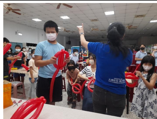
說明：洪主任教導學生用氣球來製作禁菸標誌，學生興趣盎然。