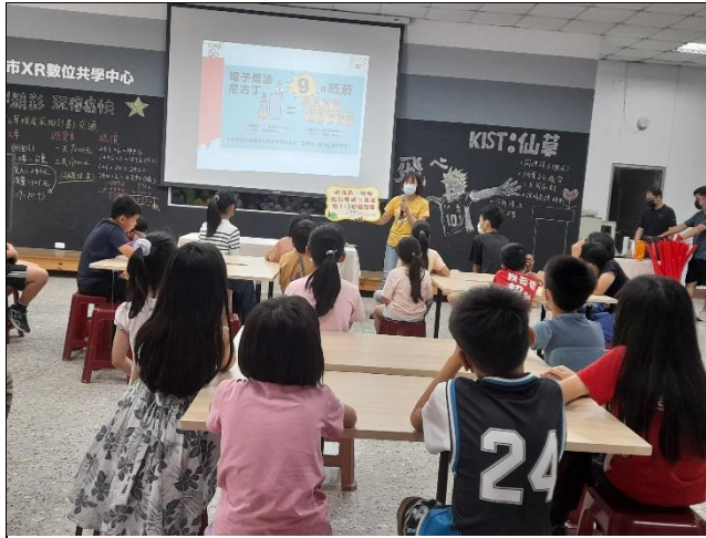
說明：講師說明販售菸品給兒少童或青年是違法的，要處以罰則