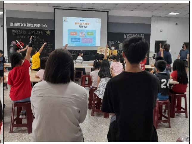
說明：現場除了宣講也進行問答活動，講師和學生互動熱絡。