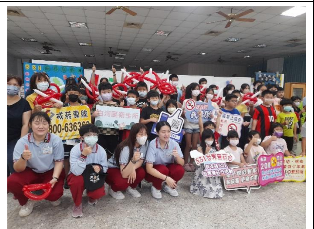
說明：學生拿著氣球製作的禁菸標誌作品，開心的和衛生所人員合照。