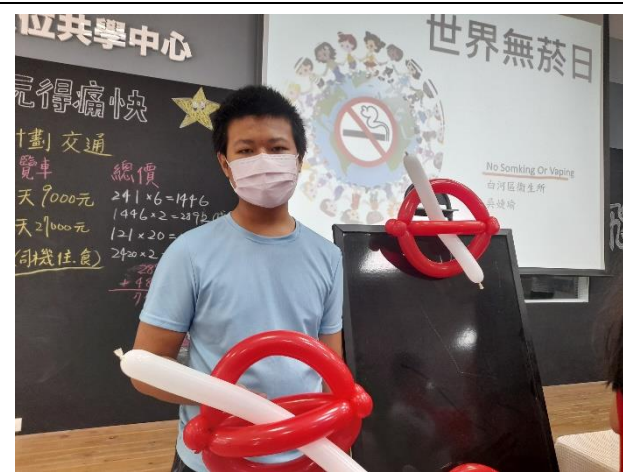
說明：學生用氣球製作有趣的禁菸標誌作品。