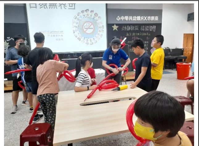
說明：洪主任教導學生用氣球來製作禁菸標誌，學生興趣盎然。