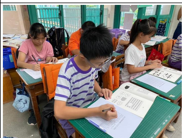
說明：問卷施測情形