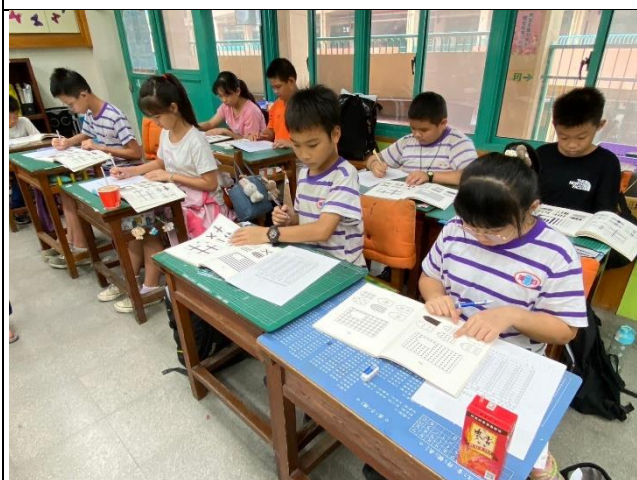
說明：問卷施測情形