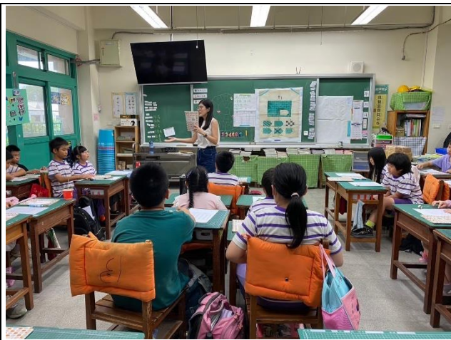
說明：問卷施測前說明