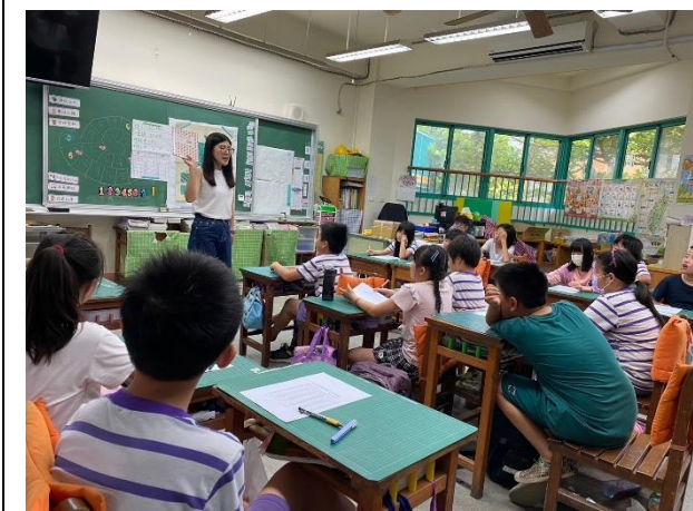
說明：問卷施測前說明