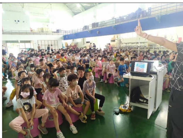
說明：教師總結檳榔的危害課程