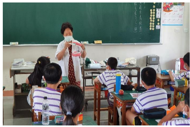
說明：牙醫師總結正確潔牙的方式