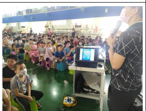
說明：教師利用學生朝會進行檳榔防治宣導