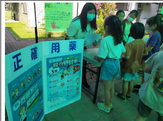
說明：配合兒童節闖關活動學習正確用藥