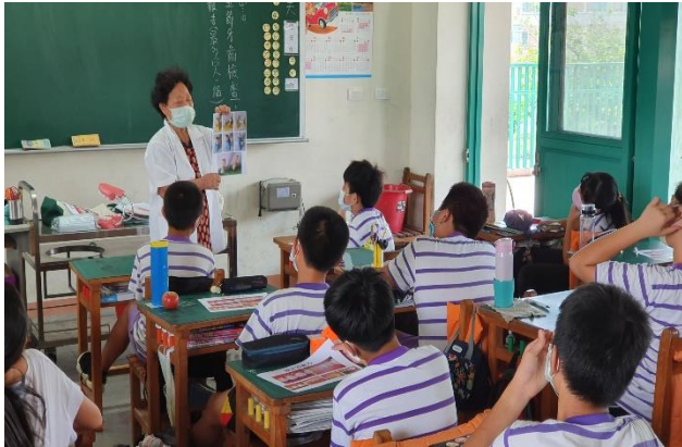
說明：牙醫師講解未正確潔牙所造成的後果