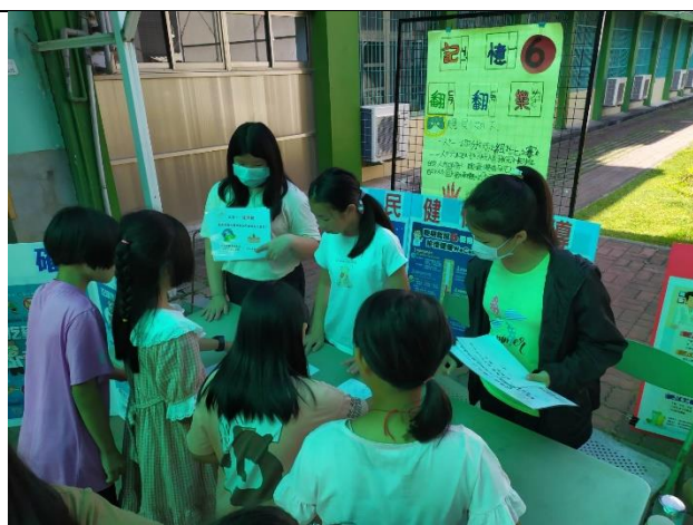
說明：配合兒童節闖關活動學習正確用藥