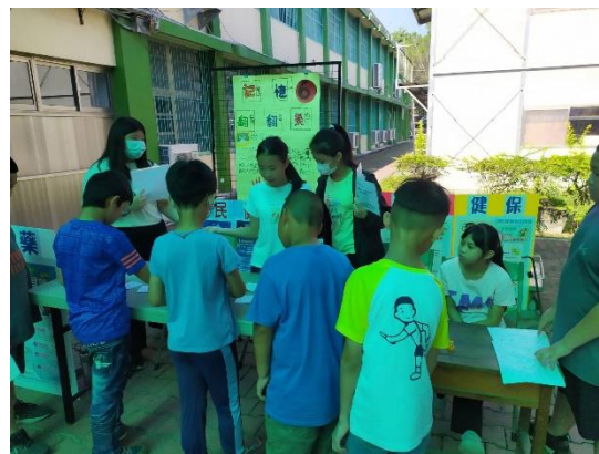
說明：配合兒童節闖關活動學習正確用藥