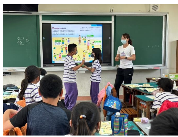
說明：各小組分享及討論檳榔的危害