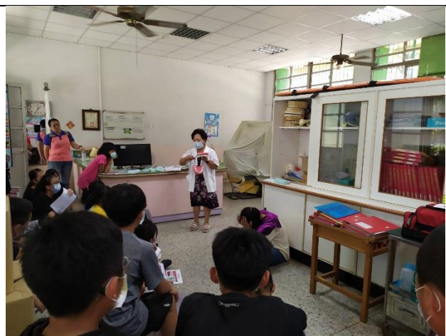
說明：牙醫師進行正確潔牙講座