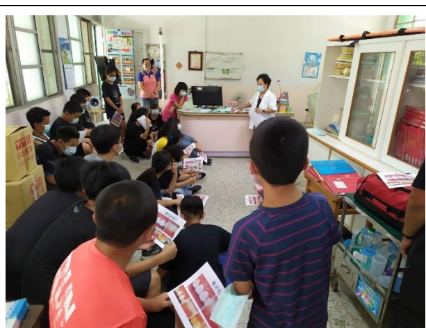
說明：牙醫師進行正確潔牙講座