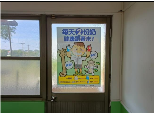
說明：健康飲食海報-每天2份奶·健康跟著來