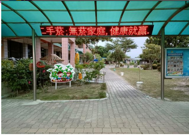
說明：學校提供健康資訊-無菸家庭