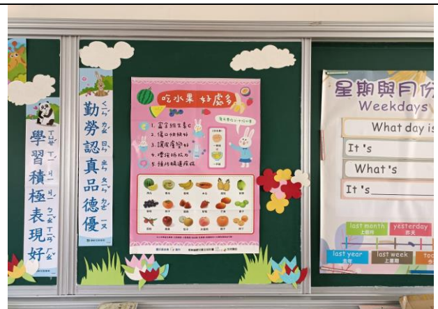
說明：班級公佈欄-健康飲食資訊