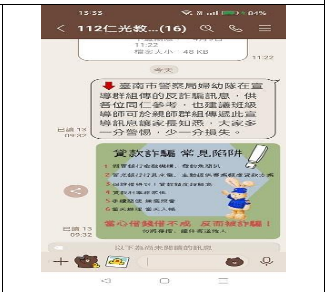
說明：LINE 群組-反詐騙宣導資訊