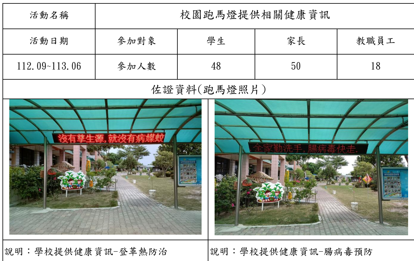
臺南市112學年度仁光國民小學提供健康資訊成果表