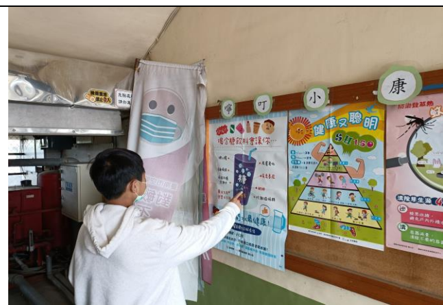
說明：健康小叮嚀-喝水最健康海報