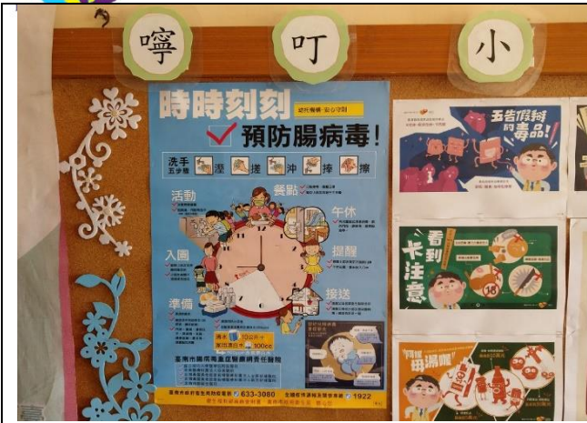
說明：健康小叮嚀-預防腸病毒海報