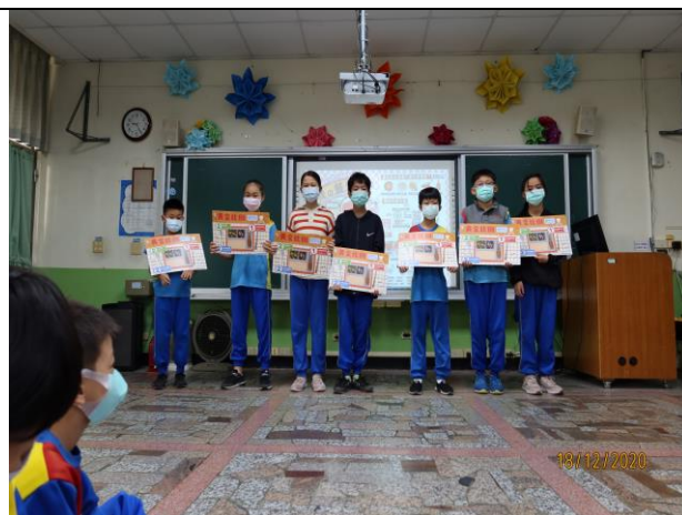
說明：健康飲食桌墊