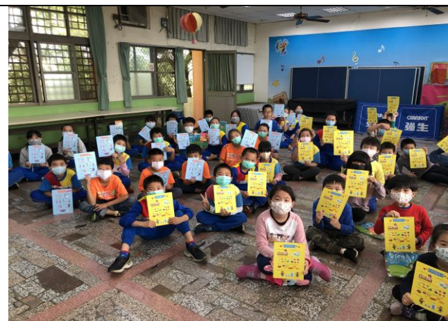
說明：健康吃快樂動墊板