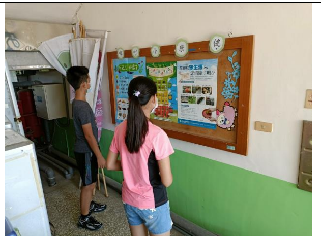
說明：健康小叮嚀-登革熱防治海報