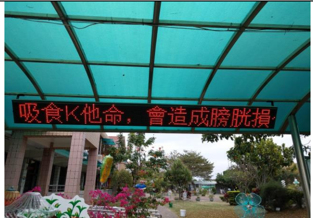
說明：學校提供健康資訊-拒毒反毒