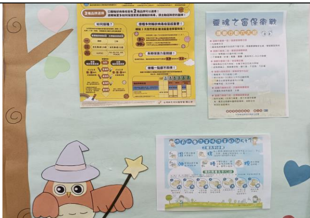
說明：班級公佈欄-視力保健衛教資訊