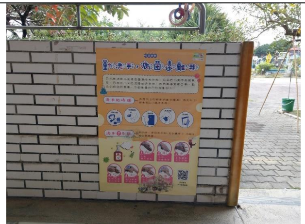
說明：防疫知能海報-正確勤洗手