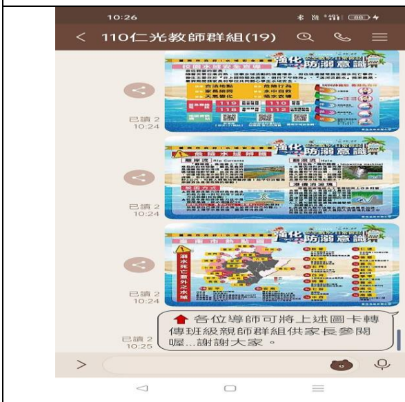
說明：LINE 群組-水域安全宣導資訊