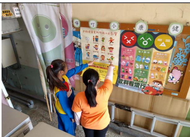
說明：健康小叮嚀-健康校園四不宣言海報