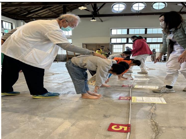
說明：一、四年級學生脊柱四肢檢查