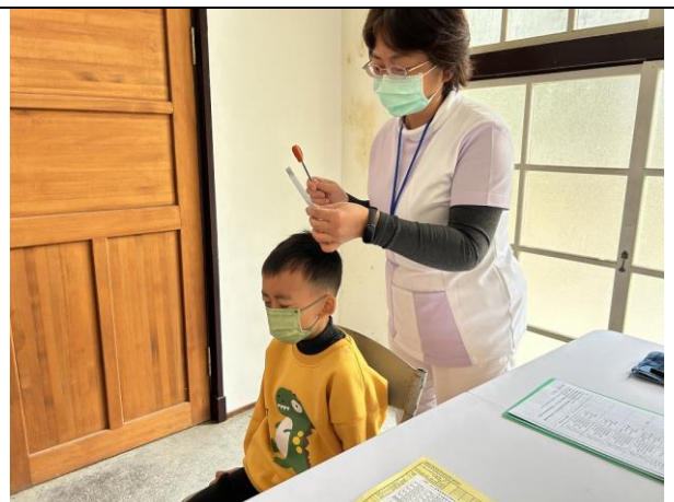
說明：學生聽力測量