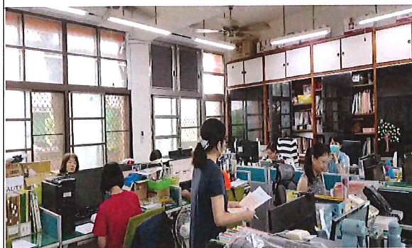
說明：週四教師晨會說明