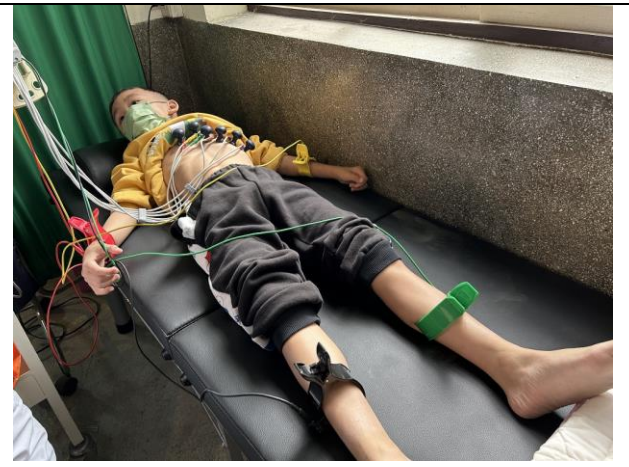
說明：學生心電圖檢查