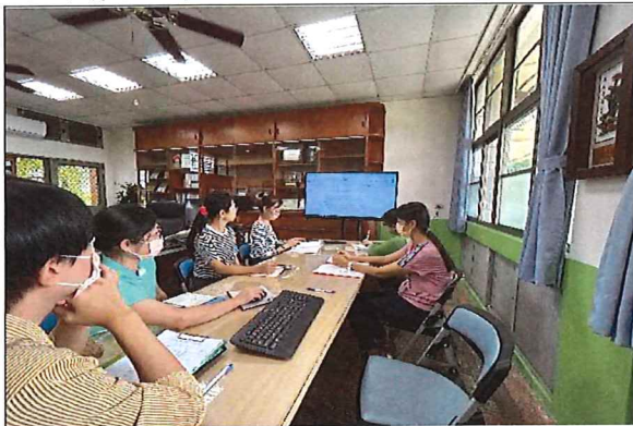
說明：學生健康檢查工作小組會議