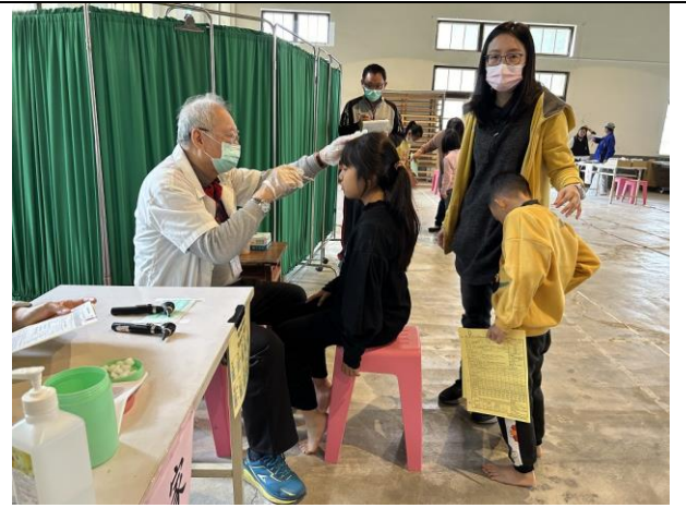
說明：學生構音檢查