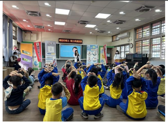
說明：講師與學生互動