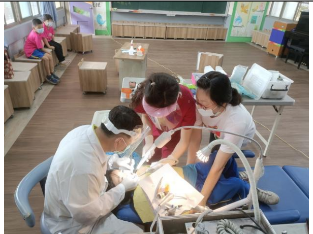
說明：學生白齒窩溝封填(2)