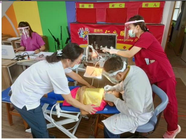
說明：學生白齒窩溝封填(1)