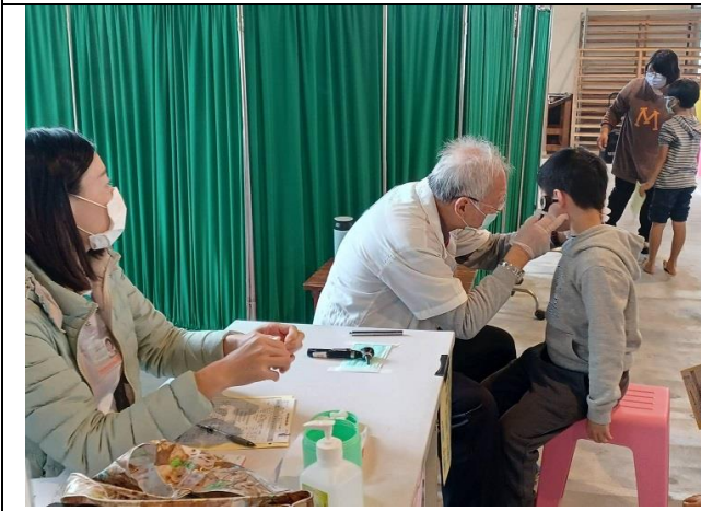
說明：學生頭頸部檢查