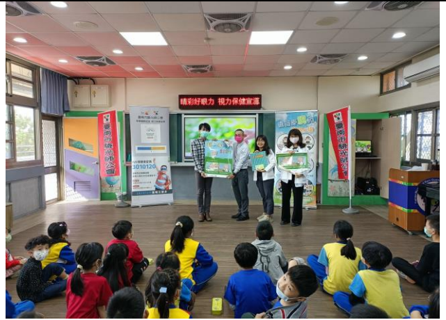
說明：驗光師公會致贈學校海報宣導品