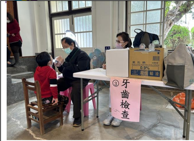
說明：學生牙齒檢查