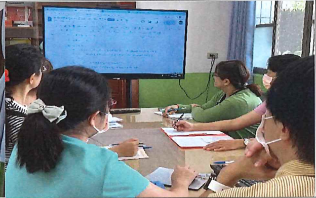
說明：健檢內容準備事項