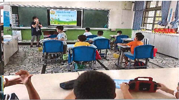
說明：學生健檢說明會