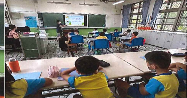
說明：檢查結果通知單複檢說明