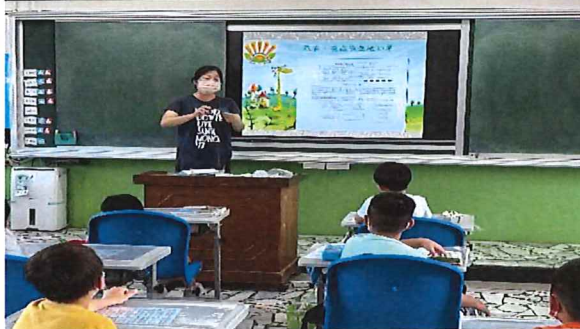
說明：尿液、寄生蟲檢體採集說明