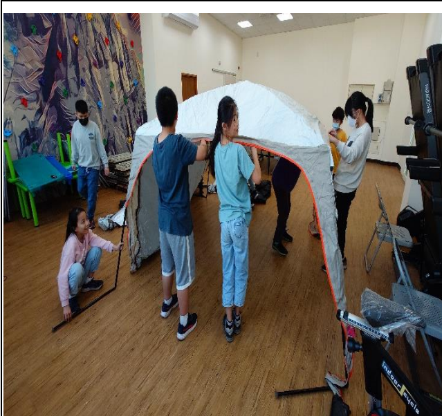
山野教育行前課程-搭帳棚