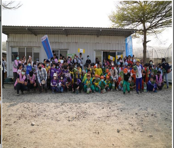
食農教育-「時生永續農場」戶外教學