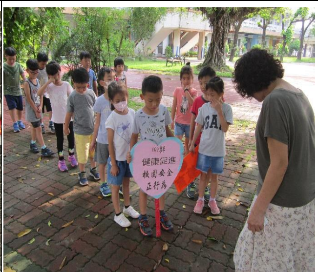
一年級新生「校園安全」宣導