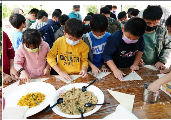
斯里蘭卡文化交流