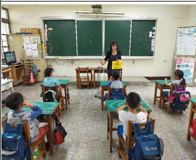
「紫外線滅菌燈」使用方式宣導