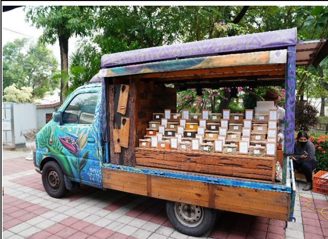
斯里蘭卡文化交流