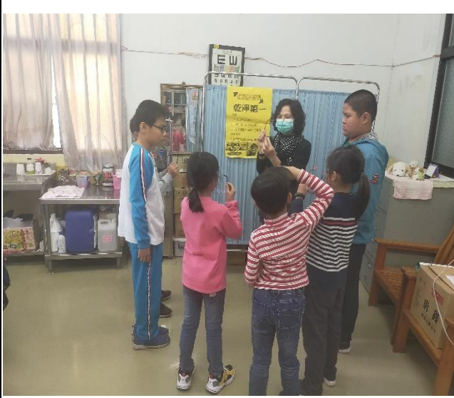
指導學生如何保養及清洗眼鏡