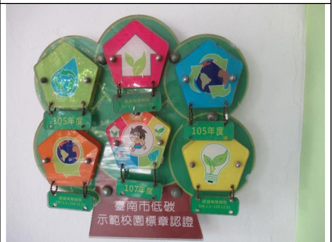
台南市低碳示範學校認證標章