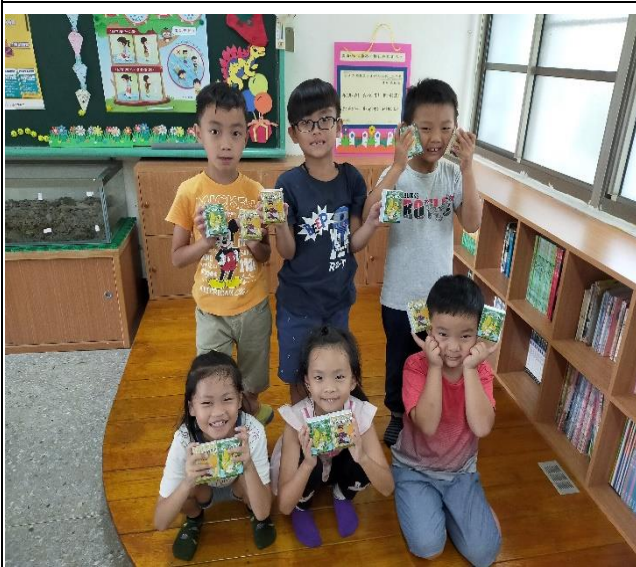
有機葡萄乾捐贈活動