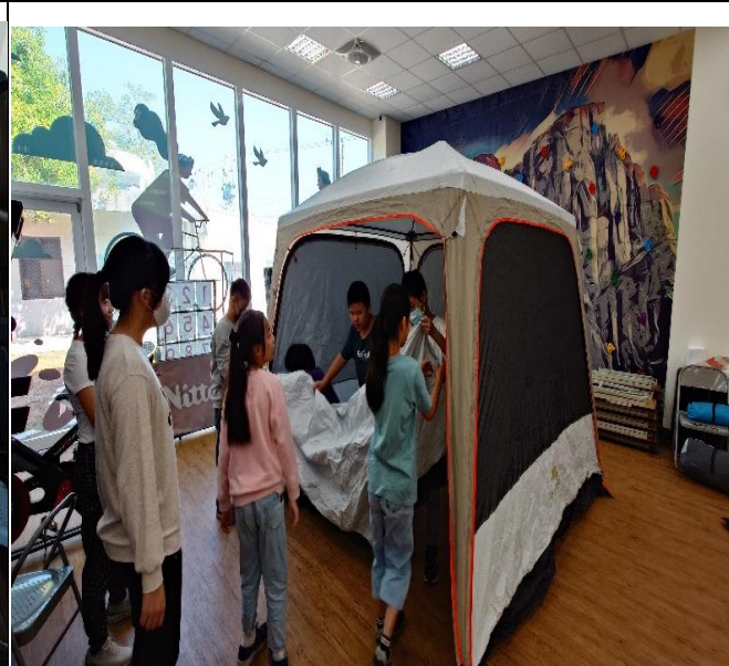
山野教育行前課程-搭帳棚