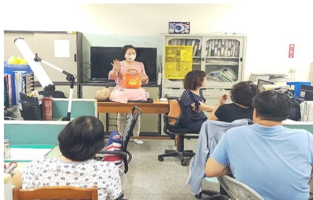
教師 CPR 及 AED 研習