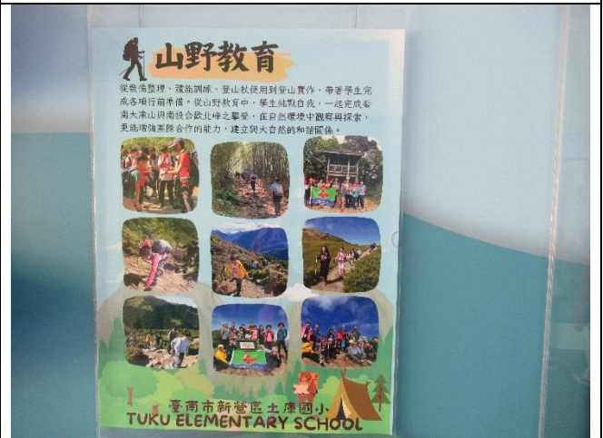
實施山野教育課程