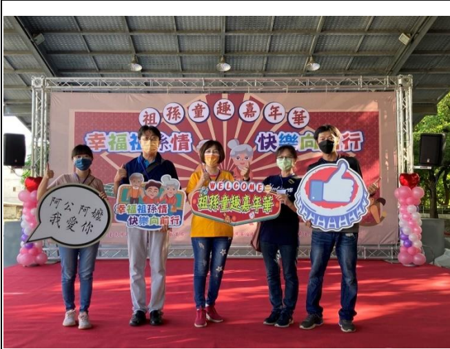
校長、主任參與社區辦理的祖孫週活動