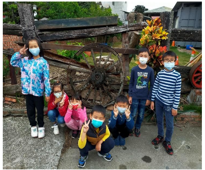
社區巡禮-社區文物