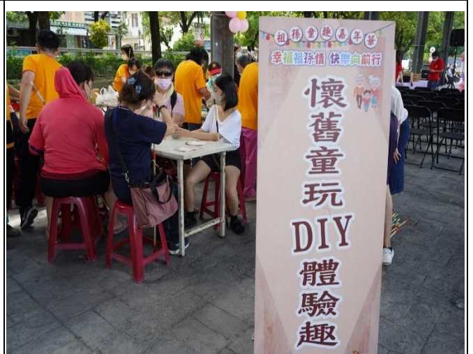
祖孫週活動-懷舊童玩 DIY 體驗活動