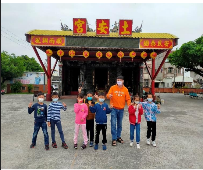
社區巡禮-社區廟宇