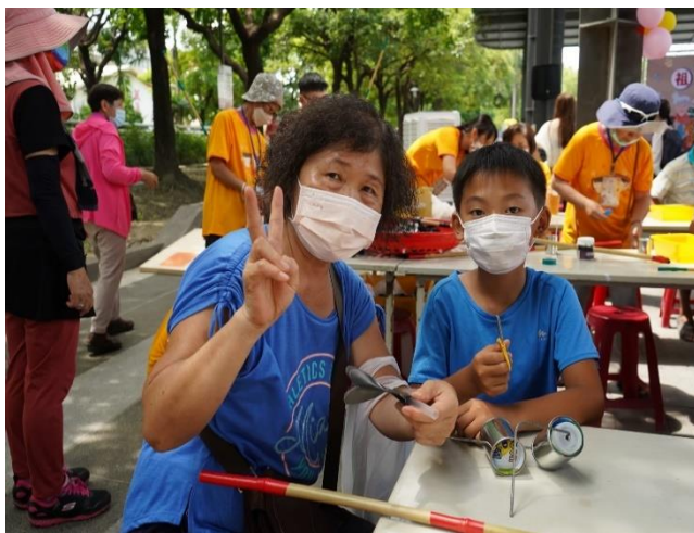
學生與奶奶參加祖孫週活動