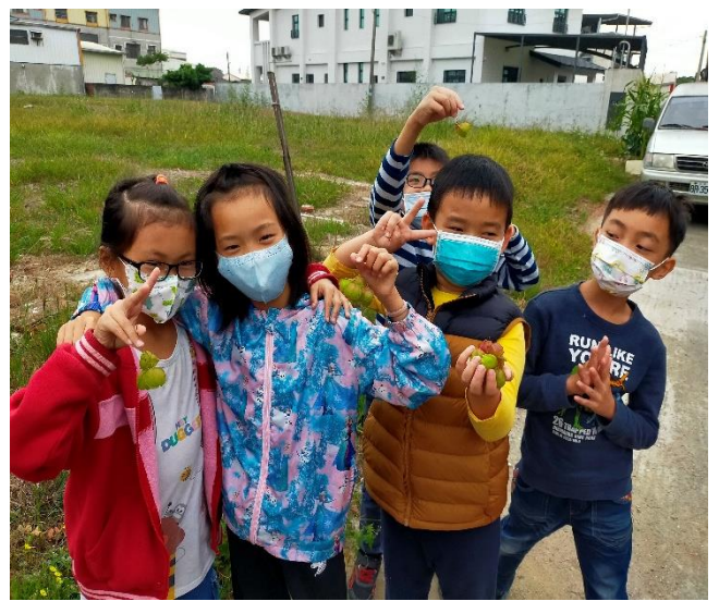
社區巡禮-社區植物