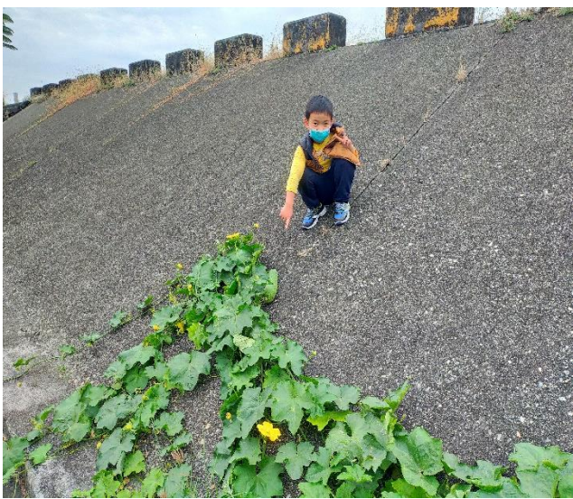
社區巡禮-社區植物