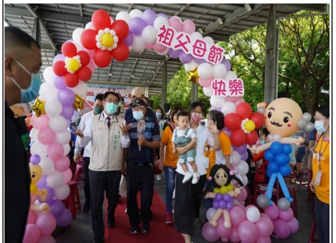
市長參加祖孫週活動