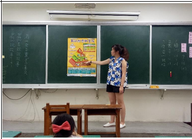
董事基金會-飲食金字塔