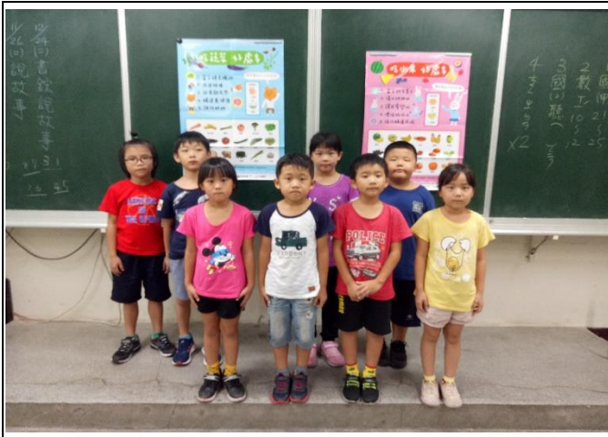
多吃蔬果好處多多