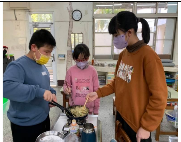
食農教育-利用米製作炒麵