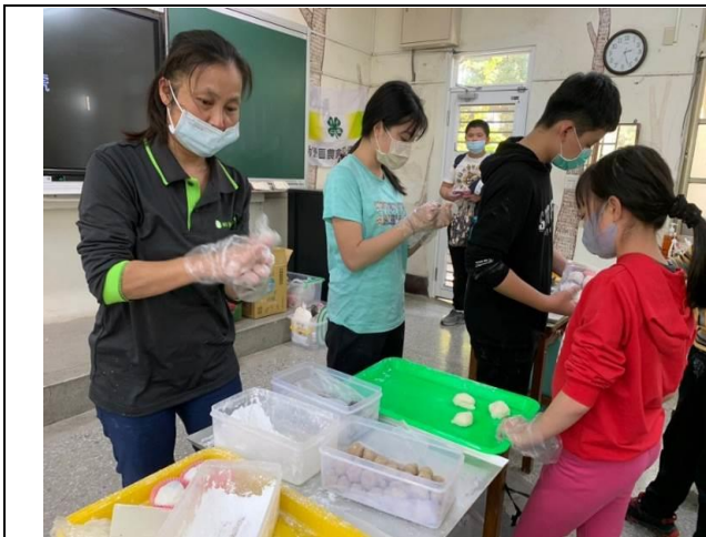
食農教育-利用米製作麻糬