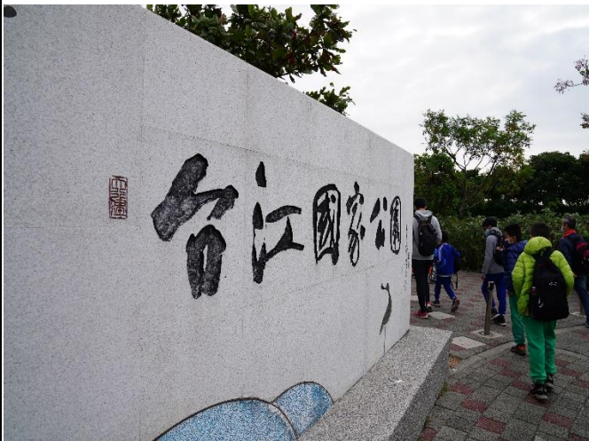
台江國家公園海洋教育