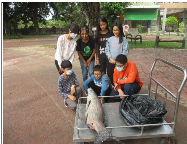
學生實地觀察烏鯧