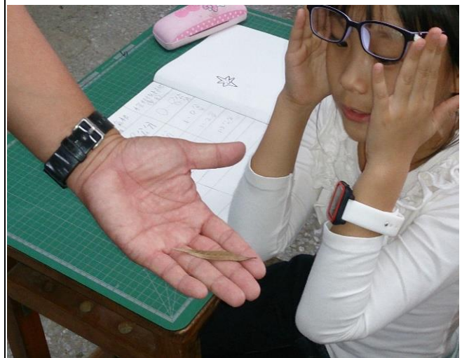
實際觀察白條斑蔭蝶的外觀