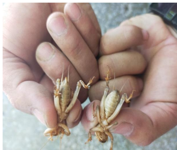
公母蟋蟀傻傻分不清楚