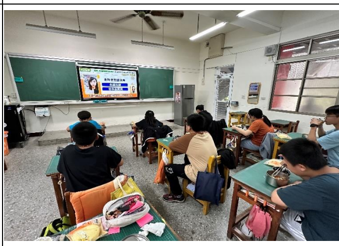
餐前五分鐘宣導飲片