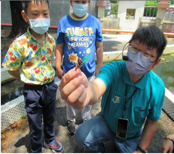
把蚯蚓掛在魚鈎上