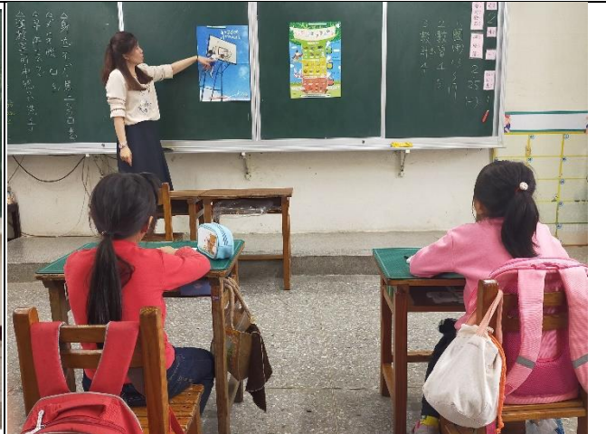
每日兩份奶身強體壯