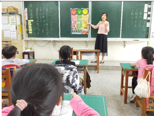
董事基金會-飲食紅綠燈