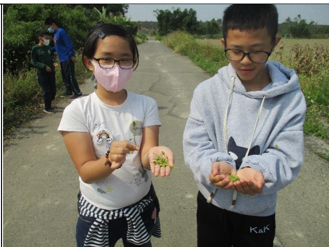
實地觀察「鬼針草」的構造