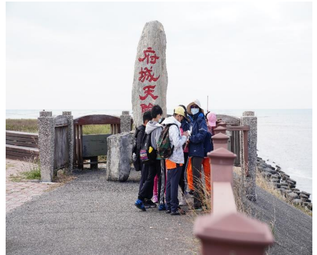
台江國家公園海洋教育