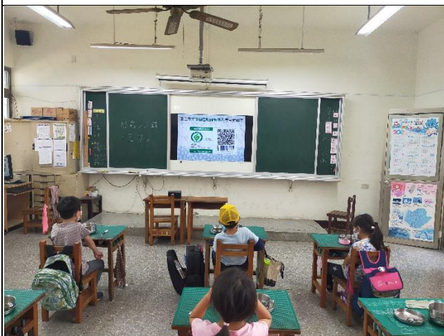
要選產銷履歷驗證農產品