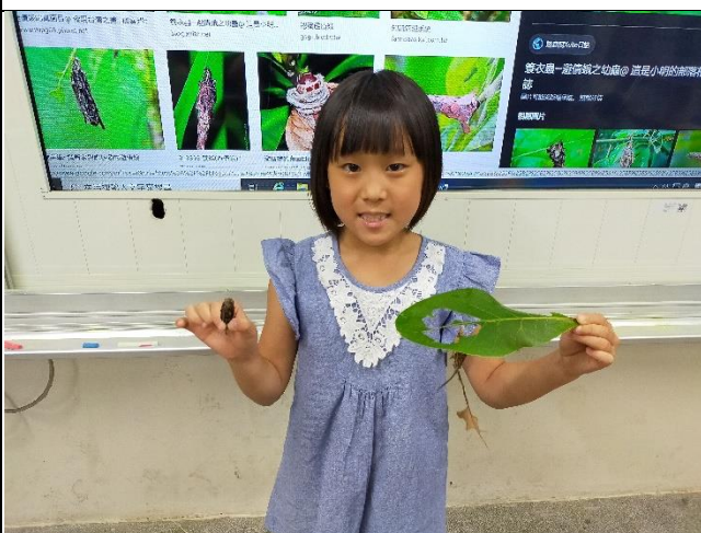
在校園中發現避債蛾