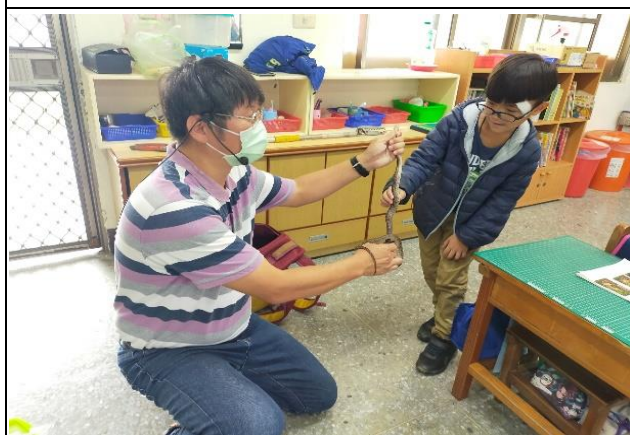
蛇類觀察-摸摸身體