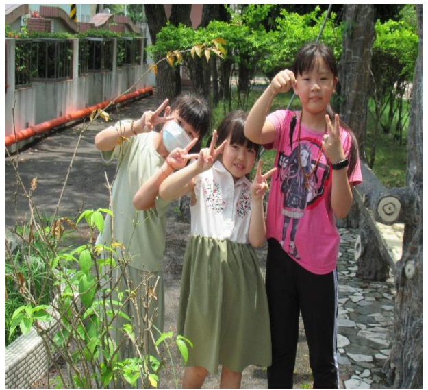
在學校生態池收穫一條泰國線鱧