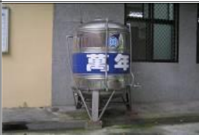
RO 系統廢水集水桶用於澆灌植物