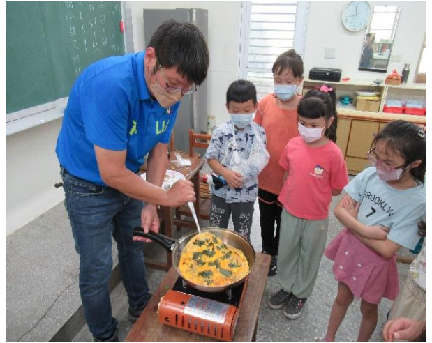
麻油虎頭蜂蜂蛹煎蛋