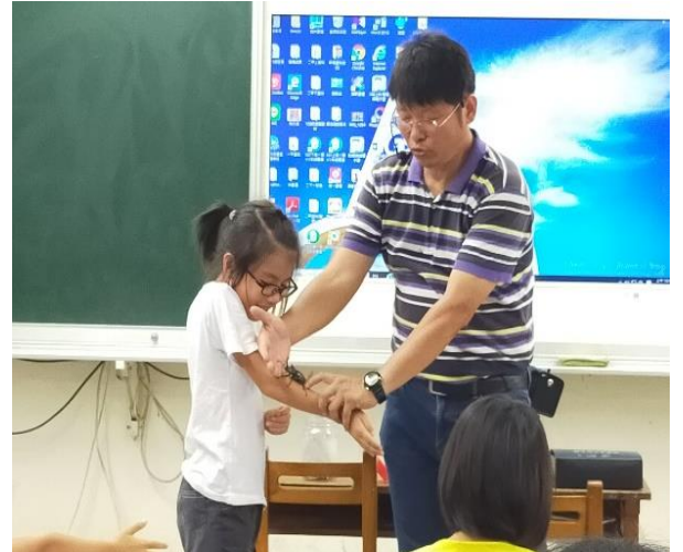
甲蟲-偷摸屁股就會往前跑