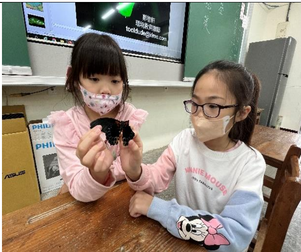
觀察折翼的台灣鳳蝶