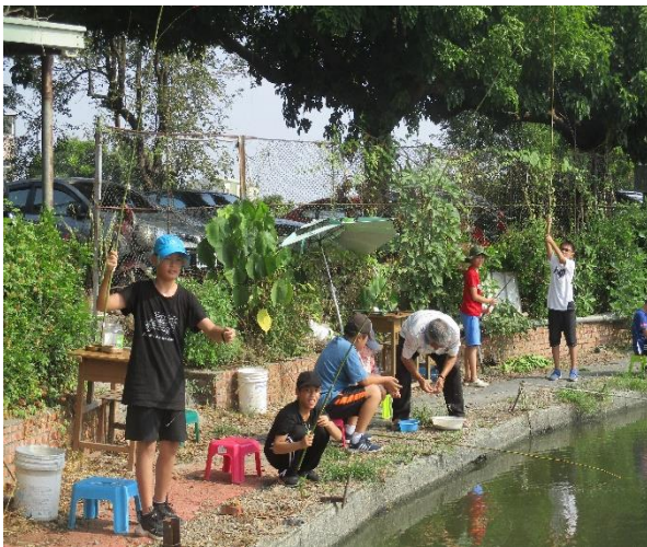
親自享受釣魚樂趣