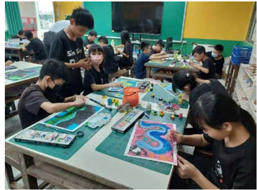
學生創作自己獨一無二的版畫