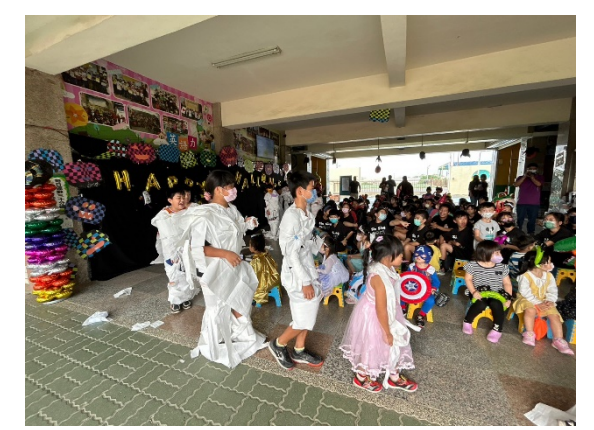
家長們協助孩子們變裝成木乃伊