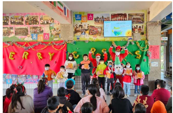
校長和會長妝扮成耶誕老人給各班送來禮物和祝福