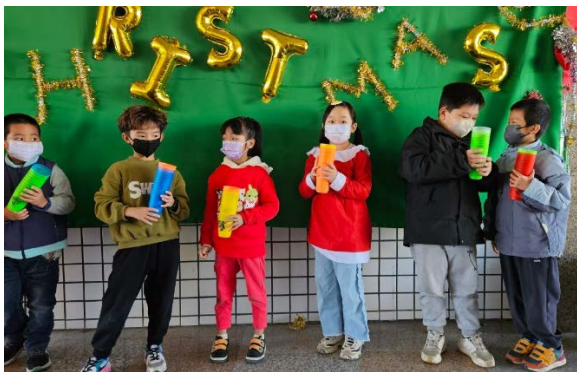
各年級進行快手疊杯比賽