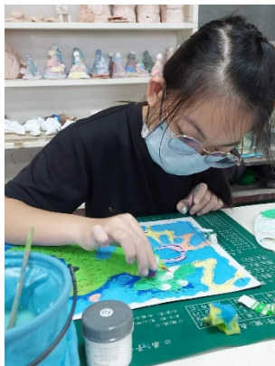
學生創作自己獨一無二的版畫