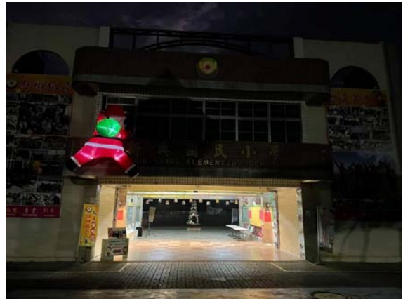
夜晚溫馨的新興國小