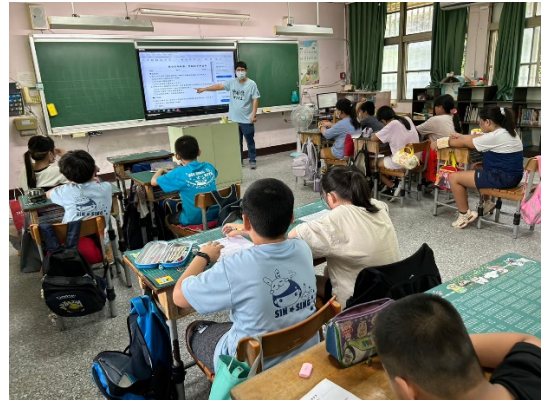
高年級性平入班宣導