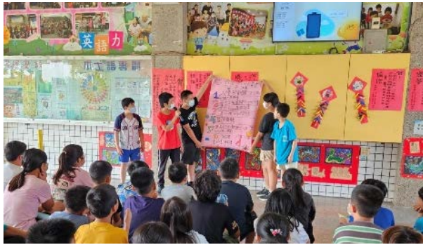
自治小市長政見發表