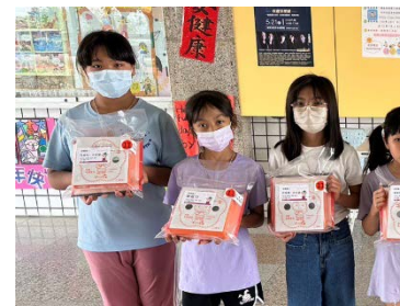
基金會提供食物箱、端午節提供粽子、中秋節提供月餅，幫學生補充營養 兒童節提供禮物，讓學生開心過兒童節