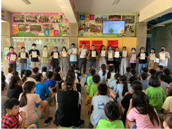
教師們收到學生親筆繪製的獎狀