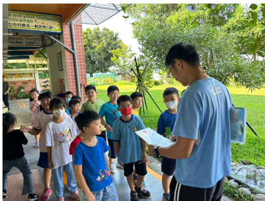
社團老師收到學生親手繪製的獎狀