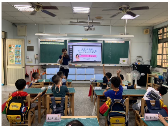
高年級性平入班宣導