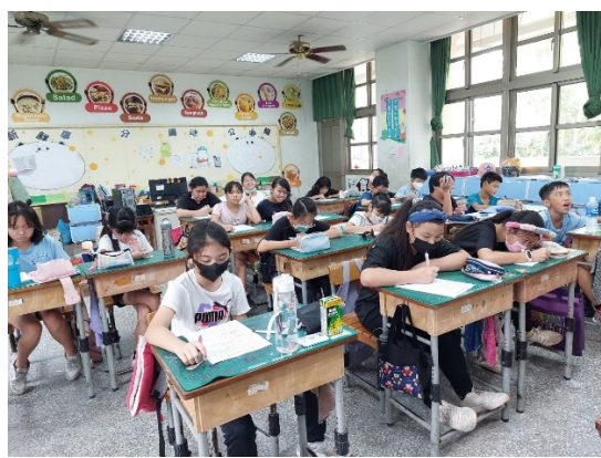
認真填寫性平學習單