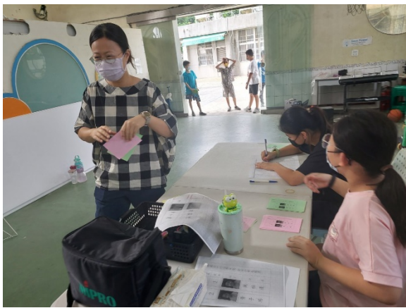
學生擔任領票工作人員