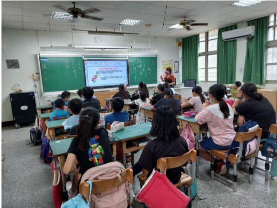
高年級性平入班宣導