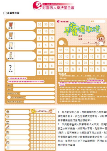
每天提供早餐，讓學生健康吃早餐