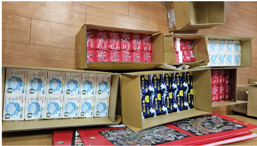
學校協助採購衛生用品提供弱勢學生使用