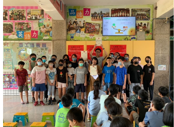
教師們收到學生滿滿的祝福