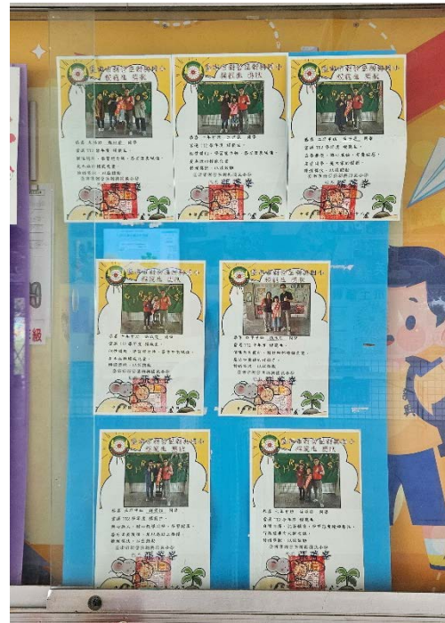
公布欄-品德小天使