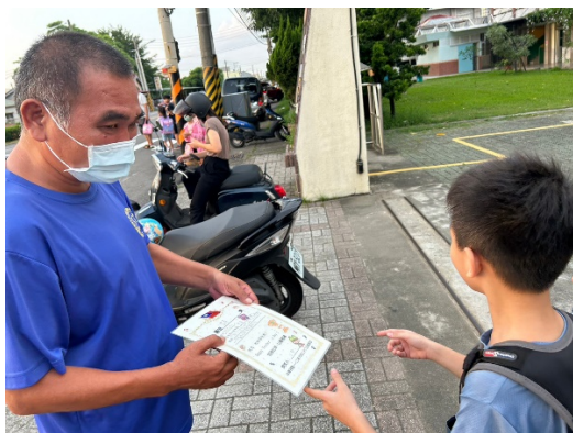
保全叔叔也收到學生親手繪製的感謝獎狀