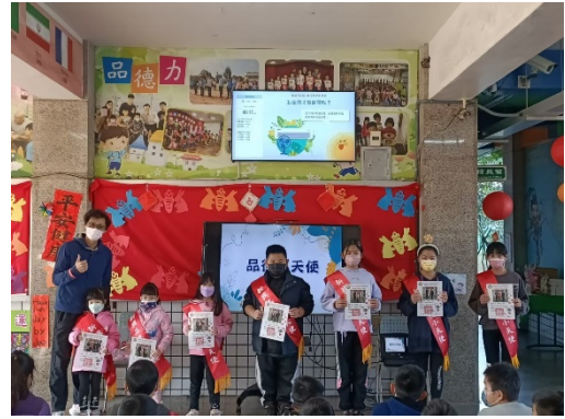
期末公開表揚-品德小天使