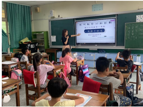
高年級性平入班宣導