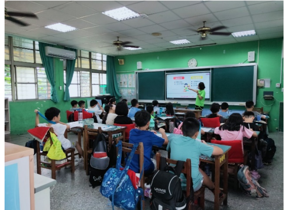
高年級性平入班宣導