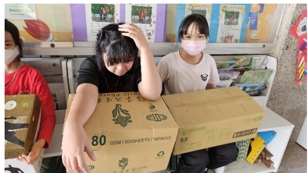
提供弱勢學生衛生用品