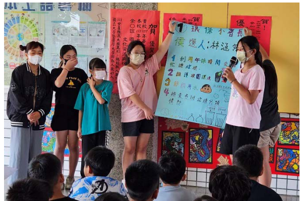
環保小署長政見發表