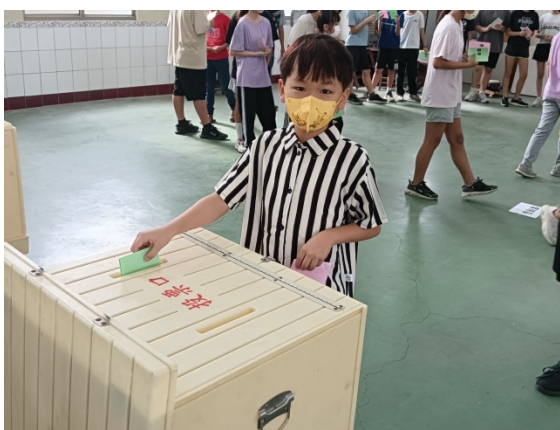
投下民主且神聖的一票