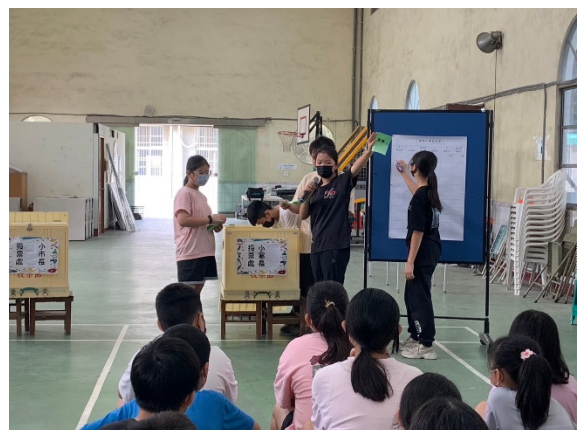
學生進行開票計票