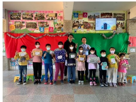
協會人員到校贈送聖誕節禮物，讓學生溫馨過聖誕