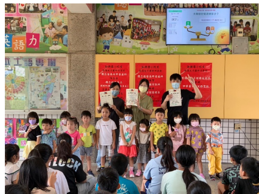
幼兒園老師們也收到滿滿的祝福