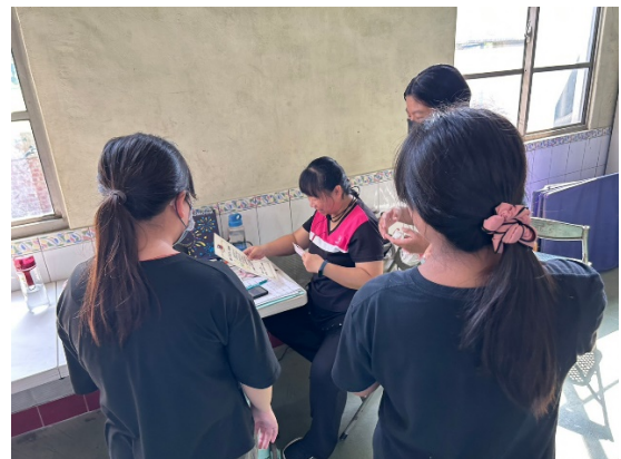
親口祝福老師教師節快樂