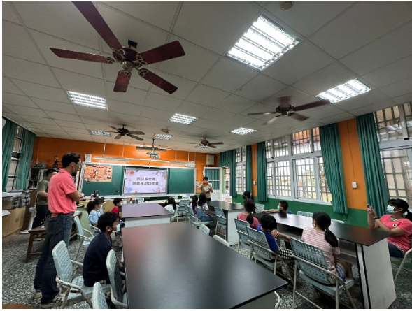
樂扶基金會工作人員第一次到校說明會