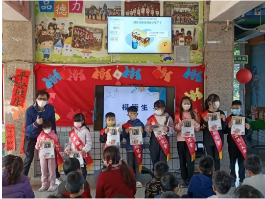
期末公開表揚-模範生