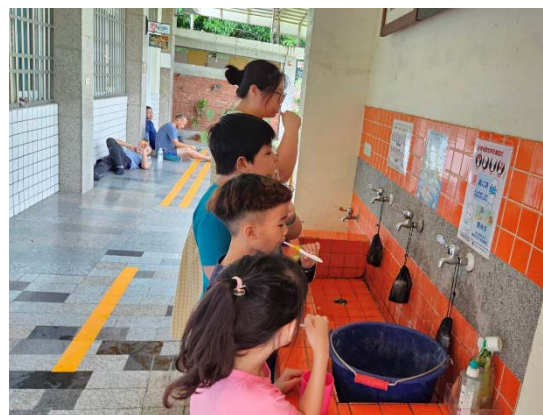
指導學生使用含氟牙膏潔牙