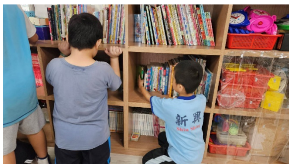
學會如何整理書櫃