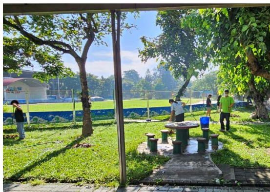
掃地時間指導學生環境打掃