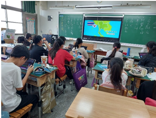
認識五穀根莖類食物的營養