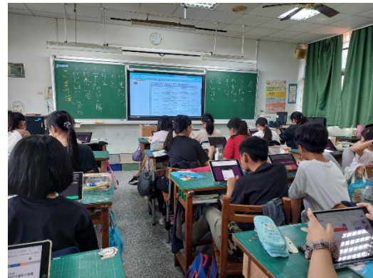
認識五穀根莖類食物的營養