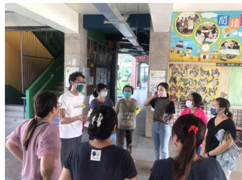
演練結束後檢討會