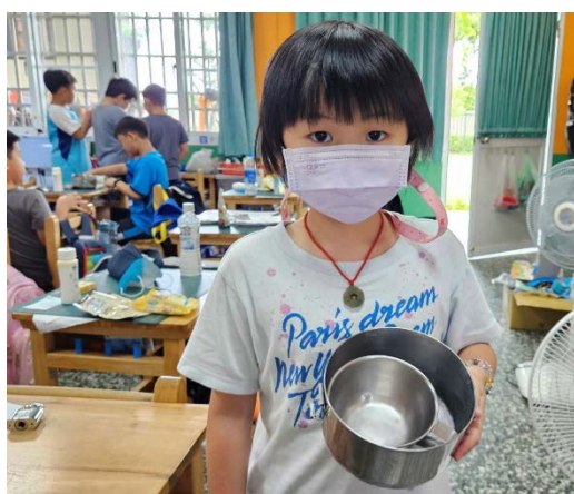
午餐吃光並擦拭乾淨