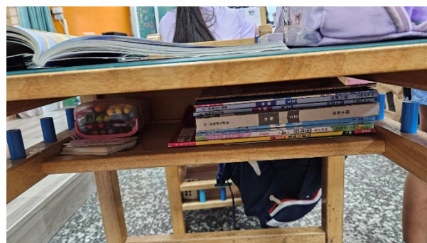
教導學生如何整理抽屜