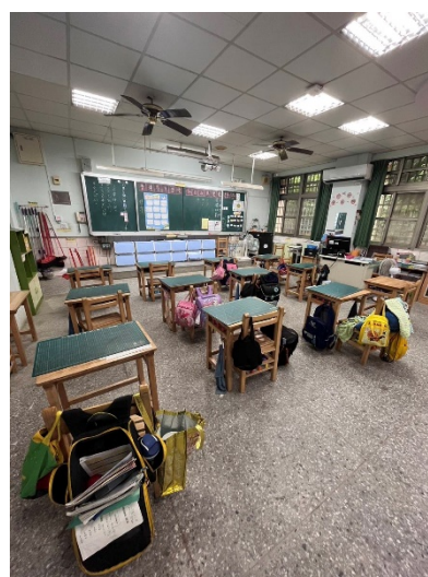
下課教室淨空學生到戶外打球