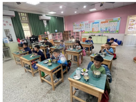
均衡飲食營養的午餐