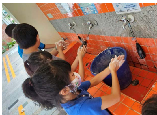
學會如何正確洗手(濕搓沖捧擦)