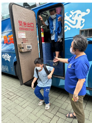
戶外教育遊覽車安全逃生訓練