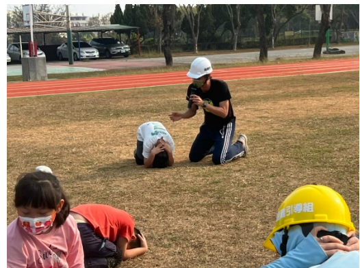
在外遇到地震時的動作示範