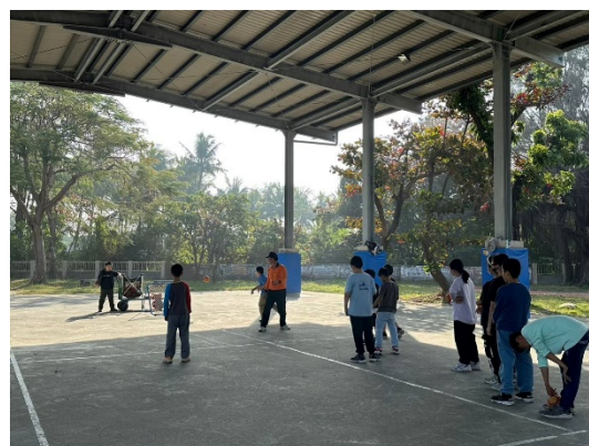
下課時間到戶外運動