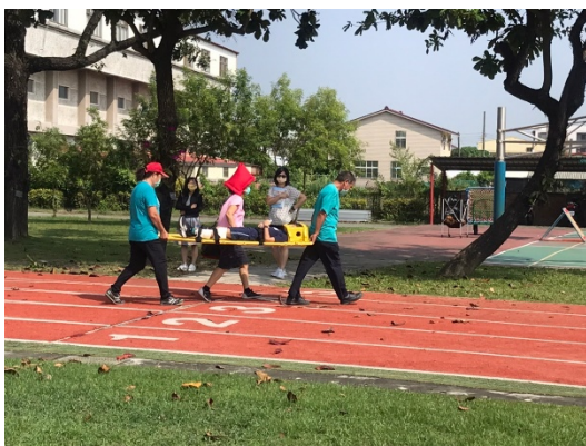
學生受困及受傷演練