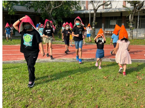
地震稍歇，有秩序到操場集合