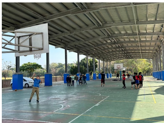
樂活時間到戶外運動