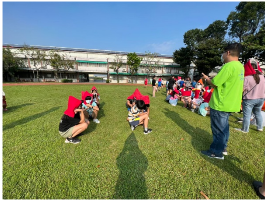
學生有秩序等待教師清點人數後回報