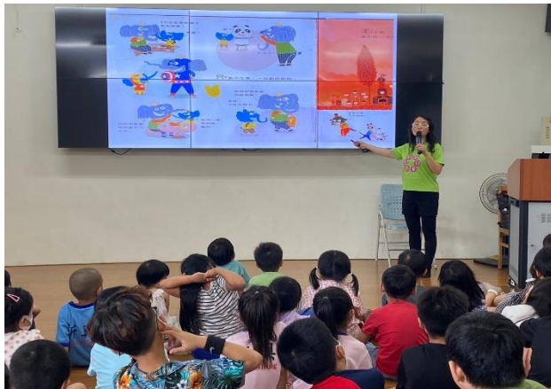
甜甜劇團到校利用繪本宣導心理健康