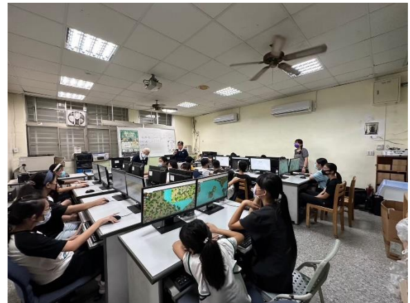
積極參與 pogamo 環境衛生健康競賽