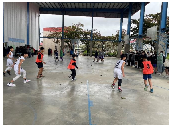
積極參與校際運動比賽