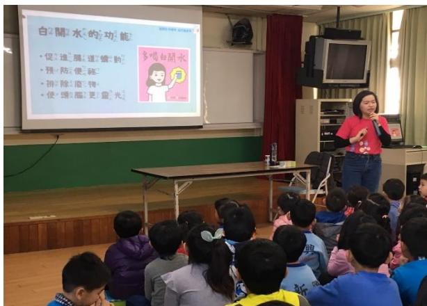
董氏基金會宣導健康飲食生活觀念