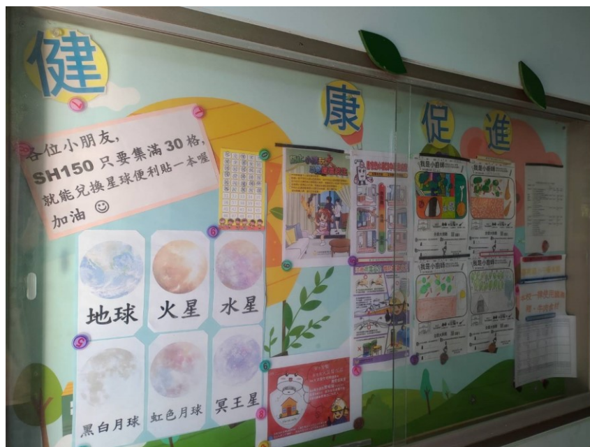
提供學生健康資訊看板，營造學習氛圍