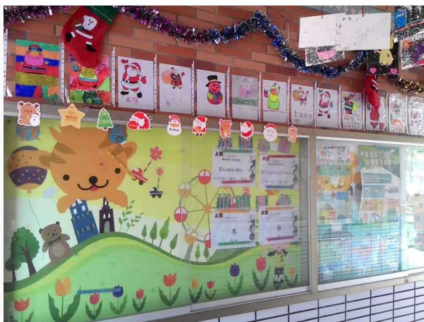
利用學生作品布置耶誕節活動