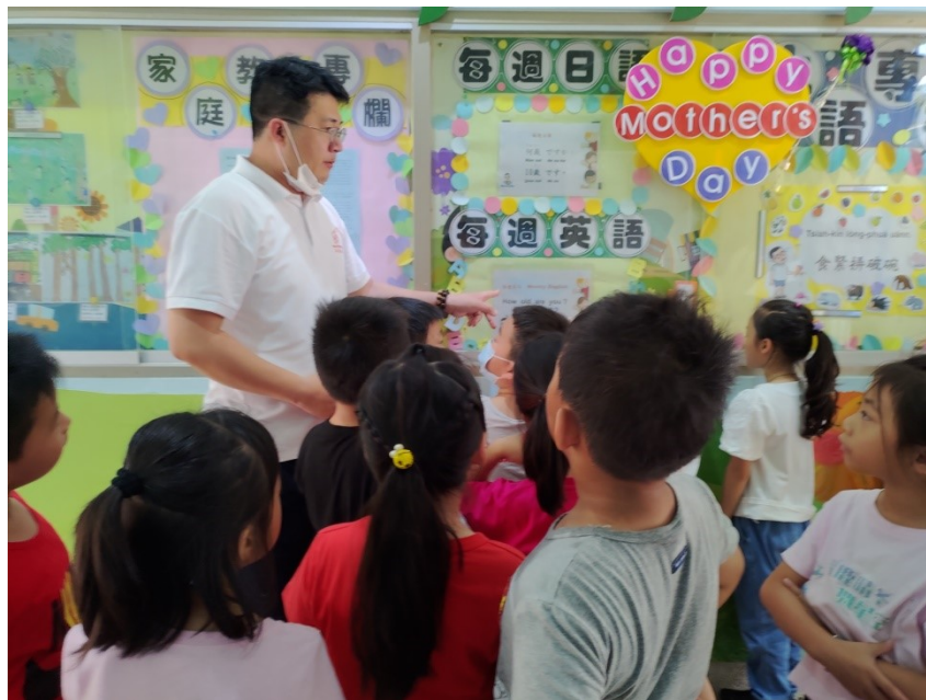
老師帶領學生認識佈告欄的活動(母親節)