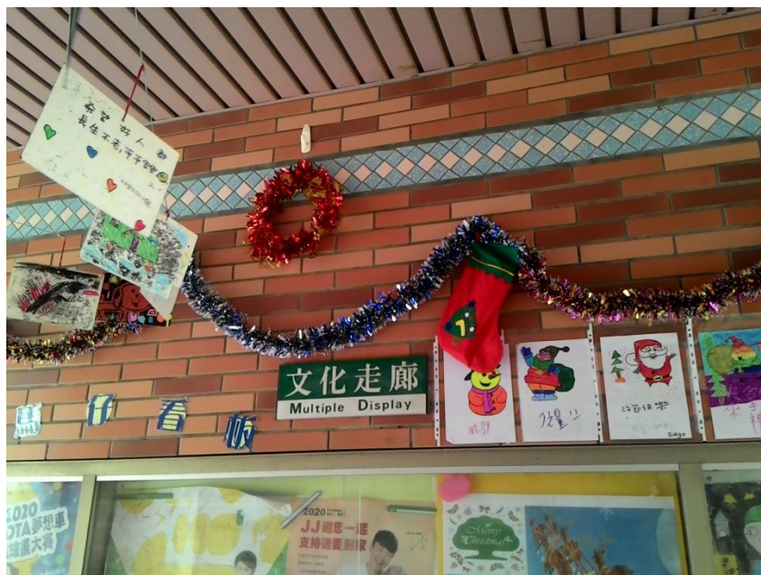
利用學生作品布置耶誕節活動