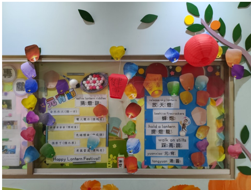
教師手做元宵節裝置藝術(燈籠)及猜謎