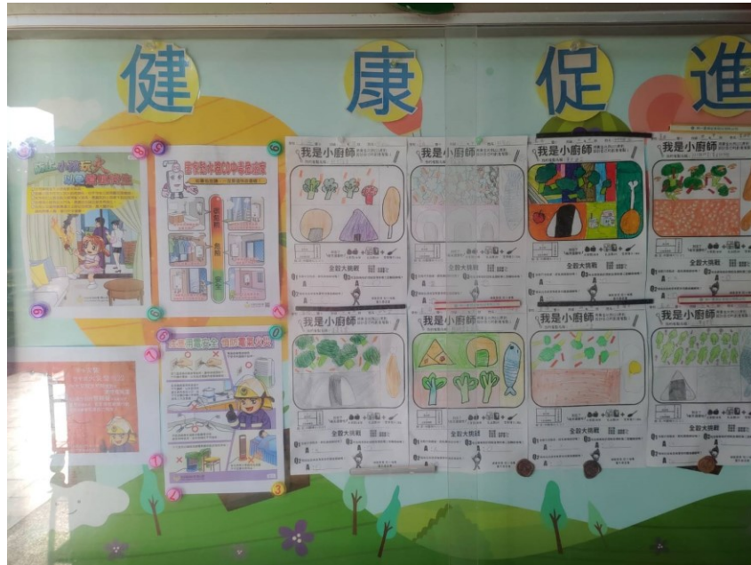
提供學生健康資訊看板，營造學習氛圍