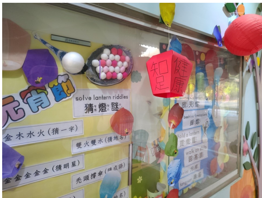
教師手做元宵節裝置藝術(天燈)及猜謎