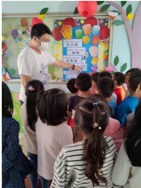
老師帶領學生認識佈告欄的活動(元宵節)