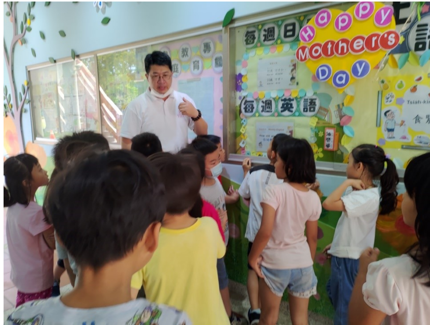
老師帶領學生認識佈告欄的活動(母親節)