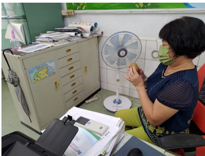
下午茶時間，鼓勵老師多吃水果