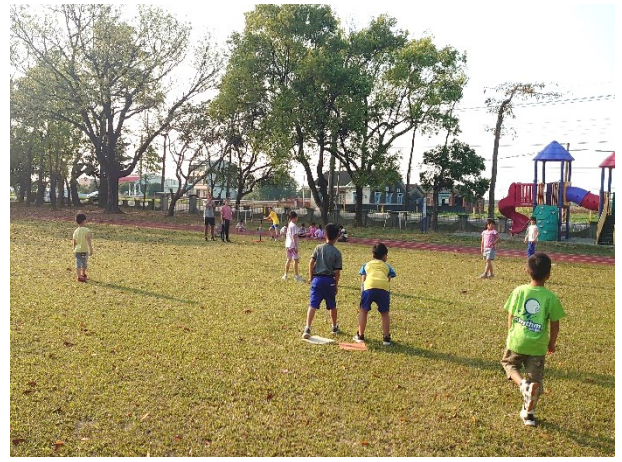
開設多元社團-中低年級學生樂樂棒球社