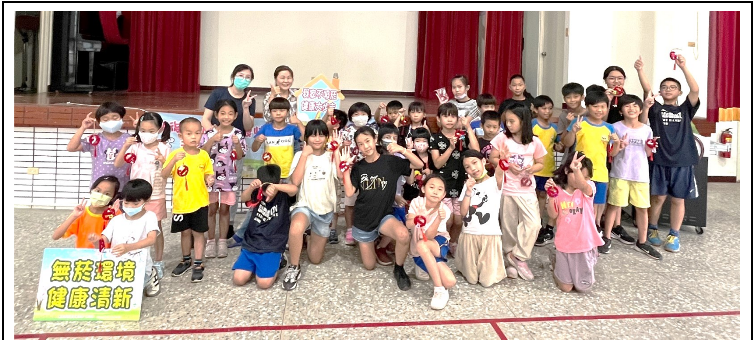
積極配合衛生所到校辦理無菸校園_禁菸吊飾 DIY 活動-衛生所護理師宣導情形