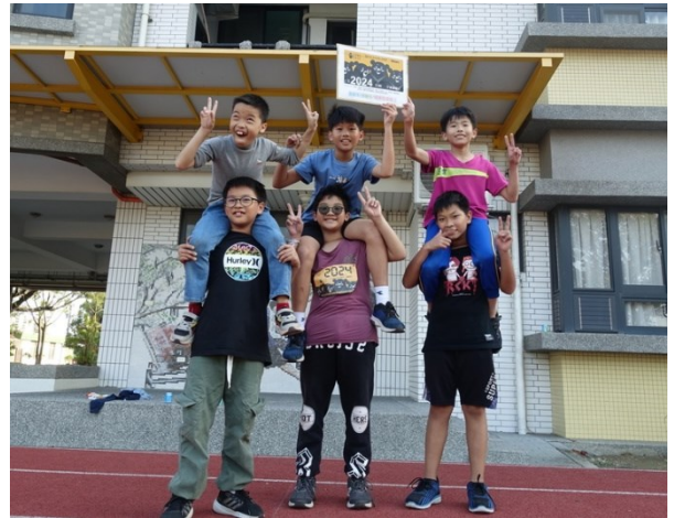
學生馬拉松接力賽選手合影