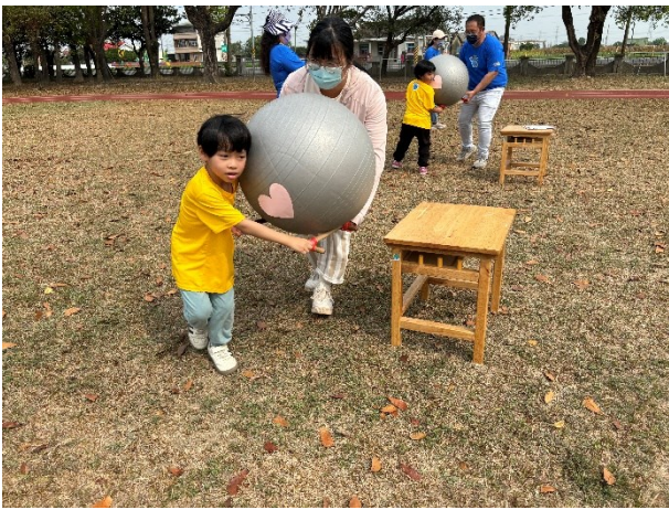
每學年舉辦一次校慶運動會，邀請社區民眾共同參與，提升運動風氣