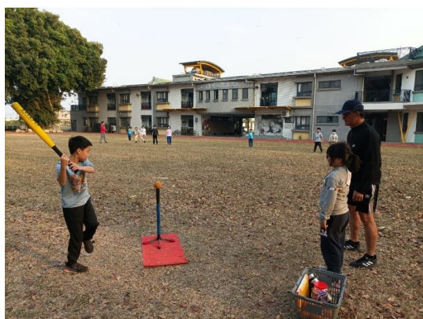
中低年級學生樂樂棒球社團課程照片