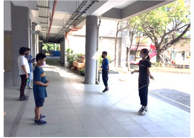
平時推動校內跳繩運動，鼓勵學生進行練習