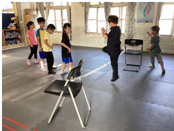
低年級學生跆拳道社團課程照片