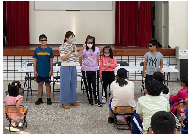
配合特教視障宣導進行視力病症體眼活動