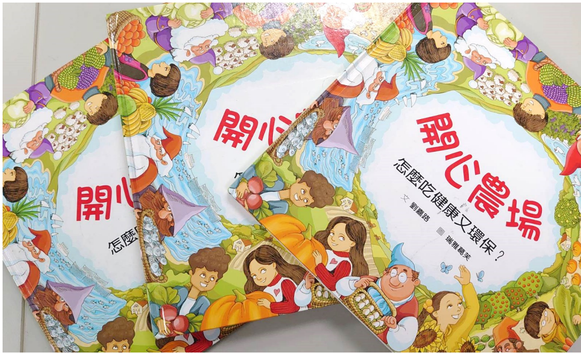
結合布可星球書單進行健康繪本閱讀-開心農場