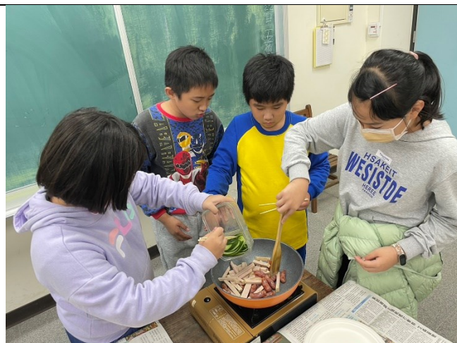
落實教學活動：配合校本進行飲食教育烹飪活動