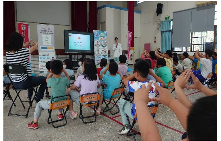
落實各項宣導：驗光師公會到校進行視力保健宣導