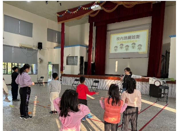
每學期舉辦全校性混齡分組體育競賽-跳繩競賽