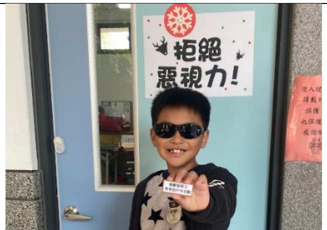
結合校內活動進行健促議題闖關活動-耶誕英語日