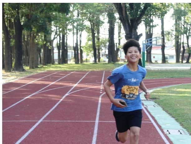
機動性參與體育活動競賽-2024 黑熊線上路跑活動