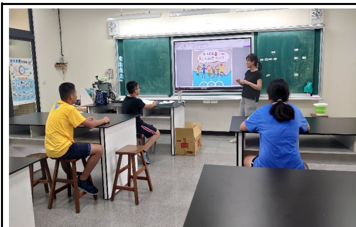
落實教學活動：六年級愛滋防治課程