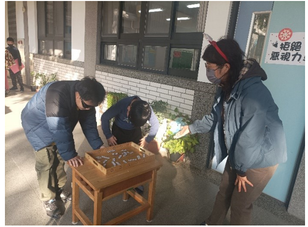
結合耶誕節闖關活動進行視力宣導-學生戴上眼疾體驗眼鏡進行活動