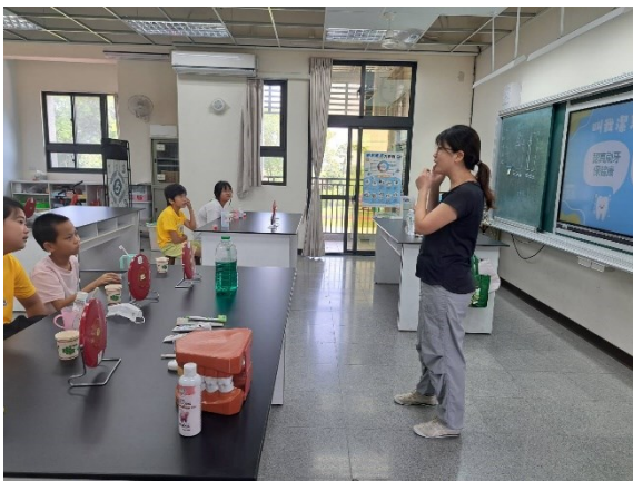
辦理校內潔牙比賽，並於比賽前進行宣導活動