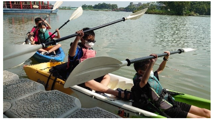
學生於湖畔練習划槳動作並準備出發