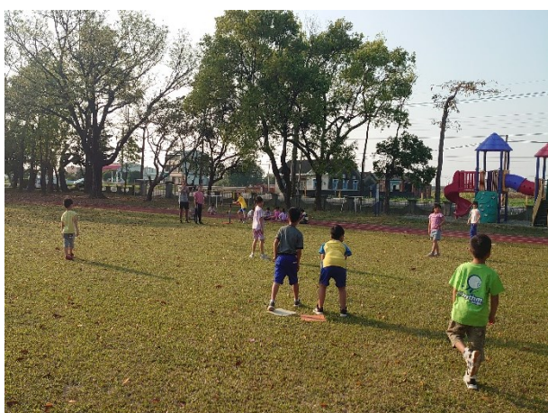
中低年級學生樂樂棒球社團課程照片