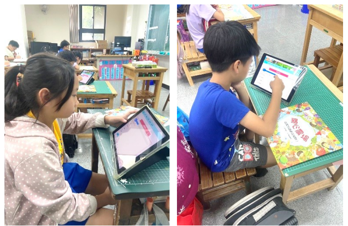
學生閱讀完後進行布可星球闖關