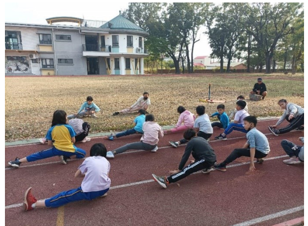
每年定期實施四至六年級學生體適能檢測-體育課柔軟度練習