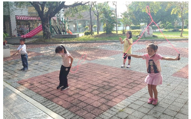
每週四早自修為全校體能活動時間，全體學生共同參與體育活動-跳繩活動