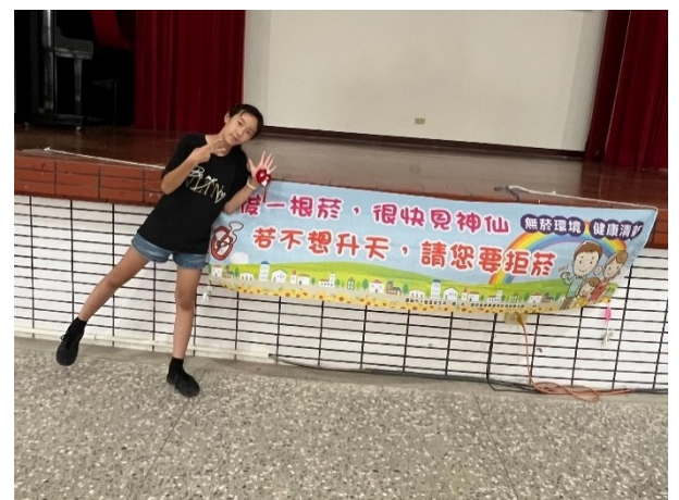
積極配合衛生所到校辦理無菸校園_禁菸吊飾 DIY 活動-學生製作過程