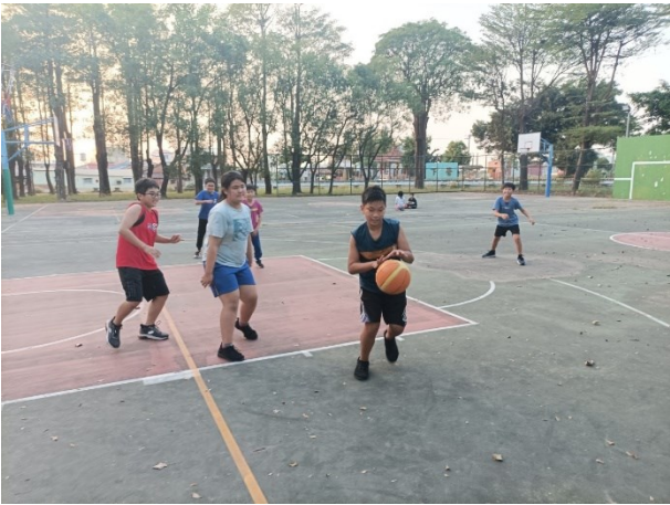
開設多元社團-中高年級學生籃球社團