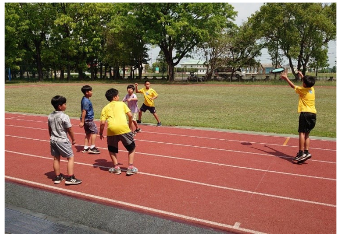
下課時間淨空教室，鼓勵學生到戶外活動