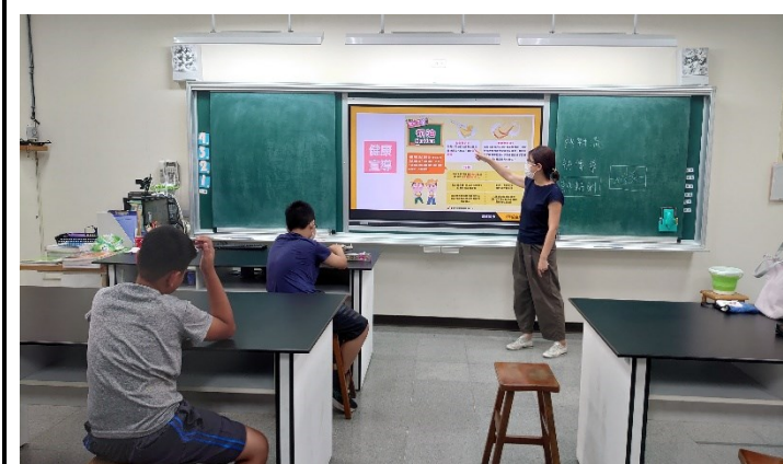
落實教學活動：配合相關課程進行飲食課程