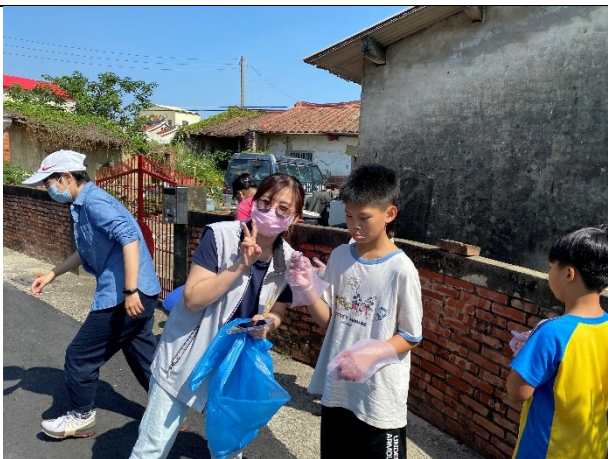
積極配合衛生所到校辦理無菸校園活動-學生在校園周邊撿拾菸蒂情形