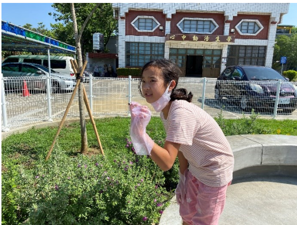
積極配合衛生所到校辦理無菸校園活動-學生在校園周邊撿拾菸蒂情形