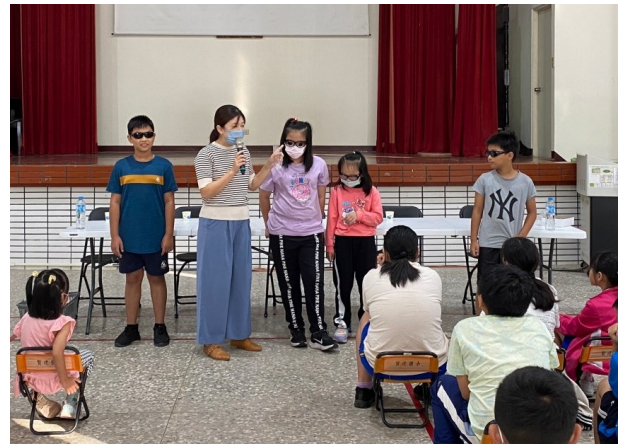
結合校內活動進行健促議題闖關活動-特教活動