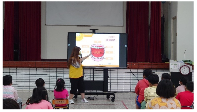
落實各項宣導：陽光基金會到校菸檳宣導