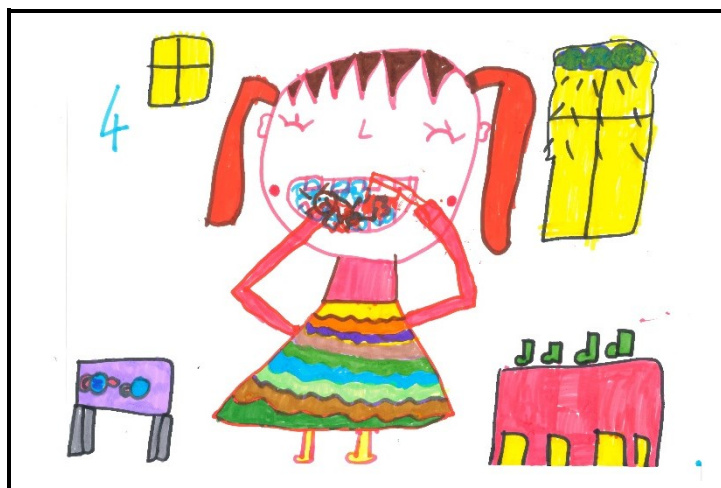
鼓勵學生進行口腔繪圖比賽-一甲學生作品