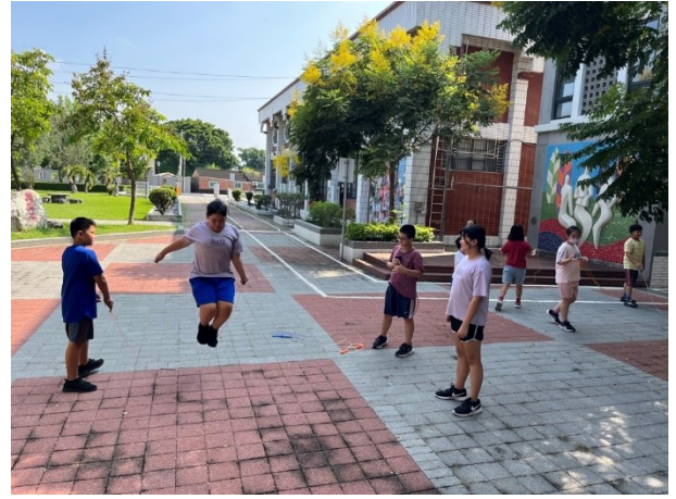
週三下午第一節下課課間活動時間為全校體能活動時間，全體學生共同參與體育活動-跳繩活動