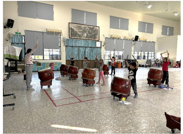
開設多元社團-低年級擊鼓團社團