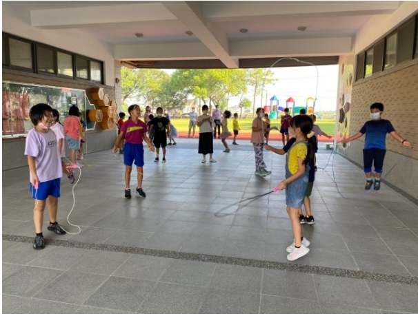
平時推動校內跳繩運動，鼓勵學生進行練習