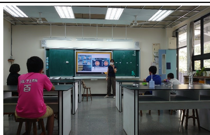
落實教學活動：五年級自然領域視力成像課程