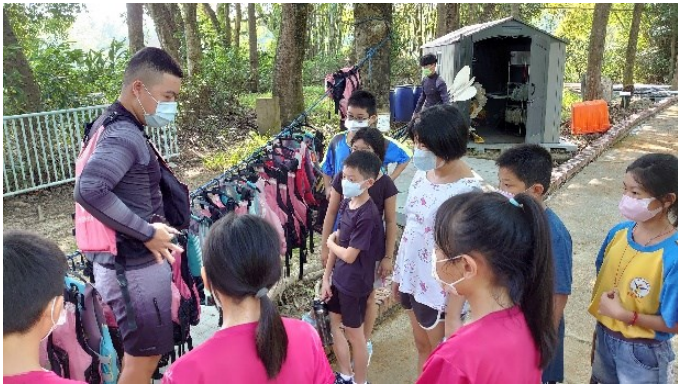
由專業獨木舟教練為學生進行相關課程講解