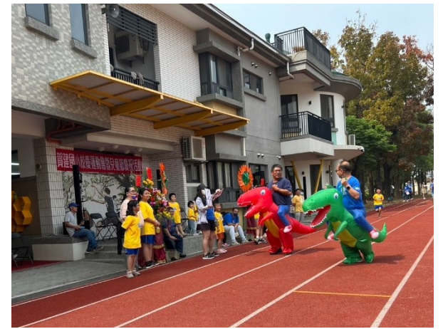
每學年舉辦一次校慶運動會，邀請社區民眾共同參與，提升運動風氣