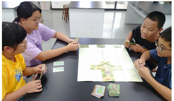
申請愛盲基金會防盲桌遊，讓學生在遊戲中學習視力保健的方式