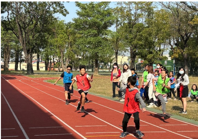
每週四早自修為全校體能活動時間，全體學生共同參與體育活動-大隊接力