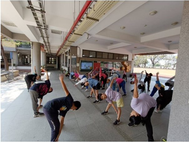
週三下午第一節下課課間活動時間為全校體能活動時間，全體學生共同參與體育活動-新式健康操