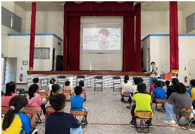
落實各項宣導：校內視力保健宣導