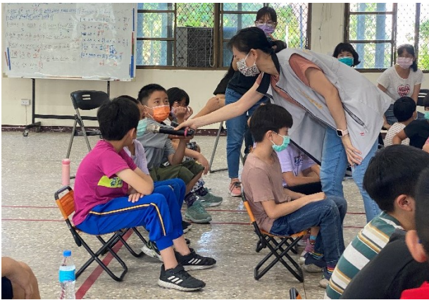
落實各項宣導：衛生所到校進行健促相關議題宣導