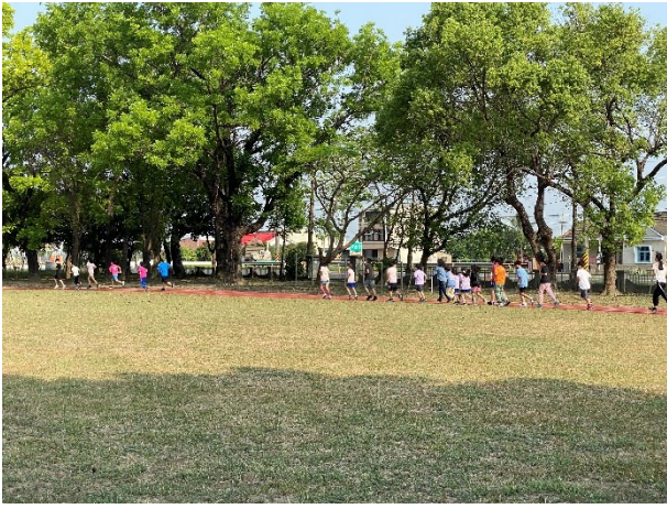
每週一學生朝會後進行全校大跑步活動