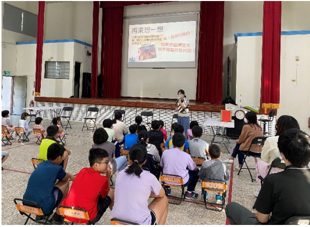
配合特教視障宣導進行視力保健宣導