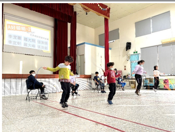
固定參與每年教育局舉辦之跳繩接力賽-校內選手選拔賽