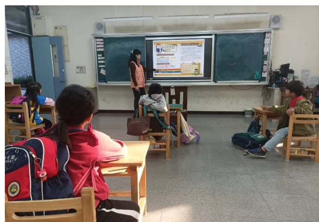
落實教學活動：學生健康飲食課程