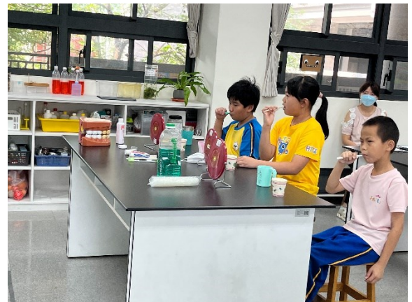
辦理校內潔牙比賽，學生潔牙情形