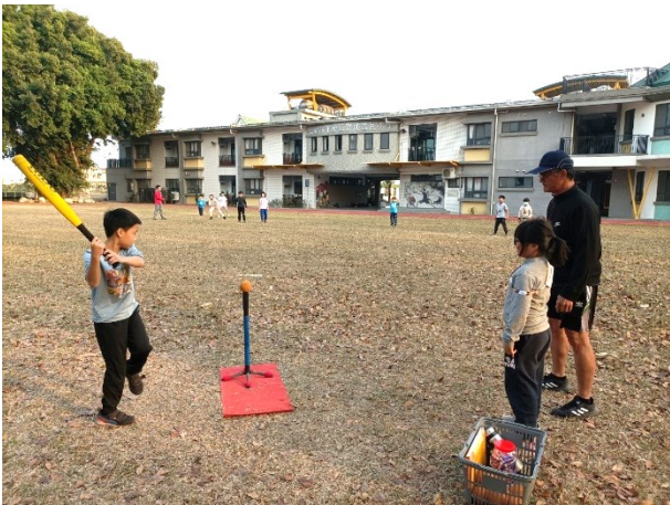
每學期舉辦全校性混齡分組體育競賽-樂樂棒球賽