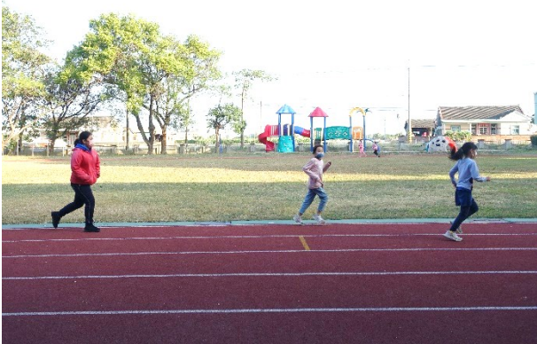
每週四早自修為全校體能活動時間，全體學生共同參與體育活動-跑步活動