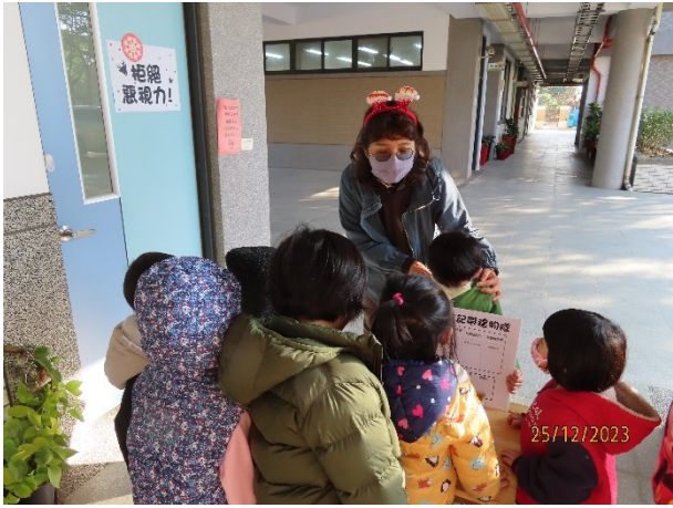
結合耶誕節闖關活動進行視力宣導-護理師關主進行宣導及說明