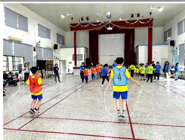
運動會配合校內 SH150 推動事項設計分組跳繩相關競賽