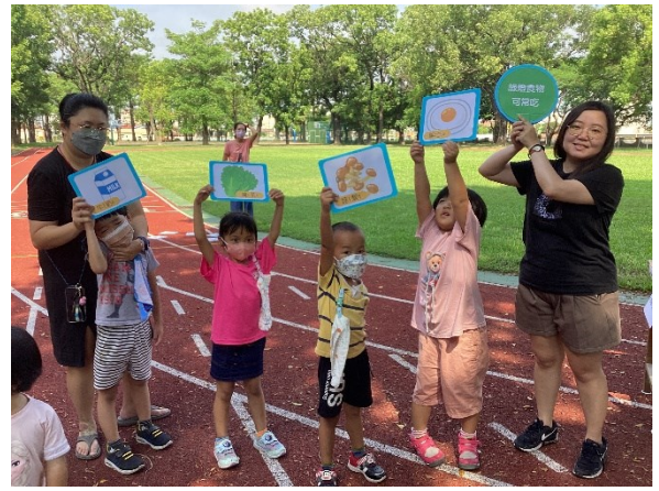
結合校內活動進行健促議題闖關活動-新生闖關