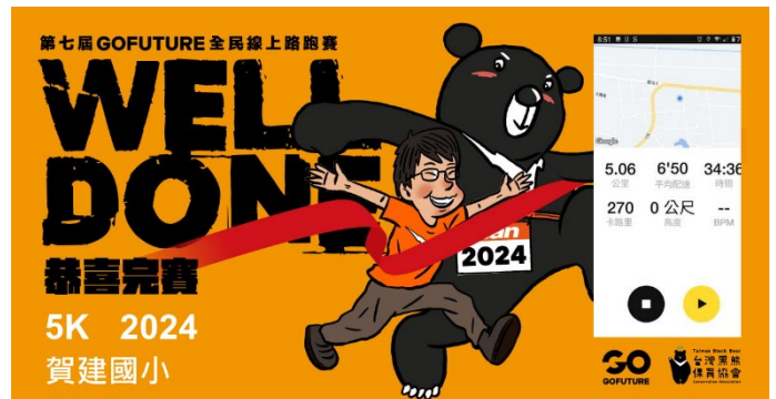
學生馬拉松接力賽完賽紀錄-5K