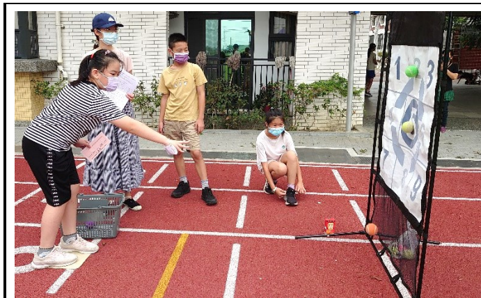
每學期舉辦全校性混齡分組體育競賽-體育闖關活動