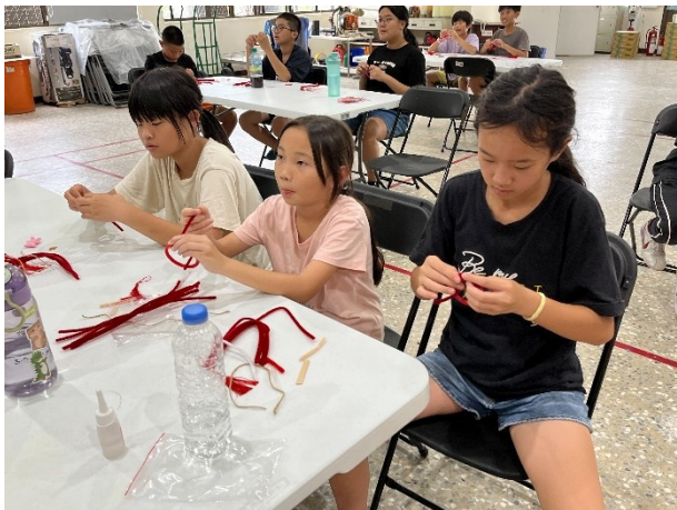
積極配合衛生所到校辦理無菸校園_禁菸吊飾 DIY 活動-衛生所護理師宣導情形