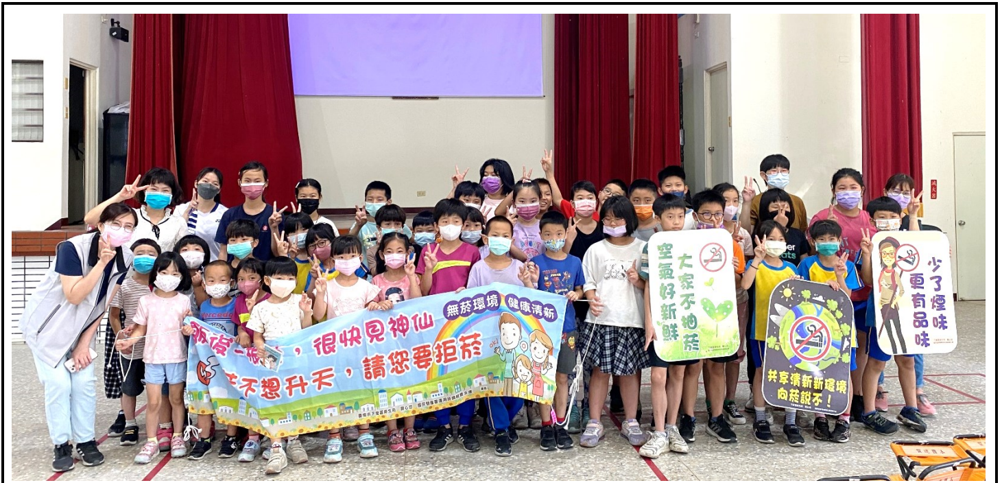
積極配合衛生所到校辦理無菸校園活動-衛生所護理師宣導情形