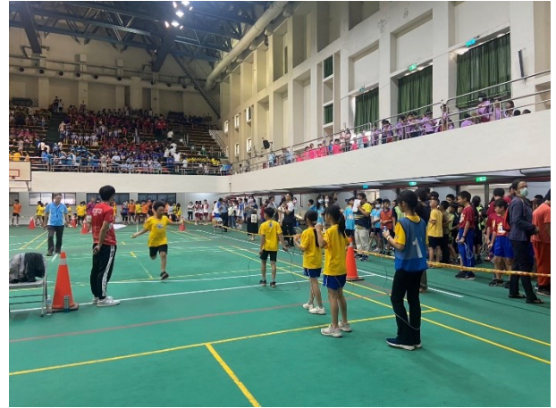
跳繩個人賽表現優秀學生參與跳繩接力賽情形，樂於其中，今年表現大幅進步