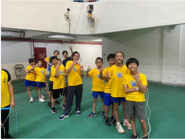
跳繩個人賽表現優秀學生參與跳繩接力賽情形，樂於其中，今年表現大幅進步