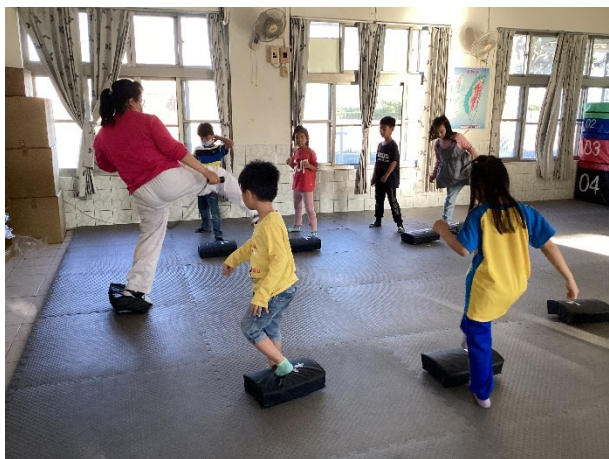
低年級學生跆拳道社團課程照片