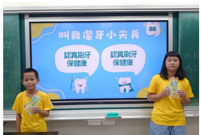
潔牙比賽表現優異之學生，於班會時間利用訪問宣導的方式，讓學生進行平時良好潔牙習慣之宣導