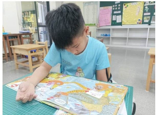
學生閱讀情形-二年級