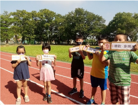
結合校內活動進行健促議題闖關活動-新生闖關