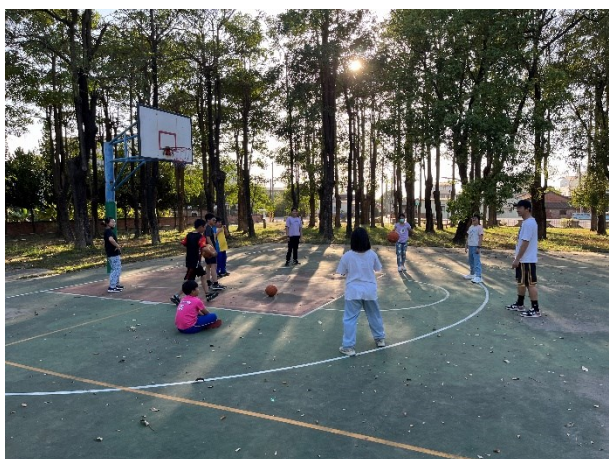
中高年級學生籃球社團課程照片