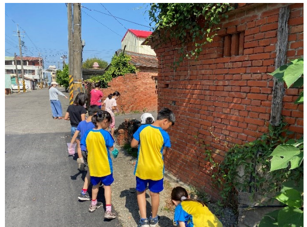
積極配合衛生所到校辦理無菸校園活動-學生在校園周邊撿拾菸蒂情形