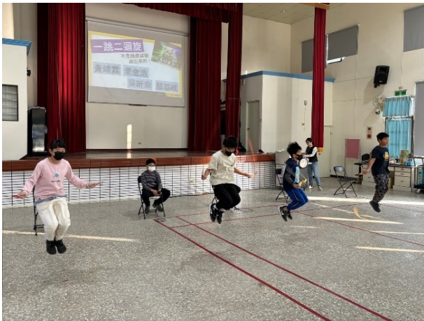
混齡分組進行校內跳繩競賽