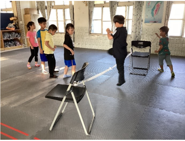
開設多元社團-低年級學生跆拳道社團