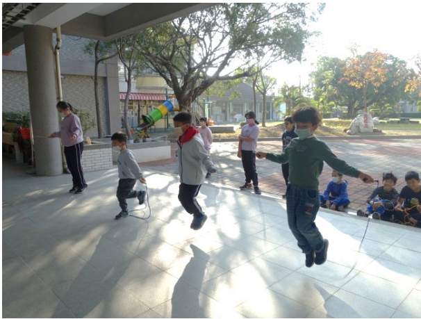
進行校內能力分組測驗，不分年段，依跳繩能力進行分組