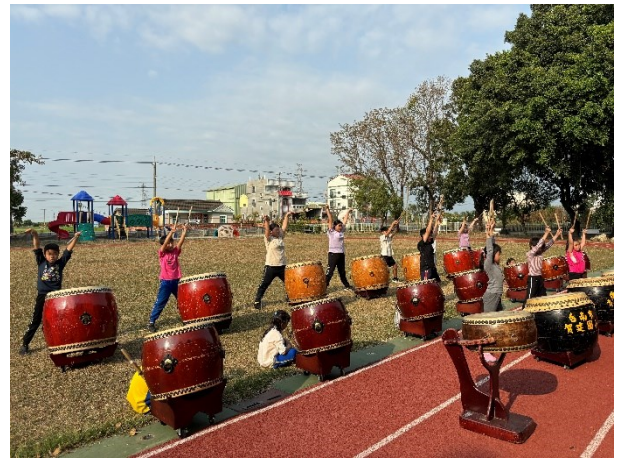
中高年級擊鼓團社團課程照片