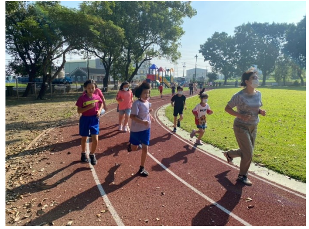
全體師生共同參與全校大跑步活動