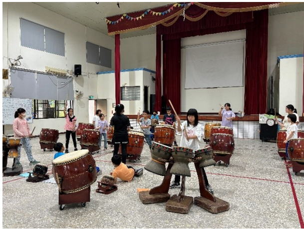
中高年級擊鼓團社團課程照片