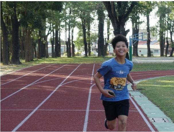
學生馬拉松接力賽跑步情形