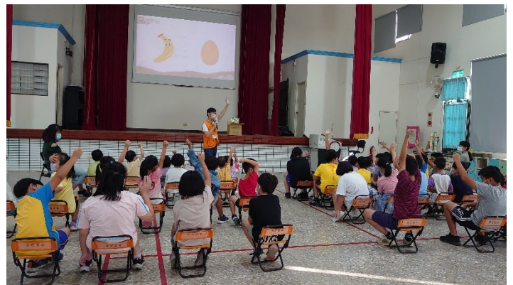
落實各項宣導：安德烈基金會食物碳足跡宣導