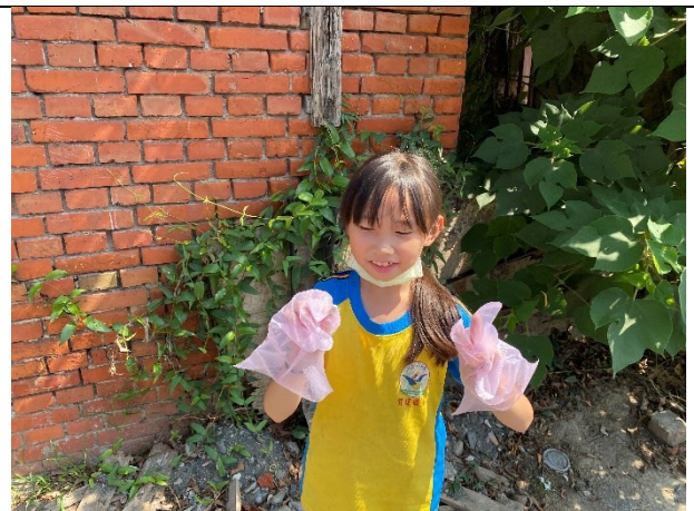
積極配合衛生所到校辦理無菸校園活動-學生在校園周邊撿拾菸蒂情形