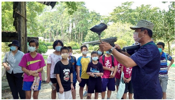
由專業漆彈教練為學生進行相關課程講解