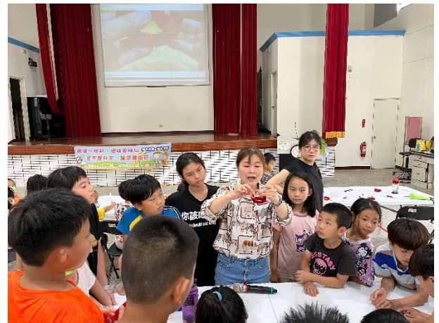
積極配合衛生所到校辦理無菸校園_禁菸吊飾 DIY 活動-衛生所護理師宣導情形