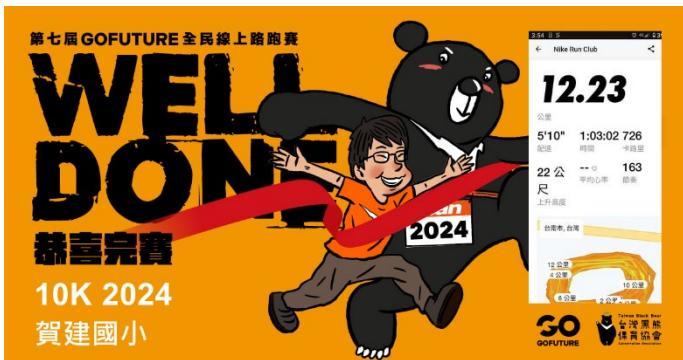
學生馬拉松接力賽完賽紀錄-10K