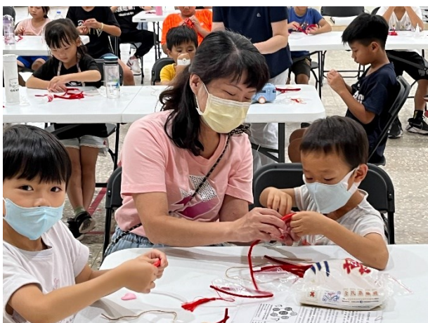
積極配合衛生所到校辦理無菸校園_禁菸吊飾 DIY 活動-學生製作過程