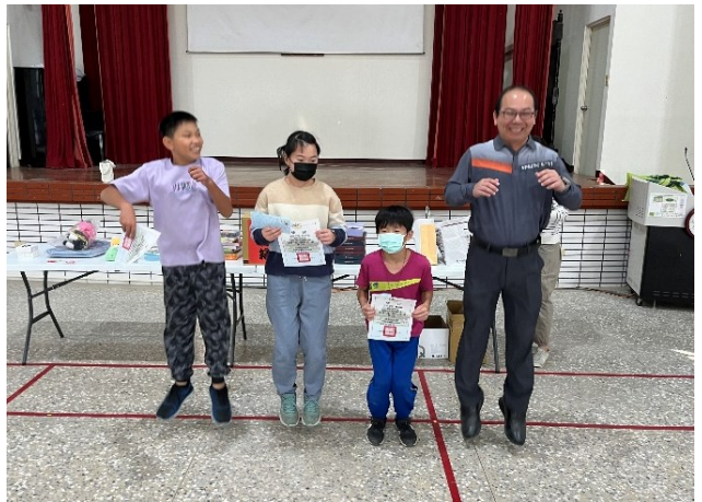
分組跳繩得獎學生由校長進行頒獎