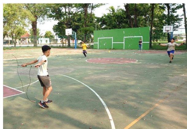
固定參與每年教育局舉辦之跳繩接力賽-練習過程