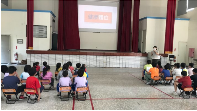
落實各項宣導：校內健康促進相關議題宣導