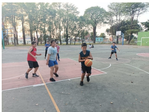
中高年級學生籃球社團課程照片