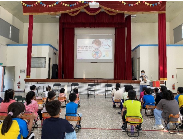
結合校內活動進行健促議題闖關活動-特教活動