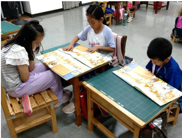
學生閱讀情形-一年級