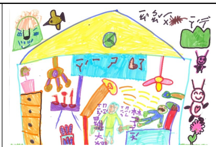
鼓勵學生進行口腔繪圖比賽-一甲學生作品