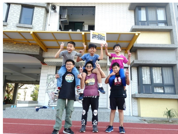
機動性參與體育活動競賽-2024 黑熊線上路跑活動