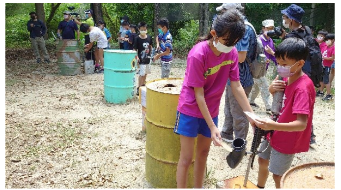
六年級學生指導學弟妹進行射擊操作