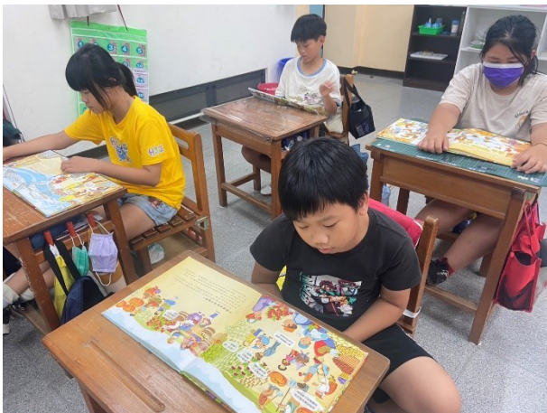
學生閱讀情形-四年級