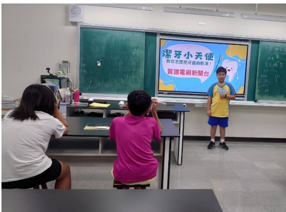
潔牙比賽表現優異之學生，於班會時間利用訪問宣導的方式，讓學生進行平時良好潔牙習慣之宣導