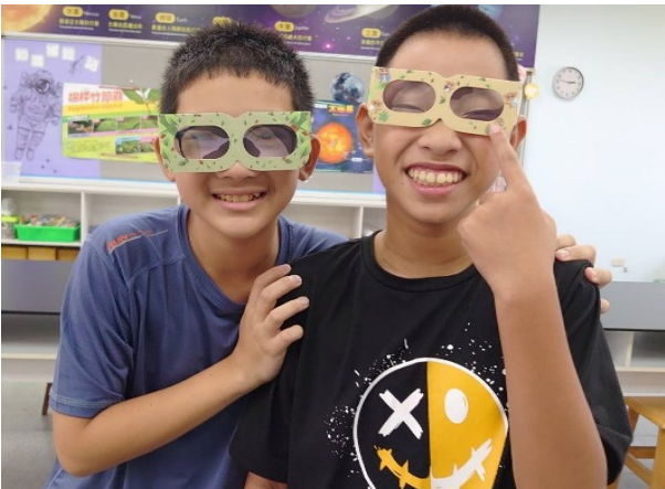
申請愛盲基金會防盲桌遊，讓學生在遊戲中學習視力保健的方式