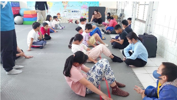
每年定期實施四至六年級學生體適能檢測-捲腹仰臥起坐施測