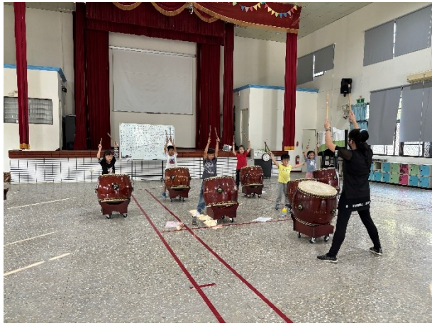
低年級擊鼓團社團課程照片