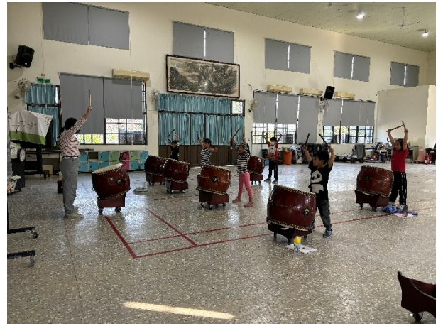
低年級擊鼓團社團課程照片