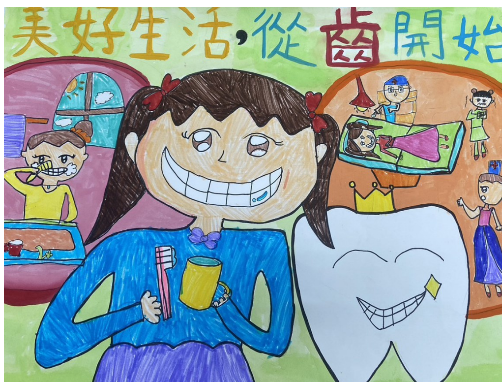
鼓勵學生進行口腔繪圖比賽-三甲學生榮獲佳作作品