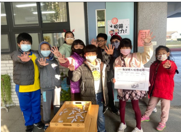
結合校內活動進行健促議題闖關活動-耶誕英語日