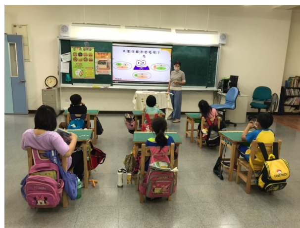
落實教學活動：學生健康飲食課程