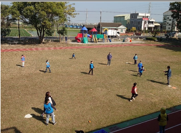
學校活動大多設計成混齡方式進行，學生之間彼此協助，同儕互動佳(樂樂棒球賽)