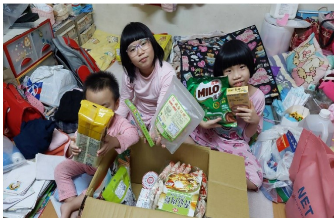
協助弱勢家庭申請相關物資或助學金補助，家中有突發狀況或長假後均進行家訪關懷。(兒福假期物資)