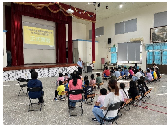
每學期初進行友善校園宣導(112 學年度下學期)