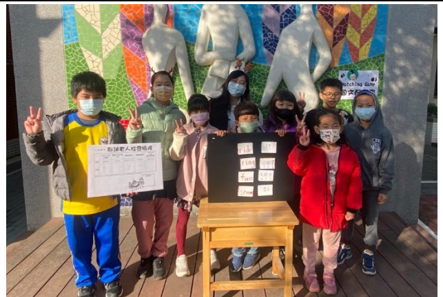
學校活動大多設計成混齡方式進行，學生之間彼此協助，同儕互動佳(耶誕節闖關)