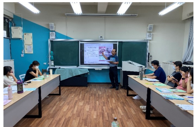
校務會議由校長進行教師正向管教相關內容說明