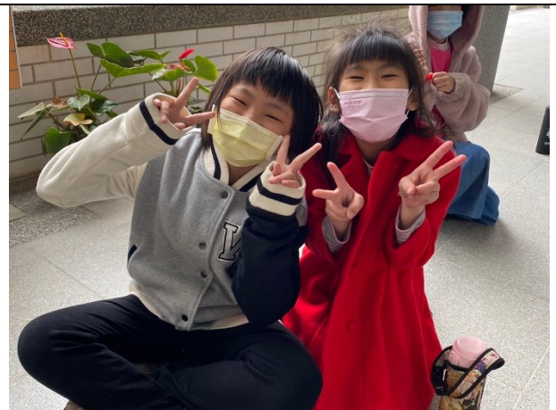
教師同仁會整理家中狀態良好的衣物或鞋子給弱勢學生，讓學生能感受到關愛的心理滿足。