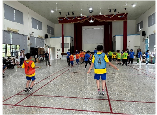
學校活動大多設計成混齡方式進行，學生之間彼此協助，同儕互動佳(運動會趣味競賽)