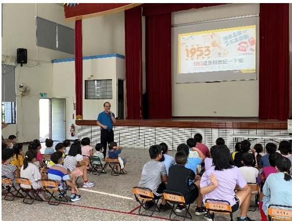
每學期初進行友善校園宣導(112 學年度上學期)