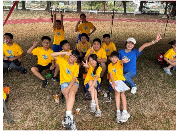
班級師生相處融洽，師生互動良好(四甲)