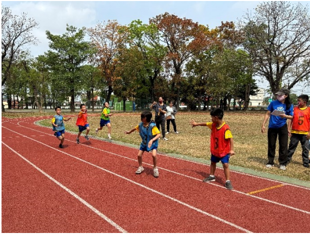
學校活動大多設計成混齡方式進行，學生之間彼此協助，同儕互動佳(運動會大隊接力練習)