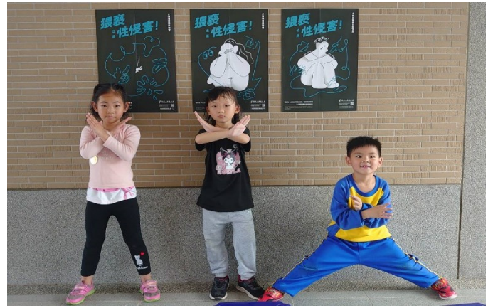
每學期進行性別平等課程及相關宣導活動，建立正確兩性相處觀念(性別平等宣導-海報張貼)