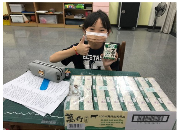
申請相關校外單位補助，提供弱勢學生支援與關懷(乳品補助)