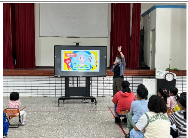
進行全校性反霸凌宣導(襪！我們不一樣)