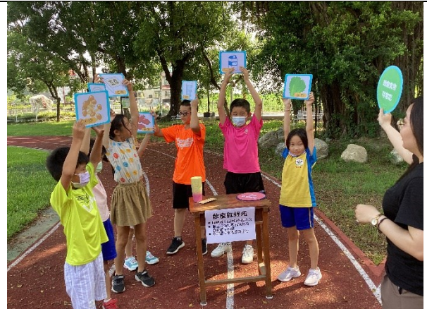
學校活動大多設計成混齡方式進行，學生之間彼此協助，同儕互動佳(開學迎新闖關活動)