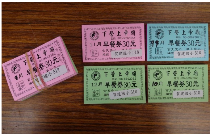
申請相關校外單位補助，提供弱勢學生支援與關懷(北極殿早餐券)