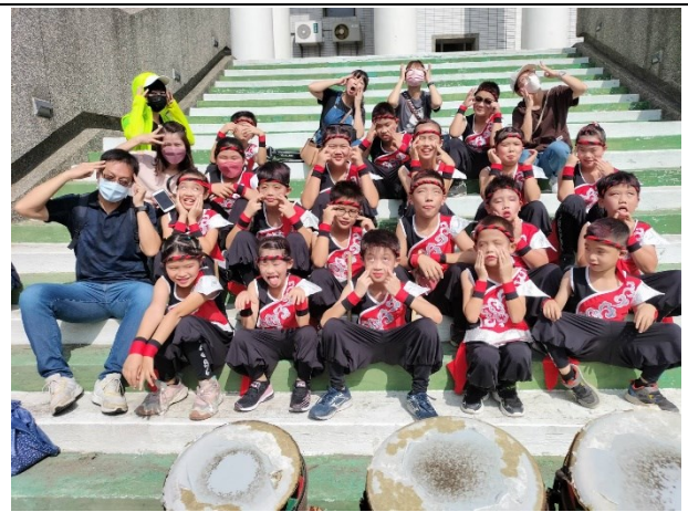
全校師生相處融洽，師生互動良好(鼓團表演合照)