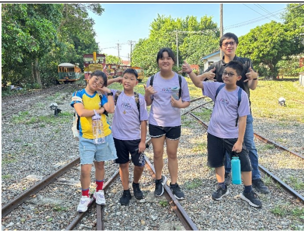
班級師生相處融洽，師生互動良好(五甲)