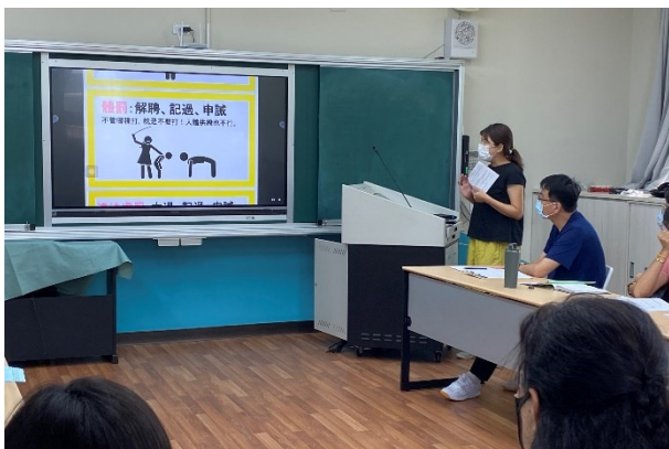
校務會議由學務組進行教師正向管教內容說明