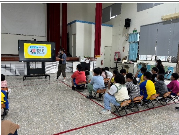
進行全校性反霸凌宣導(襪！我們不一樣)