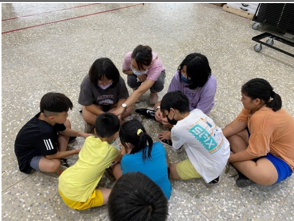
學校活動大多設計成混齡方式進行，學生之間彼此協助，同儕互動佳(開學迎新闖關活動)