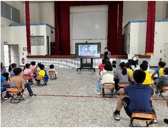
每學期進行性別平等課程及相關宣導活動，建立正確兩性相處觀念(性別平等宣導)