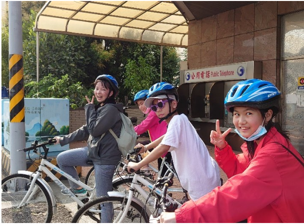
班級師生相處融洽，師生互動良好(六甲)