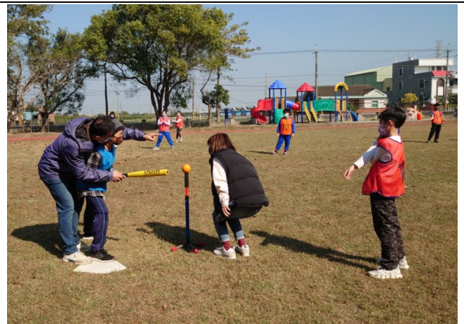
學校活動大多設計成混齡方式進行，學生之間彼此協助，同儕互動佳(樂樂棒球賽)