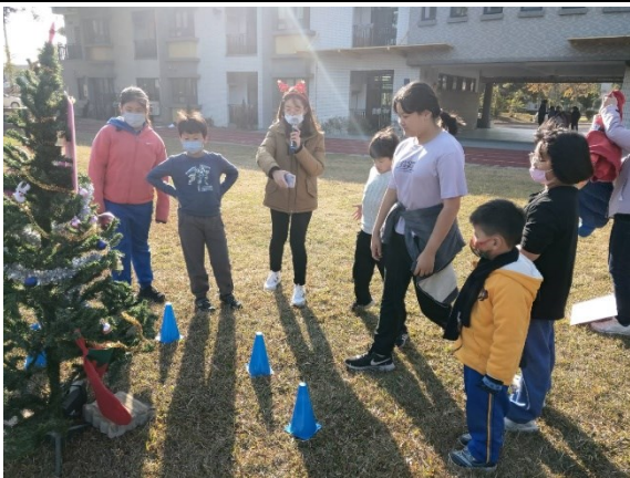
學校活動大多設計成混齡方式進行，學生之間彼此協助，同儕互動佳(耶誕節闖關)