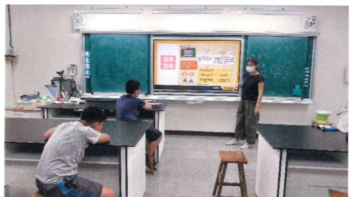
三年級_配合9月份主題海報(龍眼)進行飲食教育課程