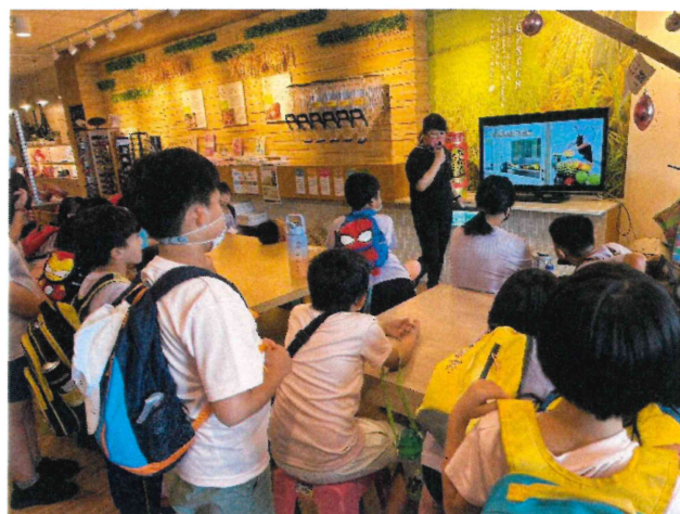
全校_戶外教育配合便當觀光工廠參觀進行飲食教育課程