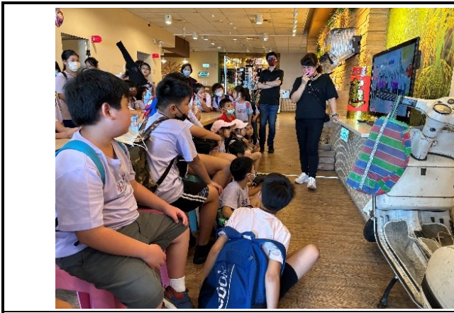
申請教育局「就愛 LOCAL MIT-在地化探索 Made in Tainan」計畫，結合戶外教學及飲食教育課程卡多良食故事館之館方人員進行導覽講解