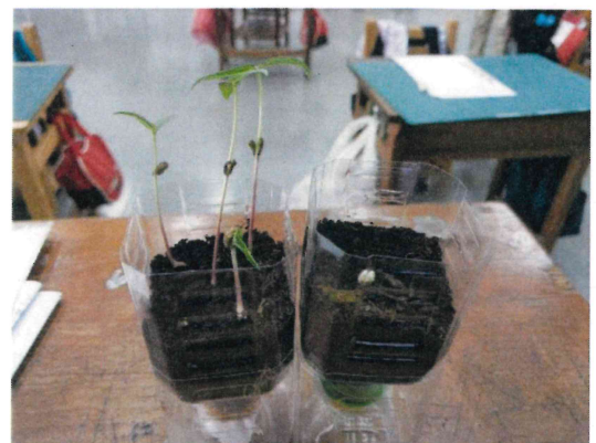
一年級_配合生活課程種植綠豆進行飲食教育課程