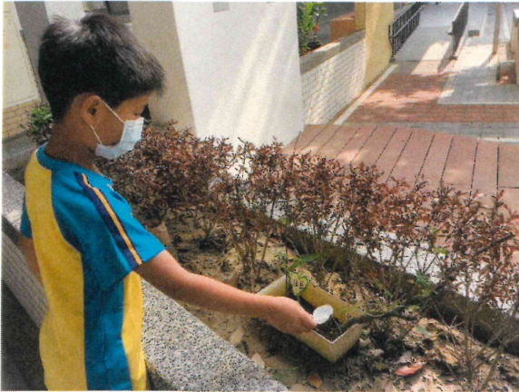
一年級_配合生活課程種植植物並進行飲食教育課程