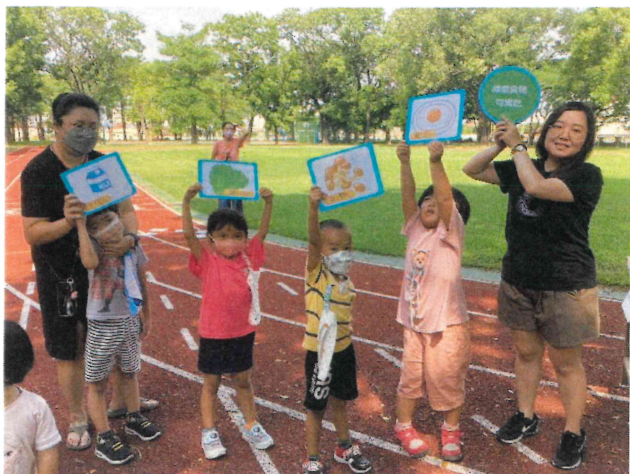
全校_開學闖關活動設計飲食教育關卡進行教學