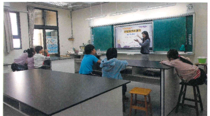
三甲_配合自然課程進行飲食教育活動_惜食及食物保存方法