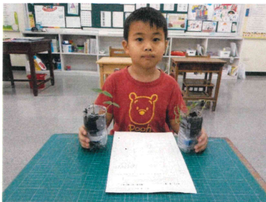
一年級_配合生活課程種植綠豆進行飲食教育課程