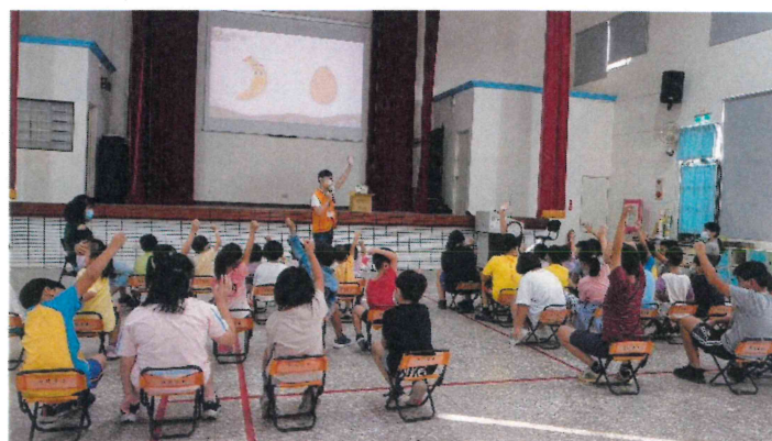
全校_配合安德烈基金會減碳宣導進行食物碳足跡觀念教學