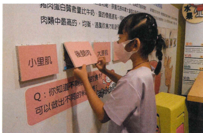
全校_戶外教育配合便當觀光工廠參觀進行飲食教育課程