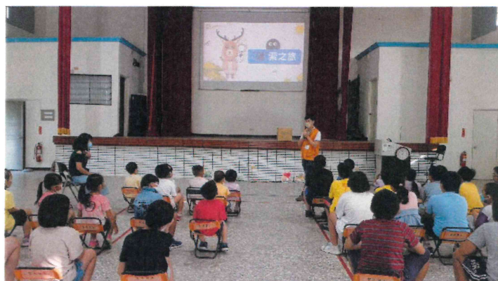
全校_配合安德烈基金會減碳宣導進行食物碳足跡觀念教學