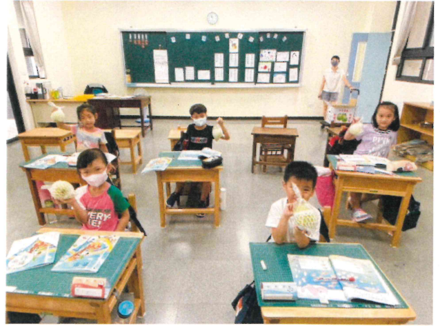
全校_校友致贈學生芭樂，隨機進行飲食教育課程