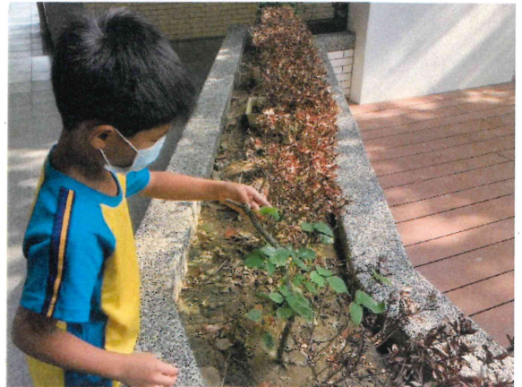
一年級_配合生活課程種植植物並進行飲食教育課程