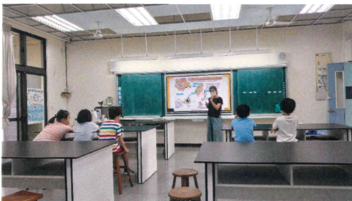
二甲_申請全聯福利熊蔬果魔法學院教材進行飲食教育活動