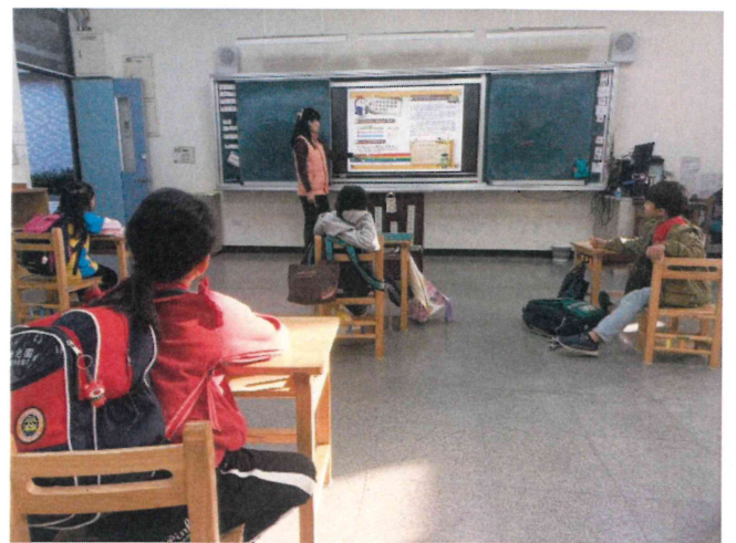
一甲_申請全聯福利熊蔬果魔法學院教材進行飲食教育活動