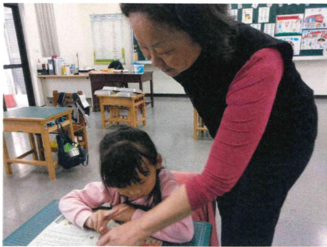
三年級_配合3月份花椰菜主題進行飲食教育課程