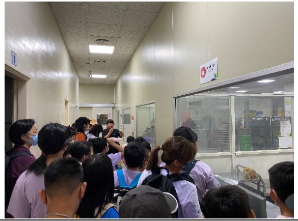
申請教育局「就愛 LOCAL MIT-在地化探索 Made in Tainan」計畫，結合戶外教學及飲食教育課程便當製程產線參觀