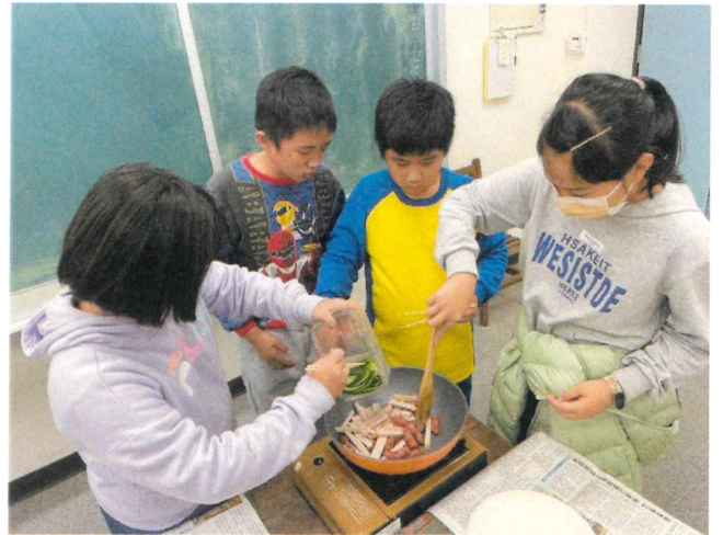
五甲_配合校本課程進行飲食教育烹飪活動