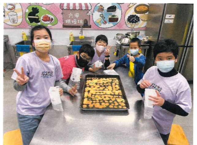
高年級_職業探索課程搭配烘焙課程進行飲食教育課程