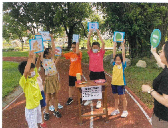
全校_開學闖關活動設計飲食教育關卡進行教學