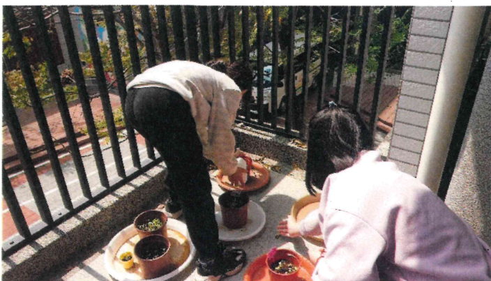
三年級_配合自然課程種植小白菜進行飲食教育課程