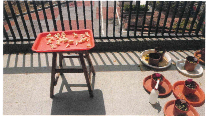
三年級_配合3月份花椰菜主題進行飲食教育課程