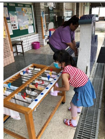
說明：一起練習洗手五步驟師、搓、沖、捧、擦。