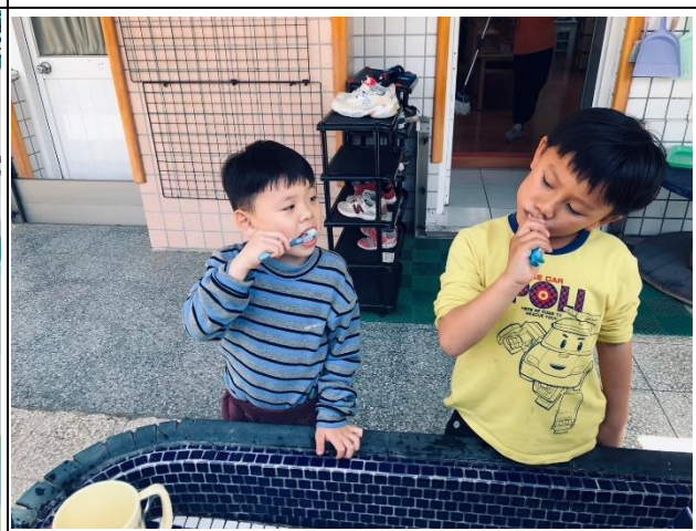
說明：幼兒實施操作