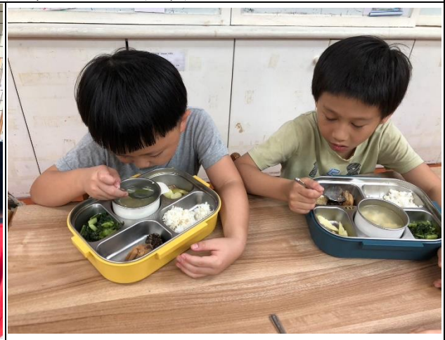
說明：利用分格餐盤讓孩子有均衡營養的概念。