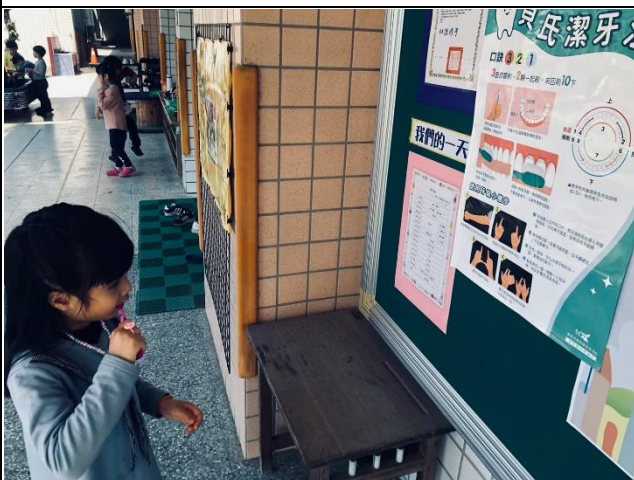
說明：幼兒實施操作