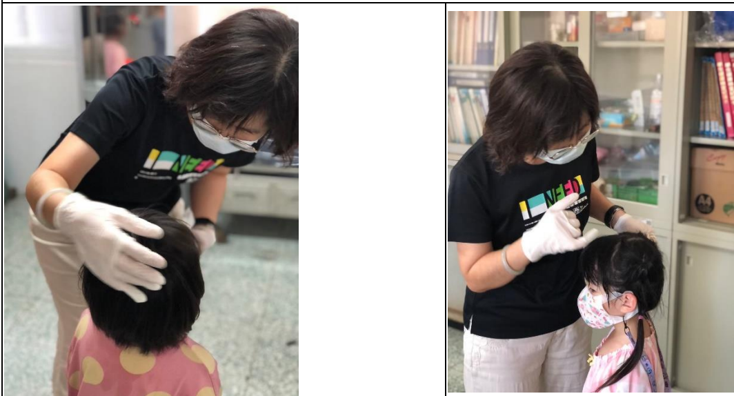
說明：護理師細心檢查幼生是否其他家庭衛生不良等問題。