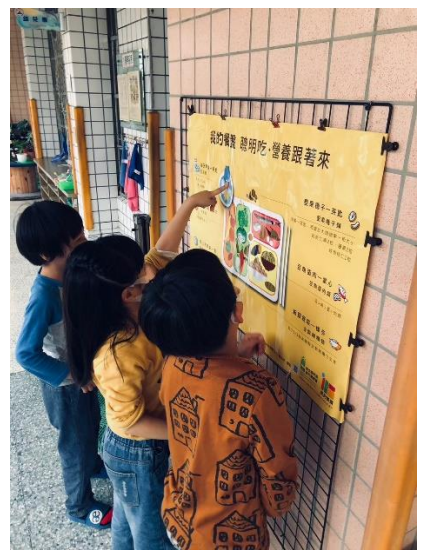
說明：利用分格餐盤讓孩子有均衡營養的概念。