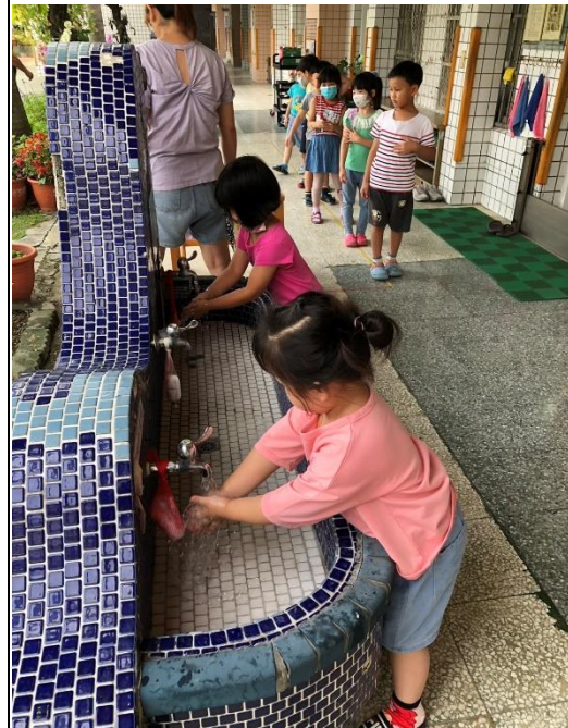
說明：利用繪本『我們來洗手』來提醒孩子洗手的重要性