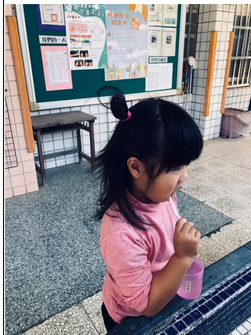
說明：幼兒實施操作