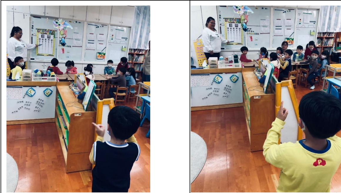
說明：視力檢查前視力表教學