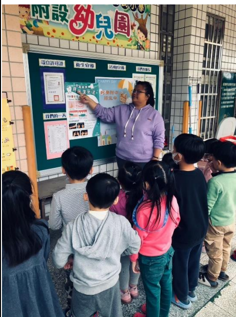
說明：老師解說貝式潔牙法