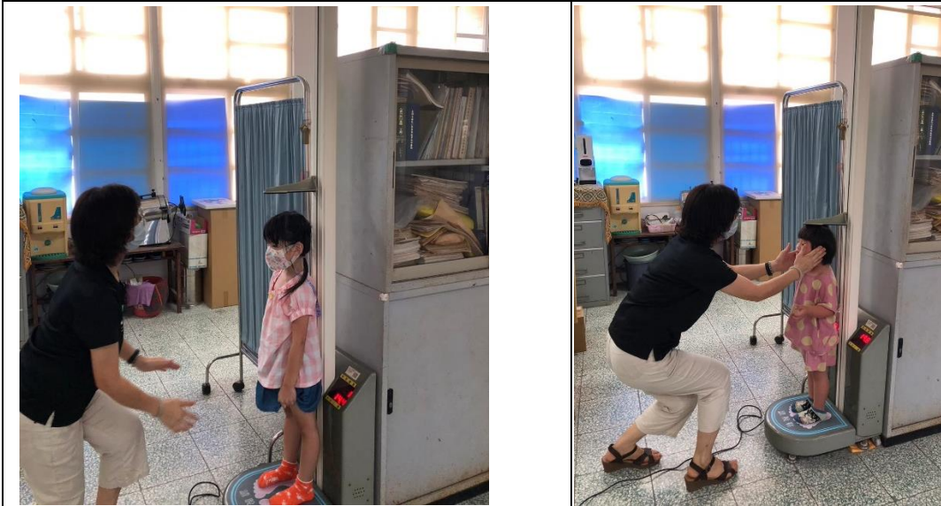
說明：開學初，健康中心進行身高體重測量等基本檢查