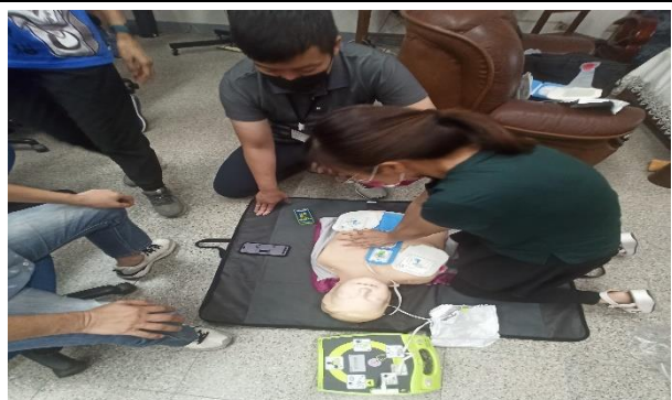
說明：教師認真學習操作 AED 及 CPR