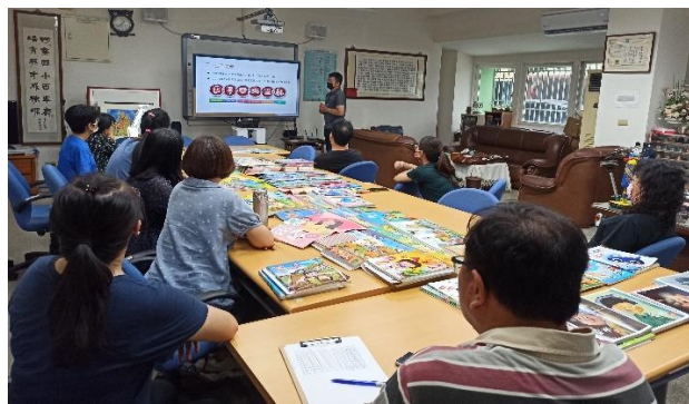
說明：講師講解生存之鏈的關係及重要性