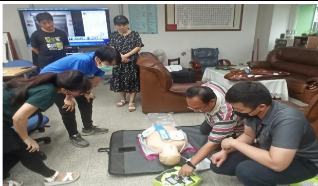
說明：教師認真學習操作 AED 及 CPR