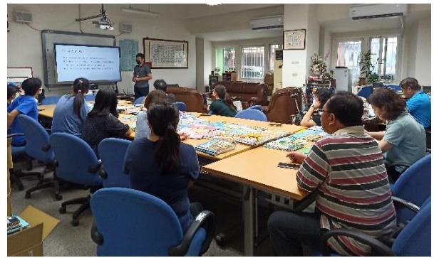
說明：講師講解 AED 的功能及操作方法