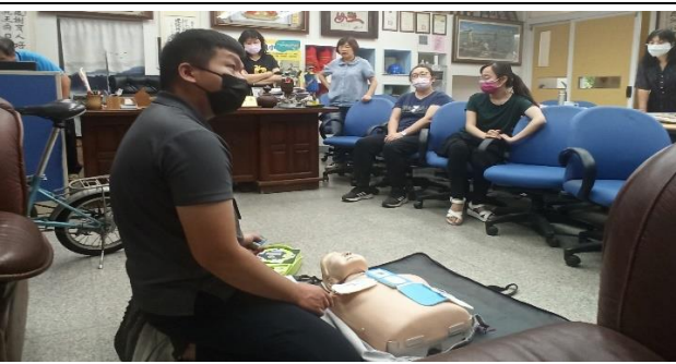
說明：講師講解並示範 AED 電擊貼片操作方法及注意事項