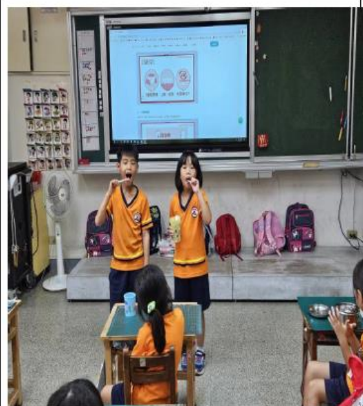
說明：校本特色(潔牙小天使)