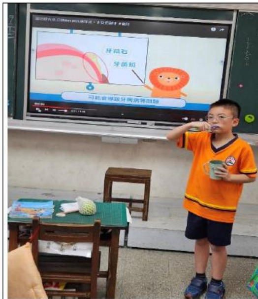
說明：以學生擔任潔牙推廣角色(潔牙小天使)