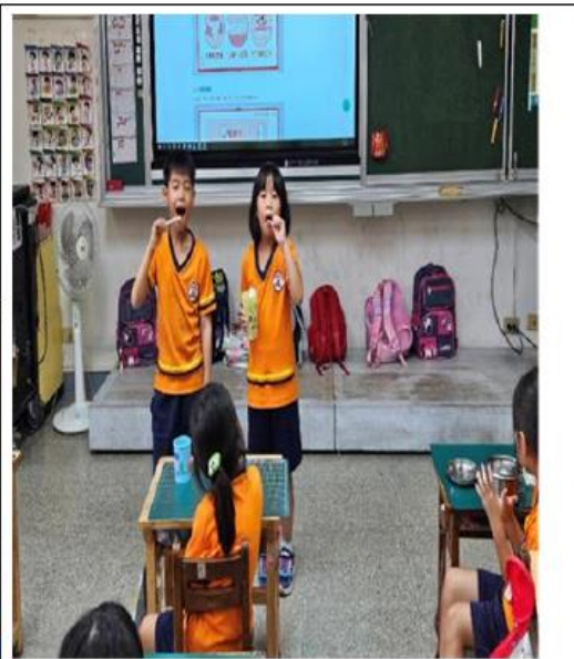
說明：班級潔牙小天使