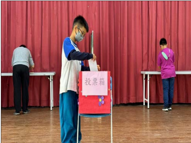
說明：圈票後，投下神聖一票！