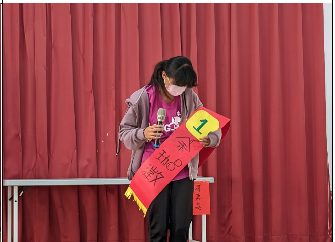
說明：宣布當選感言。