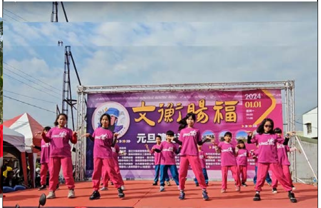
說明：舞蹈-受邀校外表演