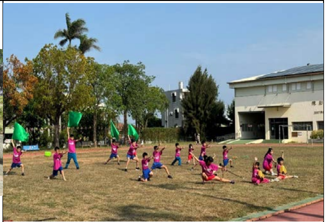
說明：武術隊校慶表演