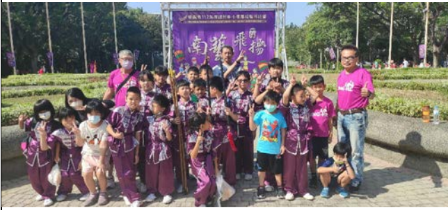
說明：成立運動團隊-武術隊傳藝比賽