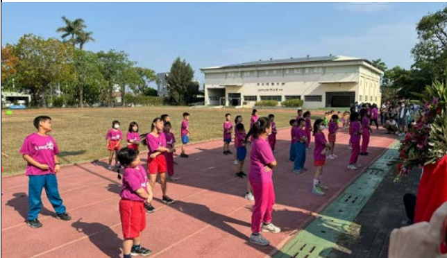
說明：成立運動團隊-舞蹈-校慶表演