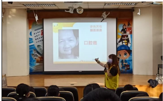
說明：陽光基金會菸檳危害防制宣導講座