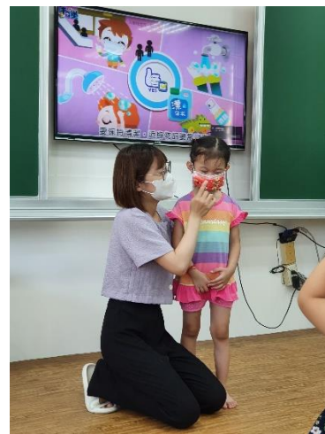
說明：疾病預防宣導-口罩的正確配戴方式