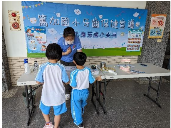
說明：幼兒園與國小共同進行潔牙闖關活動