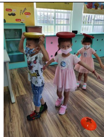
說明：飛盤-平衡遊戲