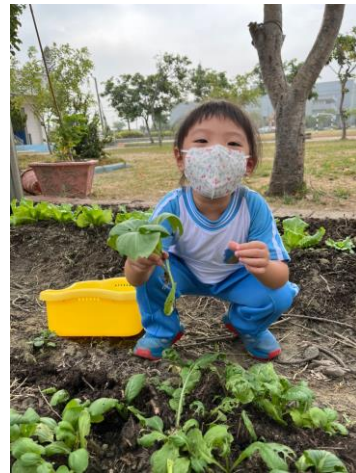
說明：健康蔬菜採收