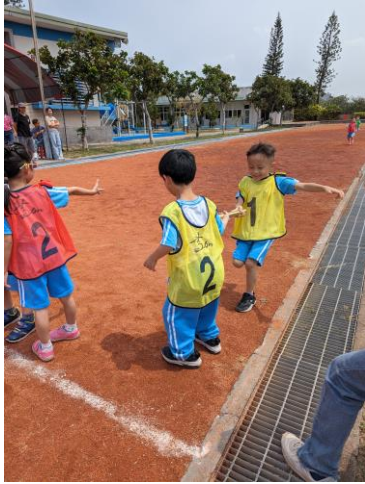
說明：幼兒園與國小共同進行體育活動