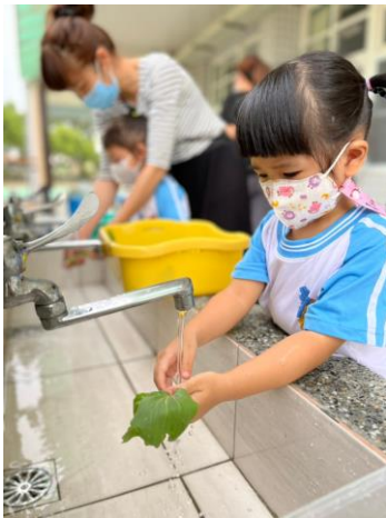
說明：健康蔬菜清洗烹飪品嘗-蔬菜烘蛋