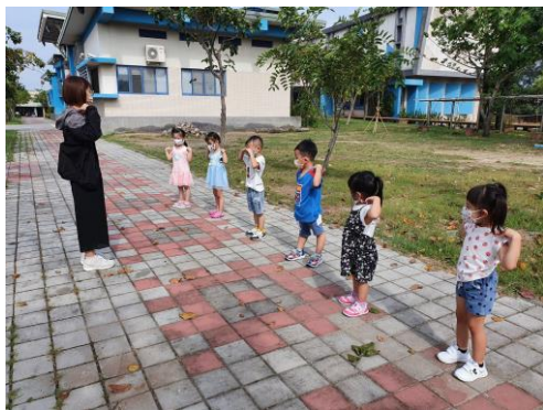
說明：大肌肉活動-暖身