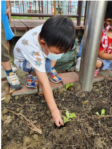
說明：健康蔬菜種植