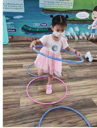
說明：呼拉圈運動-跨跳