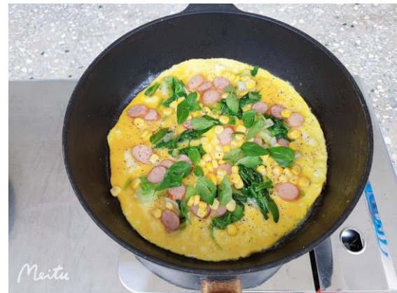
說明：健康蔬菜清洗烹飪品嘗-蔬菜烘蛋