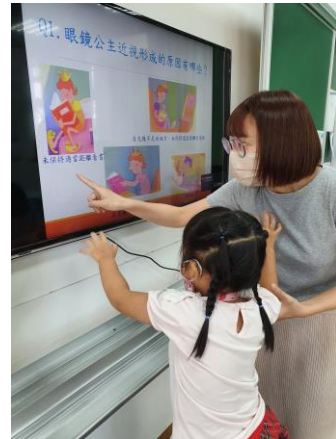
說明：視力宣導-眼鏡公主