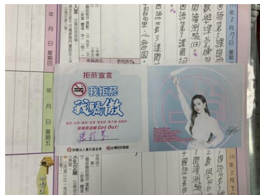
112 學年度普及化運動-第 3 屆馬拉松接力班際對抗賽頒獎典禮