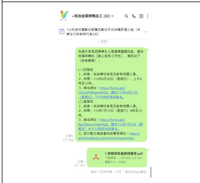
學校通透 LINE 轉達健康資訊