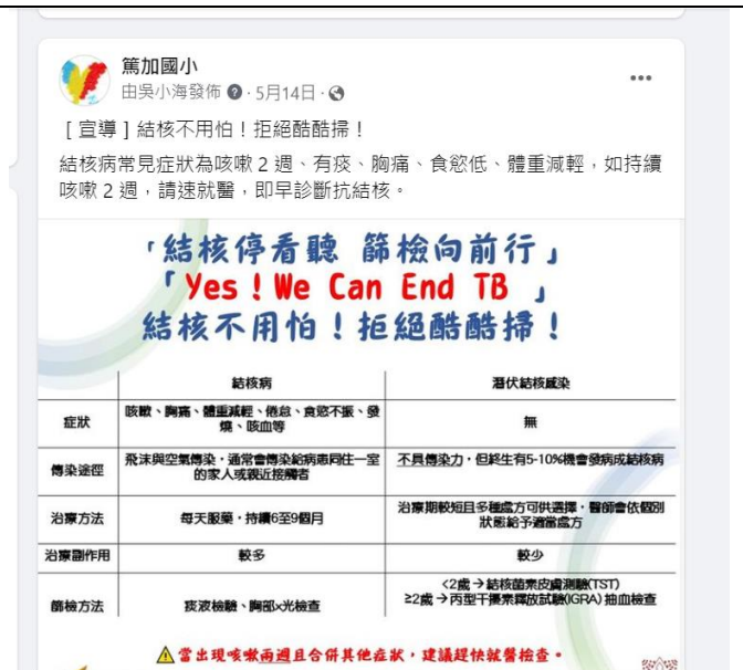
學校透過臉書向民眾傳達健康資訊